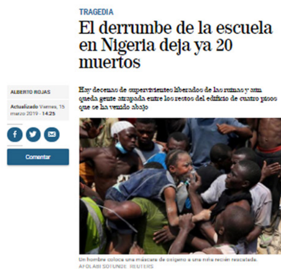
magen 3 – Diferenciación de elementos de la noticia entre una información de agencia y otra firmada. El Mundo.

Aunque los titulares son semejantes, en el caso de las entradillas mientras en el primero se refiere a las personas heridas fallecidas, en el segundo prioriza la existencia de supervivientes. La segunda fotografía muestra a una persona negra en una acción de colaboración y apoyo mutuo mientras que en la primera, el niño del primer plano refleja una situación trágica. Mientras de tema principal se ha utilizado “África” en la nota de prensa, en el caso de la firmada se es más específico al emplear “tragedia”. El primer párrafo de cada una de las noticias confirma la división establecida en el apartado de metodología que dis-cierne entre una voluntad meramente informativa y una amplificadora del contexto: