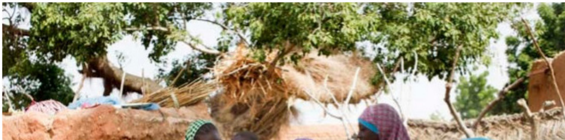
Imagen 1 – Información sobre matrimonio infantil donde predomina la vía pasional.