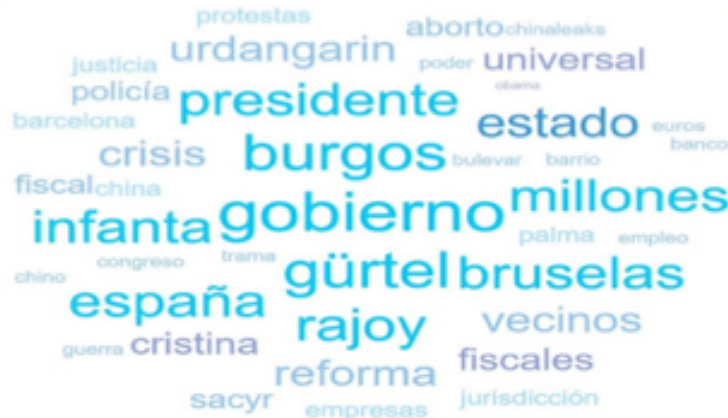
Figura 1: Nube de palabras de las noticias de agenda de la portada de El País (WebQDA)

ca y guerras culturales). Una nube de palabras sobre las noticias de agenda de El País devuelve destacados términos tales como Infanta, Burgos, Rajoy, Gobierno, Gürtel, Urdangarín, aborto, vecinos (de Burgos), reforma (de la Ley del aborto), Sacyr, etc. (Figura 1).