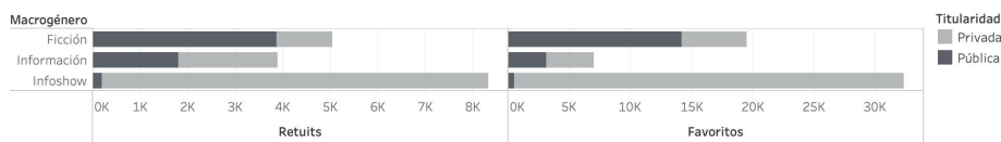
Figura 4: Activación de la audiencia según titularidad y macrogénero

En este sentido hemos tenido en cuenta los retuits y los likes a los contenidos publicados en tanto que estas acciones inciden directamente en la visibilidad de los contenidos dentro de Twitter. Según se desprende de nuestras observaciones, el info-show seguido de la ficción son los macrogéneros que consiguen involucrar más eficazmente a los usuarios en la distribución del contenido publicado (figura 4) y son los canales privados los que logran mejores resultados en este apartado.