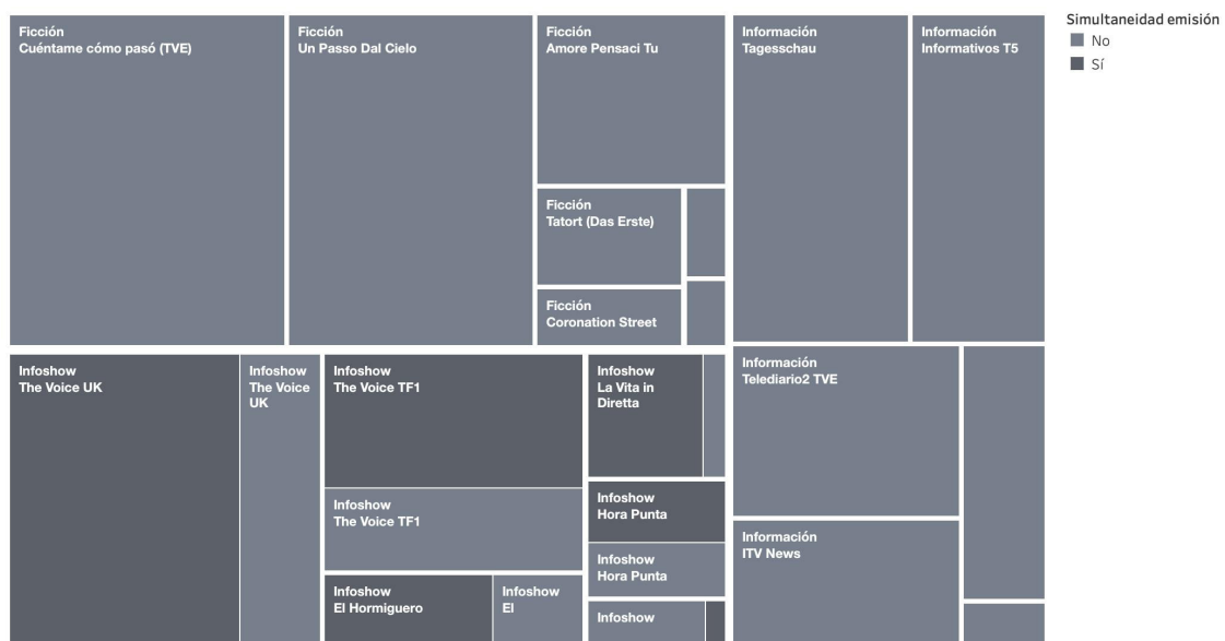
Figura 1: Simultaneidad con la emisión de los tuits publicados.

En la figura 1 se representa el volumen de publicación de tuits desde las cuentas oficiales de cada programa. El tamaño de los cuadrados es proporcional al número de tuits publicados y estos se agrupan a partir de los macrogéneros de los programas. Observamos como info-show y ficción acumulan una mayor actividad.