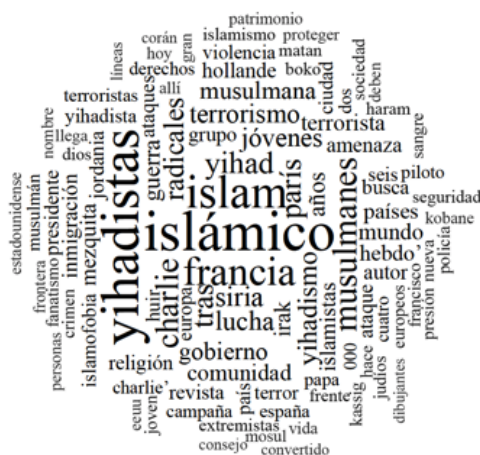
Figura 3: Léxico prevalente.

López et al. (2010) señalan, en una investigación realizada sobre la imagen del mundo árabe y musulmán en la prensa española, que existe un uso excesivo, innecesario y a veces erróneo de los términos islámico e islamista para hablar de terrorismo de grupos como Al-Qaeda. Los apelativos islámico e islamista no son sinónimos aunque muy frecuentemente se usen como tal. El primero hace referencia, a “todo aquello relacionado con el islam como religión” y el segundo alude a “radicalidad y fundamentalismo”. Usarlos indistintamente ayuda a asimilar que todo lo relacionado con el islam es radical y fundamentalista. Por otro lado, al asociarlos de manera habitual a la palabra “terrorismo” se consigue reforzar la idea de que todo lo relacionado con el Islam (islámico) es fundamentalista y radical (islamista) y que además todo lo islamista es terrorista. (Olmos Alcaraz, 2015: s/p)