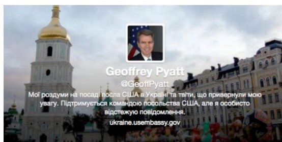
El perfil en Twitter del embajador de EE UU en Ucrania.

Imagen 1. Ejemplo de pantallazo publicado en El País en 2014 acompañando la noticia “La diplomacia digital de Estados Unidos”