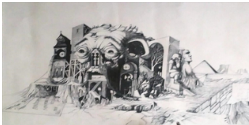
Figura 1: Cabecera del programa Más Allá