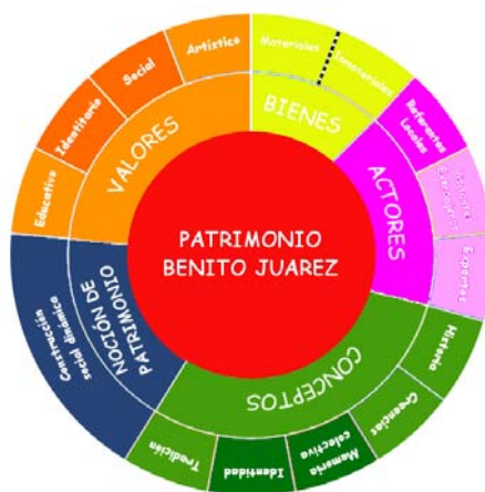
Figura 2. Gráfico de síntesis de resultados. Elaboración propia.

Cabe destacar que entre los artículos periodísticos seleccionados se encuentran, además, una serie de noticias referidas al evento en sí mismo que no enfatizan en ningún tipo de bien en particular, sino que reconocen la importancia que tuvo el evento para la activación del patrimonio a nivel local, aunque también se construye en ellas, a través del discurso de la organizadora, algunas nociones sobre lo patrimonial. En este punto aparece una visión amplia que incluye la importancia de