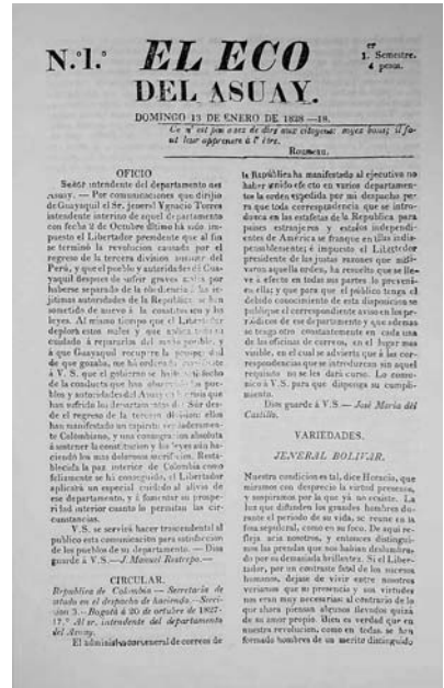
Imagen 2. Portada del primer número de El Eco del Azuay de Fray Vicente Solano.

Entre los logros de Fray Vicente Solano destaca la publicación del Semanario Eclesiástico , “...fundado en 1835, tenía por objeto salir a la defensa de los principios católicos atacados por El Ecuatoriano del Guayas...” (Ceriola, 1909: 21). A través de dicho periódico luchó contra las ideas vanguardistas del decreto de exclusión a los sacerdotes en la convocatoria para elecciones para Diputados a la Asamblea Constituyente. La publicación de este periódico lo llevó a vivir constantes polémicas: con el Coronel Francisco Eugenio Tamaríz, político español, que para el año 1835 se des-