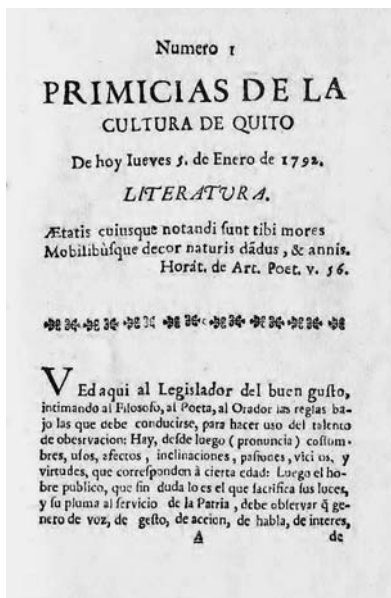
Imagen 1. Portada del primer número de Primicias de la Cultura de Quito de Eugenio Espejo.

En 1750 se establece la primera imprenta en el Ecuador, propiedad de los Jesuitas. Antes de ello, el único medio con el que contaba el pueblo para manifestarse era el escrito en pared. Eugenio Espejo basándose en esta realidad y al ver que México, Guatemala y Perú ya contaban con periódicos pensó que la capital Quito debía publicar su primer periódico, y así lo hizo.