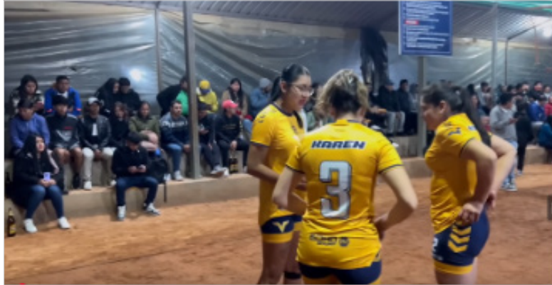
Figura 2. Captura de pantalla de un partido de ecuavóley.

tos manuales como el que muestra en la Figura 2. También se observan transiciones entre sets y secuencias musicales en algunos videos del canal Morlaquitas Teffa Merchán, lo que sugiere una voluntad estética de darle mayor espectacularidad y dinamismo al contenido.