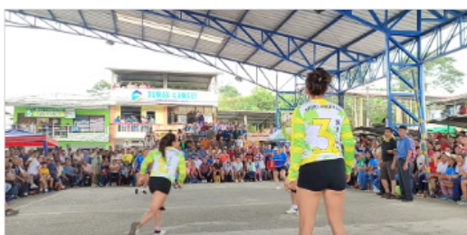
Figura 1. Capturas de pantalla de dos partidos de ecuavoley (2025).

En cuanto al componente visual, se observa que la mayoría de videos analizados utiliza planos generales estáticos de la cancha, como se muestra en la Figura 1, registrados desde un único punto elevado (habitualmente una tarima improvisada o un segundo piso). Esta decisión técnica responde más a la posibilidad de capturar todo el campo de juego que a una intencionalidad estética o narrativa. Esta toma abierta permite seguir el desarrollo general del partido, limita el realce de las acciones individuales, expresiones corporales y reacciones tácticas de las jugadoras. Por ejemplo, en los encuentros «Las Amazonas vs Las Rositas» (ECUAVOLEY OTACELL, 2025) el plano se mantiene inalterado durante toda la duración del partido, lo que impide visualizar con claridad los gestos técnicos como bloqueos, fintas o saques colocados de cada una de las jugadoras.