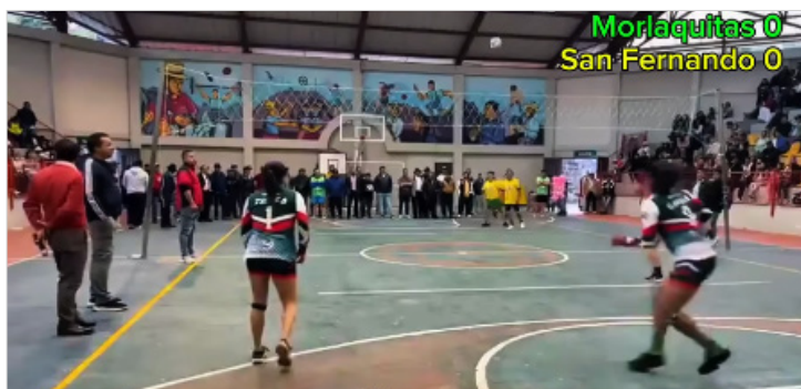
Figura 3. Saque inicial en un partido de ecuavóley (2025).