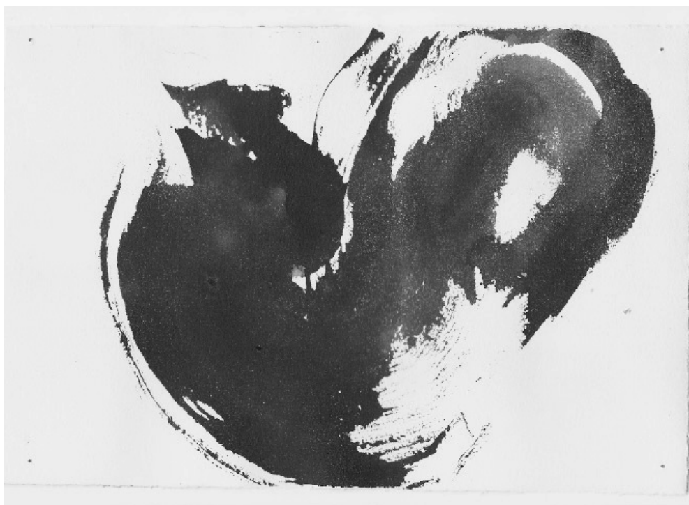
Tinta china sobre papel – 20 x 30 cm