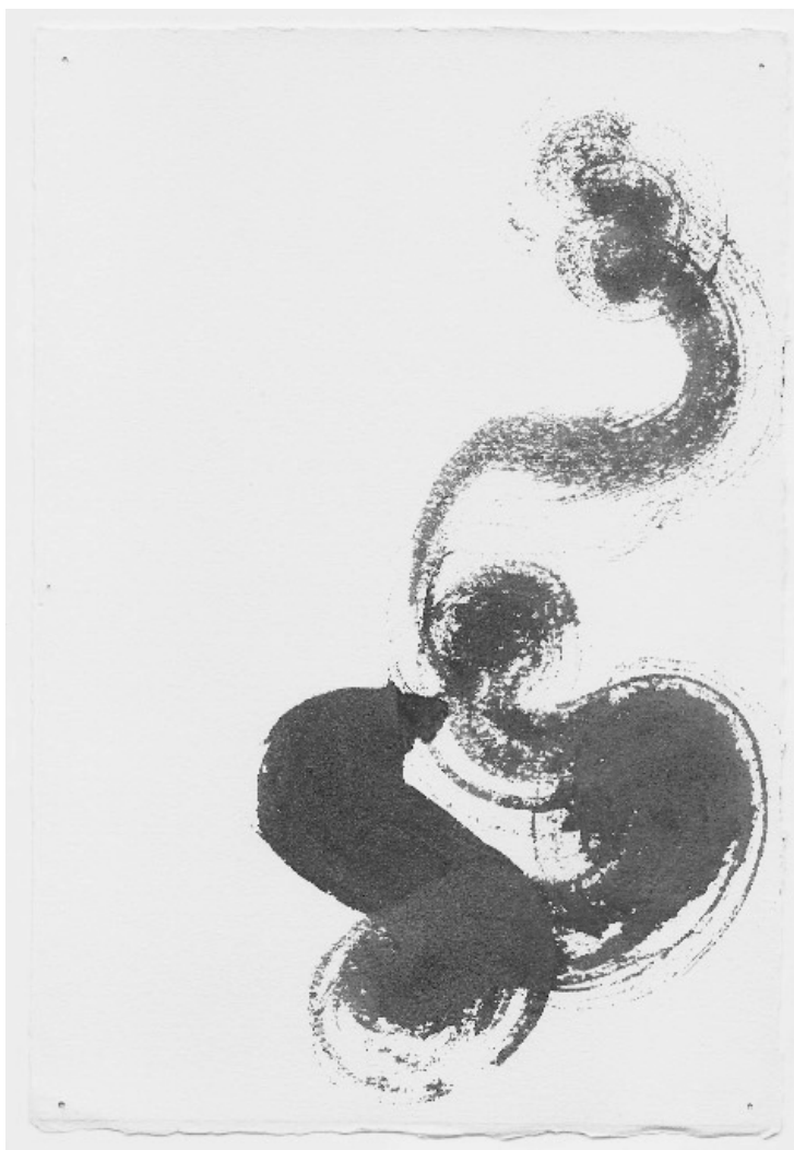
Tinta china sobre papel – 20 x 30 cm