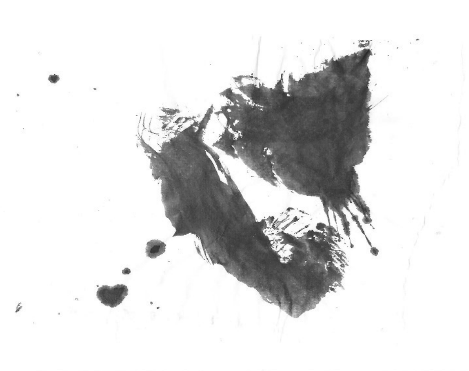
Tinta china sobre papel – 20 x 30 cm