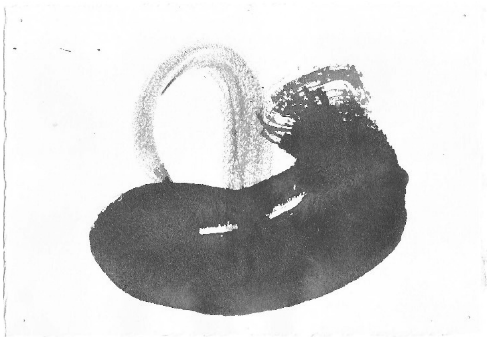
Tinta china sobre papel – 20 x 30 cm