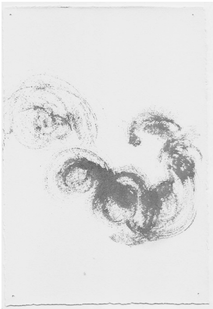
Tinta china sobre papel – 20 x 30 cm