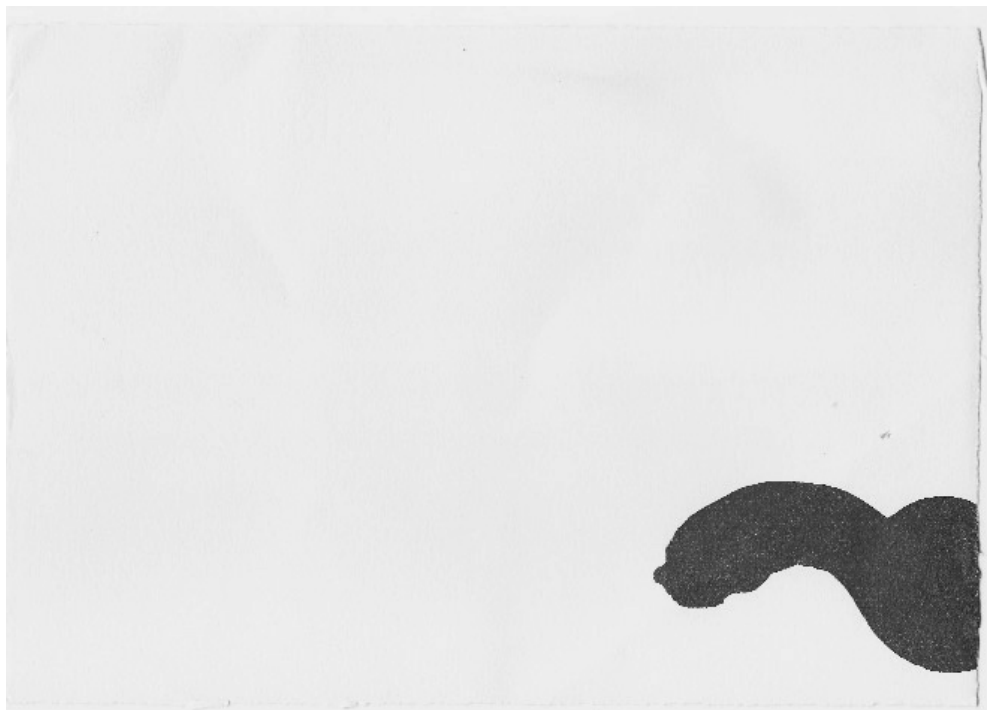
Tinta china sobre papel – 20 x 30 cm