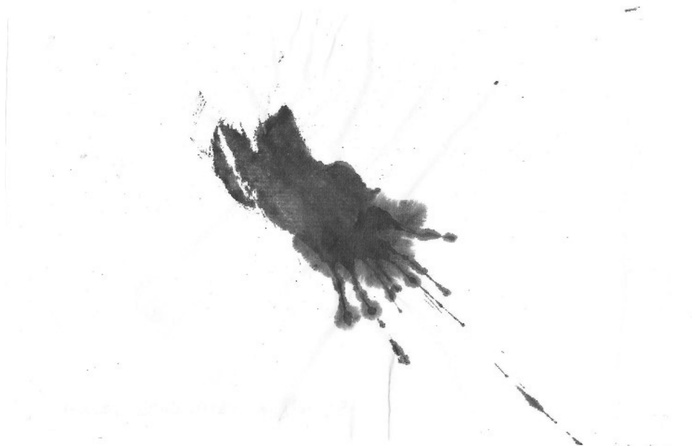
Tinta china sobre papel – 20 x 30 cm