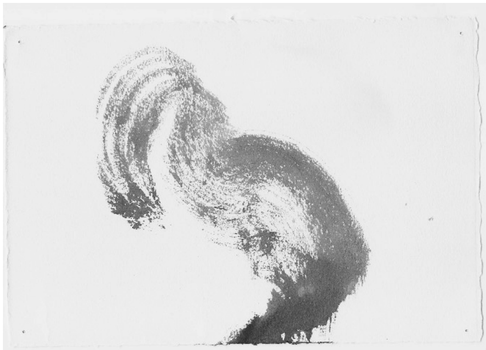
Tinta china sobre papel – 20 x 30 cm