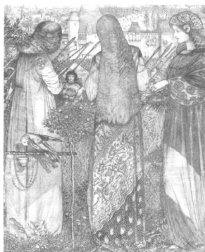
Figura 5: Going to the Battle , 1858 Pluma, tinta y aguada sobre pergamino, 22.5 x 19.5 cm Fitzwilliam Museum, Cambridge