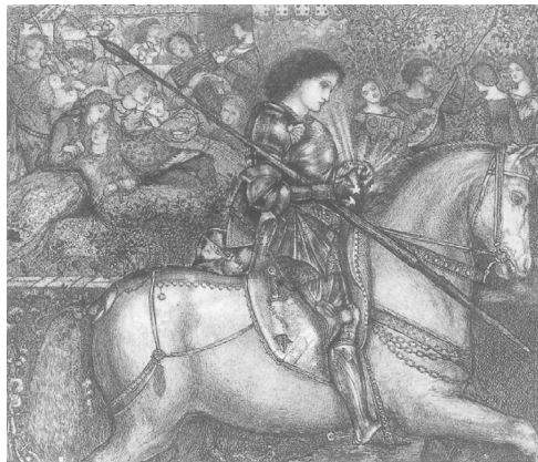
Figura 2: Sir Galahad Riding Through a Mysterious World , 1858 Pluma y tinta negra sobre pergamino, 15,6 x 19,2 cm Harvard University Art Museums

Además de su participación en los ya señalados murales de Oxford, de esos años en los que Rossetti fue su maestro y protector datan obras como Sir Galahad Riding Through a Mysterious World (Sir Galahad cabalgando a través de un mundo misterioso, fig. 2), de 1858. Esta pintura nos remite a la obra de William Morris compuesta en el mismo año y titulada Sir Galahad, A Christmas Mystery (Sir Galahad, un Misterio de Navidad). En ella el héroe favorito de Burne-Jones, Sir Galahad, cabalga cabizbajo hacia su destino, mirando fijamente la vela que porta y sin dejarse tentar por aquello que le rodea. Al fondo parejas de amantes disfrutan del amor cortés, amor que le está vetado a Galahad si quiere alcanzar el Santo Grial. La composición, la concepción del espacio, la ausencia de perspectiva lineal... nos