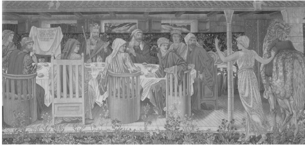
Figura 11: The Holy Grail Tapestries Morris & Co (Diseñados por Edward Burne-Jones)

gún hombre podía sentarse salvo aquél que pueda culminar la aventura. Lancelot está enfrente de la silla, y se señala a sí mismo como si preguntara si él es el que allí se sentará. Gawain y Lamorak y Percival y Bors están todos allí.