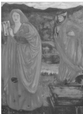
Figura 7: Merlin and Nimue , 1861 Acuarela y gouache, 64 x 52 cm Victoria & Albert Museum (Londres)

por su amor, es destruido por Nimue, que le rechaza. Cabe señalar que Burne-Jones refutó de plano la versión que Tennyson había dado de este suceso y que, según contaba Val Prinsep, su indignación fue tal al leer el poema antes de su publicación que Tennyson finalmente cambió el título de su idilio Nimue por Vivien ( Viviana ) 24 , nombre que recibe esta Dama del Lago en el romance de Merlín y que difiere de Malory. El motivo del enfado radica en que Tennyson había cargado toda la culpa sobre la Dama del Lago, mientras que Malory señalaba a Merlín como culpable de su autodestrucción (pues es Merlín el que persigue noche y día a la Dama): “ Y no paraba Merlín de asediar a la dama para tener su doncellez; y ésta estaba muy cansada y deseosa de librarse de él, pues lo tenía por hijo de un demonio; pero no podría librarse de él por ningún medio ” 25 . De hecho, Burne-Jones añadió una cita del Libro IV, Capítulo 1, en el marco, alejándose así de cualquier sospecha de que hubiera inspirado su obra en el Idilio de Tennyson.