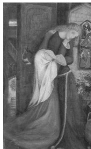
Figura 4: Lady Clare , 1854-1857 Elizabeth Siddall. Acuarela, 13¼ x 10” Colección privada