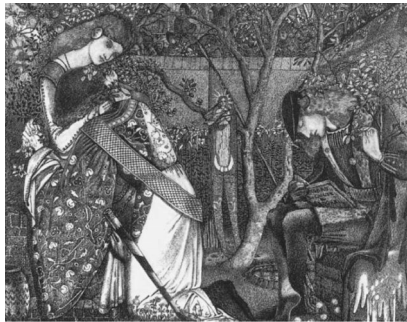
Figura 3: The Knight's Farewell , 1858 Pluma, tinta y aguada sobre pergamino, 15.9 x 19.1 cm Ashmolean Museum, Oxford

trasladan de lleno a las acuarelas que Rossetti estaba realizando en ese momento. Lo mismo sucede con The Knight's Farewell (El adiós del Caballero, fig. 3), ejecutada en el mismo año, en la que podemos contemplar cómo una bella dama se despide de su caballero (tema que por esas fechas trataba Rossetti bajo el título The Chapel before the Lists ), mientras el personaje sentado enfrente de ambos, un joven cuya postura estática también nos remite a un manuscrito iluminado, lee Le roman du quête du Sangrail . Entre la pareja y el joven, un estandarte del que cuelga la imagen de un ángel. Al fondo, entre los manzanos, vemos unos caballeros luchando en la batalla a la que el caballero parte. Como señala Elizabeth Prettejohn 21 hay un paralelismo evidente entre la Dama que pinta Burne-Jones y la bella Lady Clare (fig. 4) que Elizabeth Siddall, esposa y discípula de Rossetti, había diseñado hacia 1854 y completado en 1857. También de 1858 data Going to the Battle (Yendo a la batalla, fig. 5), con una temática semejante e inspirado quizá en el poema The Sailing of the Sword , perteneciente a The Defence of Guenevere y en el que tres damas despiden a sus caballeros.