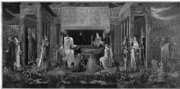
Figura 12: The Last Sleep of Arthur in Avalon , 1881-98