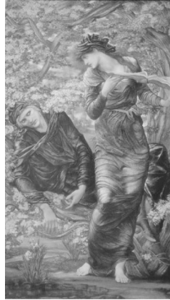
Figura 8: Merlín and Nimue , 1874 Óleo, 186 x 111 cm Lady Lever Art Gallery, Port Sunlight

can a los ideales michelangelescos que tanto había admirado en sus viajes a Italia. Si bien continúa fiel a su amor por lo medieval, la influencia de la pintura renacentista (especialmente de Michelangelo y Botticelli) y de la escultura griega, que marca toda su producción en estos años, se hace patente en esta obra.