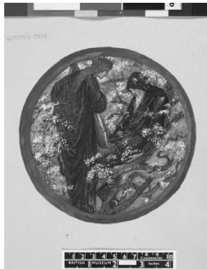
Figura 9: The Witches Tree (The Flower Book, 1882 - 1898) Acuarela y gouache, 31.5 x 23.7 cm British Museum

Burne-Jones retomará el tema dos veces más. En primer lugar, en uno de los diseños de The Flower Book (El libro de las Flores), titulado The Witches Tree (El árbol de las brujas, fig. 9) y realizado en 1882. En este caso Merlín aparece mucho más avejentado y completamente dormido como resultado de los cantos de Nimue, que aparece de perfil tocando un instrumento medieval. Este libro se componía de