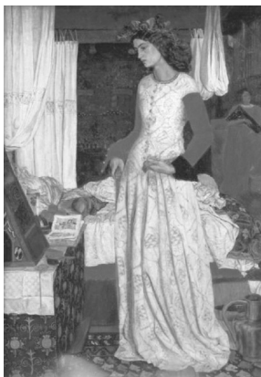
Figura 6: La Belle Iseult , 1858 (William Morris) Óleo sobre lienzo, 71,8 x 50,2 cm Tate Gallery, London

En 1861 se crea la ya mencionada Morris, Marshall, Faulkner & Co. Crear esta empresa de decoración se convierte en algo mucho más importante que intentar imponer un estilo u otro: es una lucha por alcanzar un ideal, un ideal marcado por el amor a la Edad Media y la artesanía frente al dominio de la industria, y por lograr acercar la belleza a todos los hogares, más allá de su estatus social o económico. Queriendo cumplir esa tarea, la después conocida como Morris & Co. fue clave para el resurgir de técnicas tradicionales, tanto en el ámbito de los textiles como en el de otros aspectos de la decoración interior, por ejemplo vidrieras o papel pintado, labores que cada vez más estaban siendo invadidas por las industrias. En concreto, se dedica a la producción manual y supervisión de decoración mural (con cuadros o papel pintado), tallas, vidrieras, trabajos en metal (incluyendo joyería) y mobiliario, incluyendo trabajos textiles 23 . Como iremos viendo, son muchas las obras de la Morris & Co. que están vinculadas temáticamente a la leyenda artúrica, por representar los ideales de una sociedad que, sin duda, se alejaba de la Inglaterra industrial y por el amor que su máximo responsable, William Morris, y su mejor amigo (Burne-Jones), le profesaban.