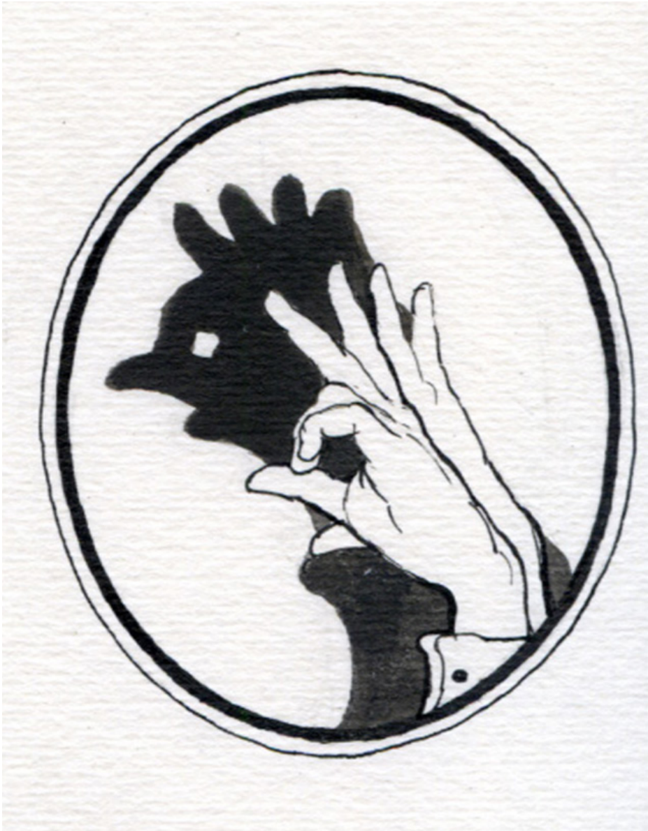
1. Alexandra Semenova. The Cat's House §1. Tinta china sobre papel, 7 x 5 cm, 2014.