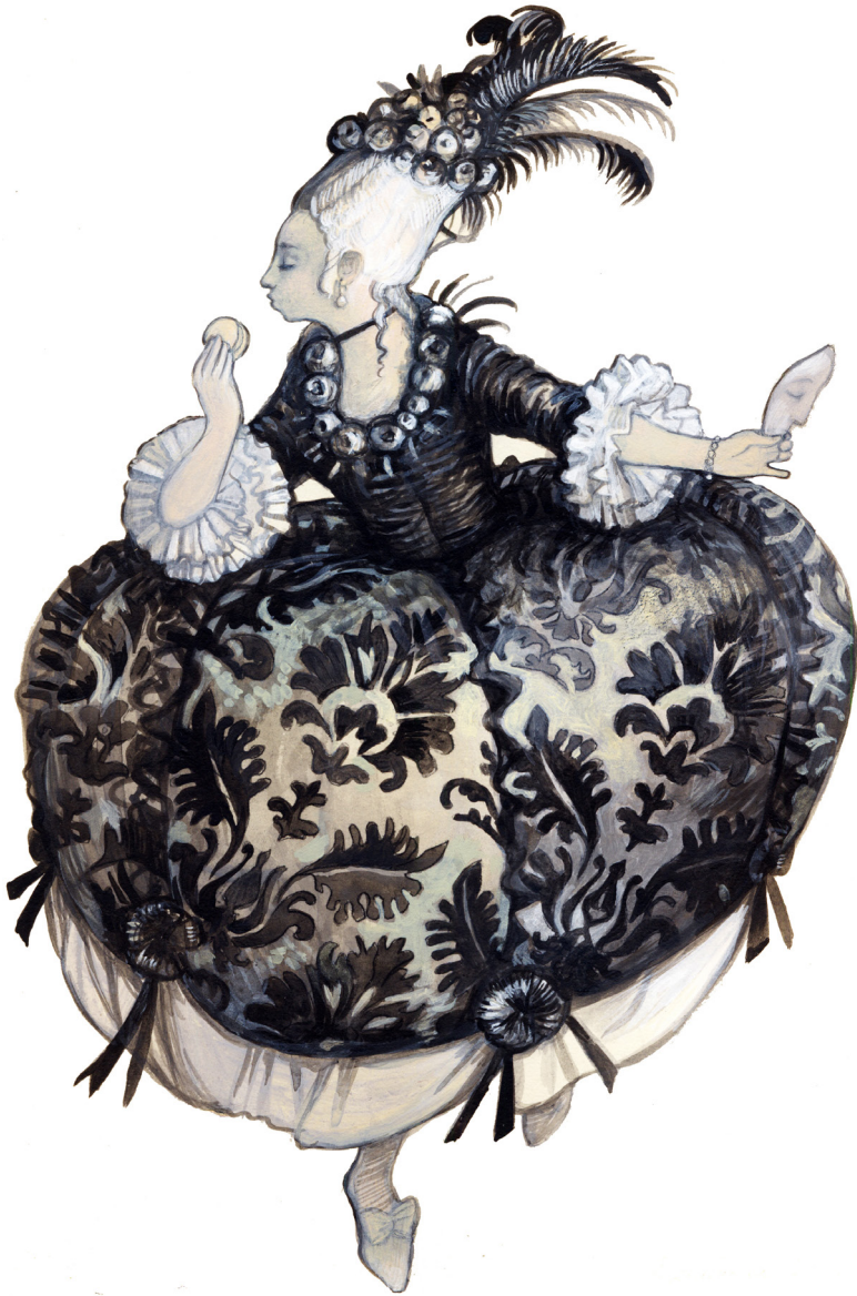
14. Alexandra Semenova. The Gallant Sweet Tooth § 4. Acrílico sobre papel, 21 x 29 cm, 2016.