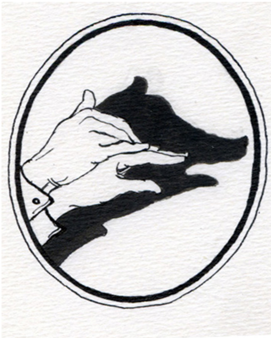
7. Alexandra Semenova. The Cat's House § 2. Tinta china sobre papel, 7 x 5 cm, 2014