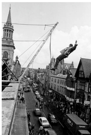
Figura 6. Anónimo (ca. 1970), Bunge jumping del Oxford University Dangerous Sports Club. 35

El puenting es una suerte de experiencia del abismo con profilaxis que, además, no requiere de entrenamiento previo, como puede ser el caso de la experiencia del abismo en la modalidad olímpica del salto deportivo, restándole, con ello, circunspección a la actividad, pues esta nueva experiencia abisal no requiere del cultivo de una habilidad ritual o inteligencia práctica. El saltador olímpico es un deportista y, por ende, un sujeto épico; por el contrario, el practicante de puenting es un jugador: jocosos, farsantes y temerarios. De este modo, el abismo deja de ser una experiencia metafísica al modo planteado por la estética moderna, y se convierte en un mero entretenimiento: un espacio lúdico, un lugar de ocio y recreo en el que pasar