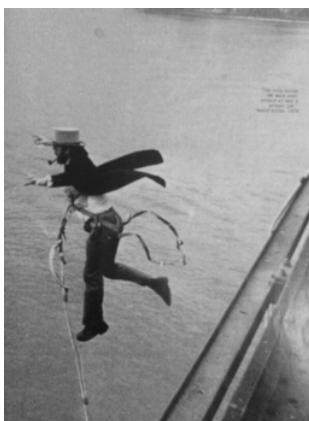
Figura 7. Anónimo (1979), la supuesta primera acción de puenting , realizada por David Kirke en el Clifton Suspension Bridge de Bristol. 36

Con el puenting se produce una pérdida de rigor y heroicidad en la estética de lo sublime y el abismo pasa de ser un espacio de ejecución de una cierta soberbia y grandeza del espíritu a convertirse en un pasatiempo de la razón sin mayor trascendencia. Nos adentramos, con ello, en la desquiciante polaridad del mundo contemporáneo: sociedades obsesionadas por la seguridad y control que, al mismo tiempo, desean seguir experimentando la sensación de peligro o riesgo, mas sin tener que asumir las consecuencias, convirtiéndose el mundo en un consuelo pop en el que la fatalidad pierde su destino. Se puede coquetear con el límite sin «jugarse el pellejo», pues toda experiencia es edulcorada, quedando convertida en simulacro. El puenting es la posibilidad de ensayar el suicidio, de fingir la tragedia de lo sublime y, en consecuencia, de trasladar esta categoría estética desde el espacio de lo heroico al de la farsa. Del abismo altilocuente al abismo descafeinado.