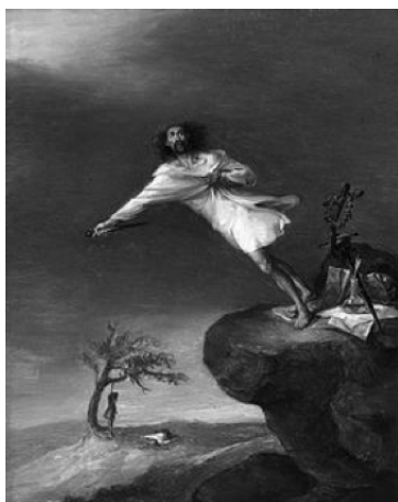
Figura 5. Leonardo Alenza (1839), El suicida o el romántico , Museo Nacional del Prado.

La técnica ha ampliado el abanico estético del abismamiento, desplazando ligeramente la experiencia de lo trágico al producir una ligera pero enfática avanzadilla que ha reestructurado la arquitectura de lo abismático. Se ha transitado de la experiencia limítrofe del abismo, aquella que se producía en la antesala de la caída –el romántico sumido en la contemplación al borde del quicio–, al disfrute del vértigo sobre el abismo. Primero fue la posibilidad horizontal de cruzar el vacío, tal y como lo hallábamos en la metáfora nietzscheana del funambulista; posteriormente, con el puenting, se produce la experiencia vertical de una caída, en la cual se experimenta el vértigo del descenso anulando el irrefutable fondo.