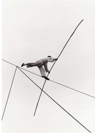
Figura 4. Geometría funámbula. Izis o Israëlís Bidermanas (1959), Lagny. 23

Nada, ni siquiera el oscuro fondo de la existencia, ha de ser tomado demasiado en serio. Todo ha de ponerse en juego . En la propuesta nietzscheana, rareza heterodoxa frente la tramposa «filosofía de catedráticos» o «filosofía de universidad» 24 , el sibarita existencial, es decir, aquel que realmente sabe disfrutar de la vida, no es el snob académico suspendido en la filigrana retórica y pedantería de un mundo de corte. Por el contrario, el hedonista es un artesano o geómetra del goce: aquel que sabe mantenerse en perfecto equilibrio en la tensión liminal de la cuerda floja, una horquilla que escinde placer y dolor, dos modos abismáticos para una misma elevación en la caída.