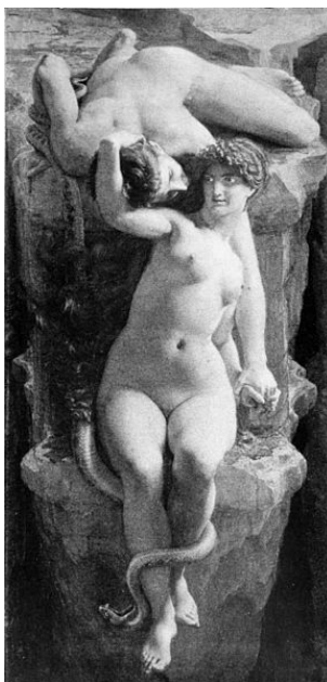
Figura 3. Jean-Baptiste Augustin Nemoz (1890), Au bord du gouffre , catálogo de exposición Beaux-Arts, Salón de 1890, París

Hay, por lo tanto, un fondo de horror y melancolía en la también esperanzadora y altiva experiencia de lo sublime: la insatisfacción de lo absoluto, que nos deja siempre, en vida, con la miel en los labios. A las puertas del infinito: desquiciados . Lo sublime se nos revela, usando el concepto que propone Esposito, como la conciencia de una inadecuación: un «quiero y no puedo», como una tentación que, si bien se nos aparece, no se debe ni se puede sucumbir a ella, pues conlleva el fin del sujeto: su consecuencia es la muerte. La experiencia del abismo en la estética moderna es la imagen de la desesperación, de una inclinación por el infinito que permanentemente se ve frustrada por la realidad, la cual nos obliga a retroceder y a retenernos, como Ulises en el encuentro con las sirenas, ante el límite, pues hay tentaciones cuyo placer no se puede disfrutar sin sucumbir a la catástrofe, tal y como muestra la pintura Au bord du gouffre de Jean-Baptiste Augustin Nemoz (1890). Hay abismos cuya hondura requiere de la profilaxis tántrica: la detención al borde de, junto a o antes de, para poner un obstáculo o traba milimétrica que frene la potencial y suicida entrega absoluta a lo insondable. Se trata de experimentar el éxtasis evitando la rendición incondicional. Cuando el placer es extremo y el ímpetu, galopante, se requiere rechazar el pleno arrojarse y mantener a mano una brida que permita disfrutar del vértigo sin quedar sometidos irremediablemente a lo insondable.