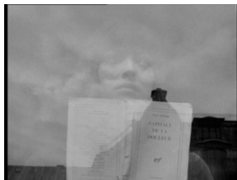
Fig. 12 y 13. 3. Fotogramas de Alphaville