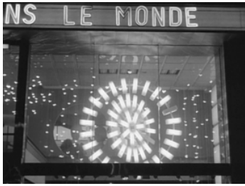
Fig. 6 y 7. 3. Fotogramas de Alphaville