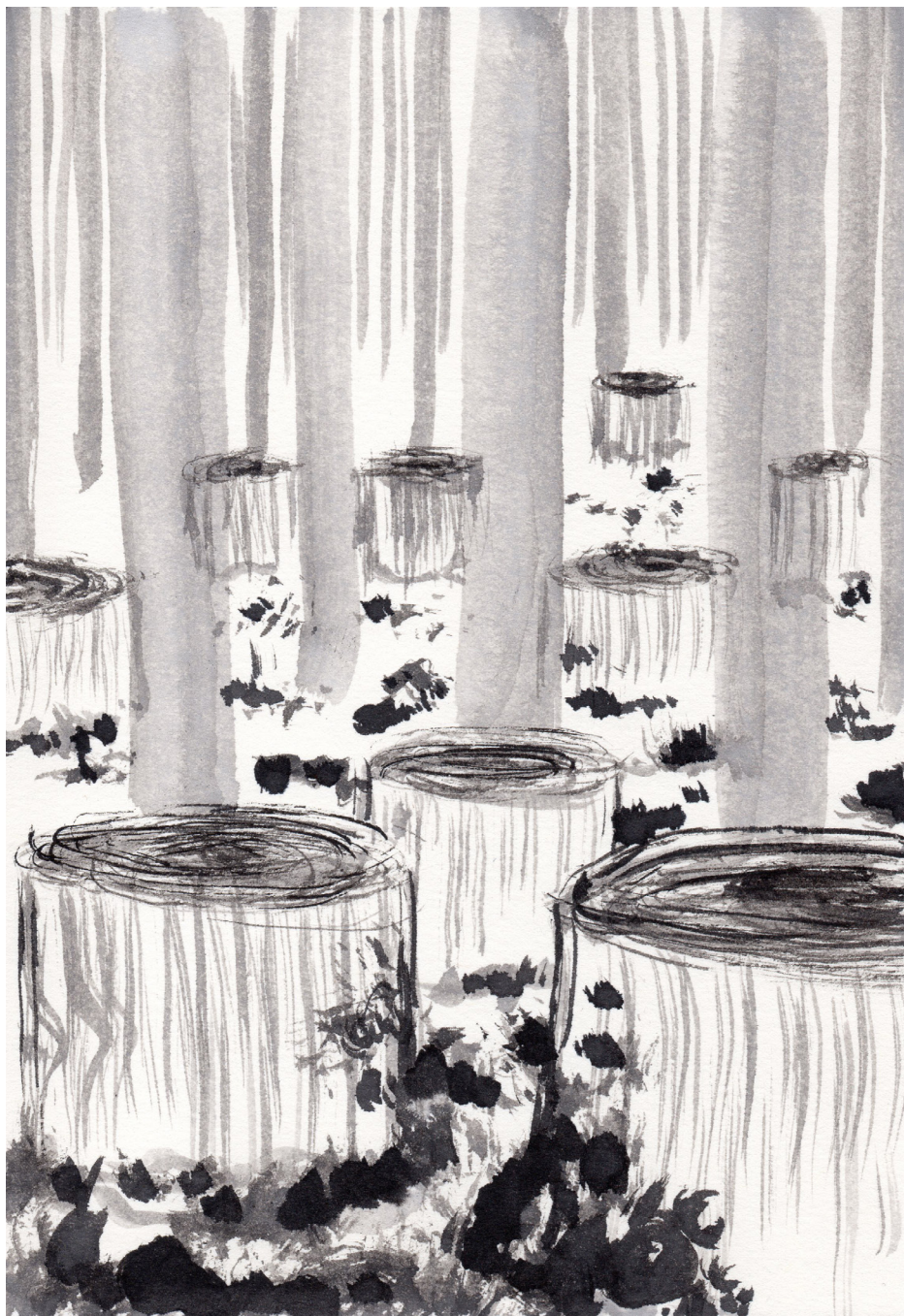
Sin Título 21 x 14,8 cm Tinta china sobre papel 2017