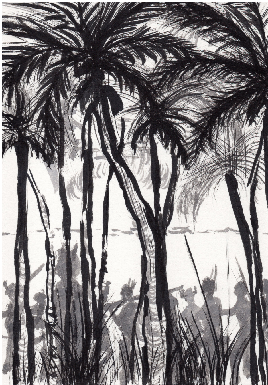
Sin Título 21 x 14,8 cm Tinta china sobre papel 2017