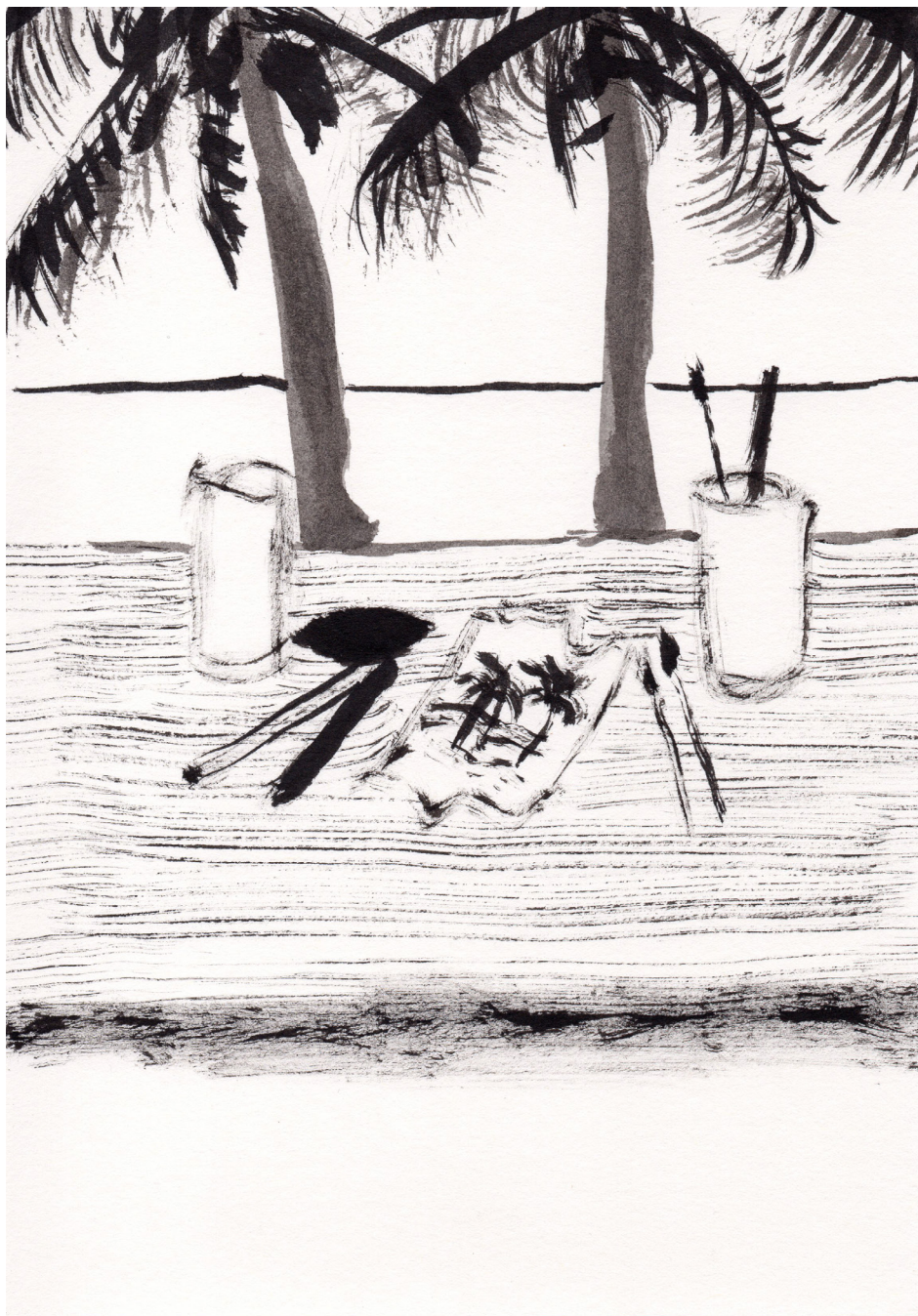
Sin Título 21 x 14,8 cm Tinta china sobre papel 2017