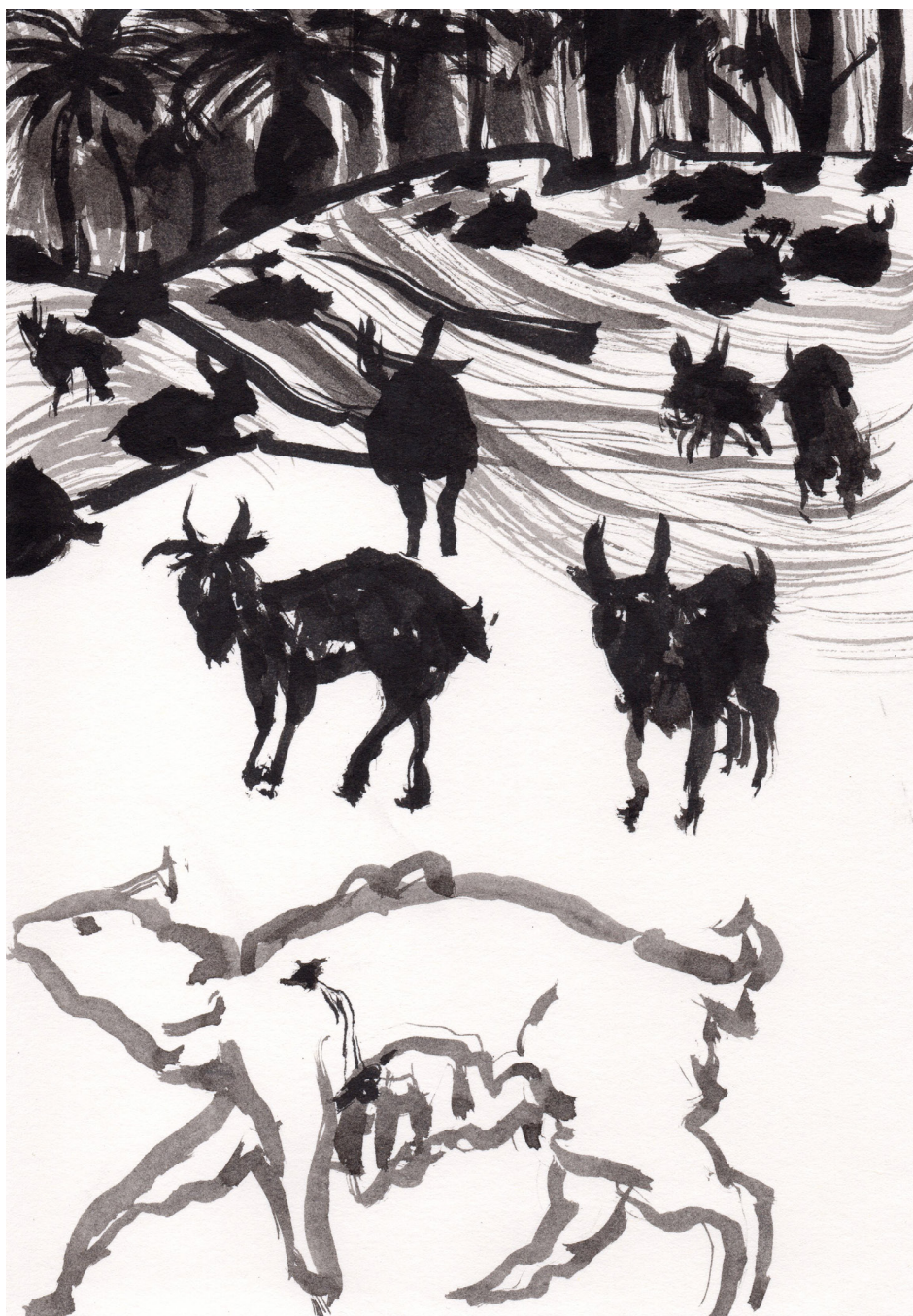
Sin Título 21 x 14,8 cm Tinta china sobre papel 2017