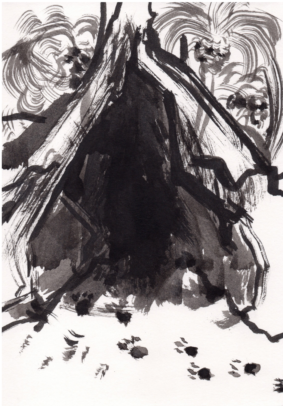
Sin Título 21 x 14,8 cm Tinta china sobre papel 2017