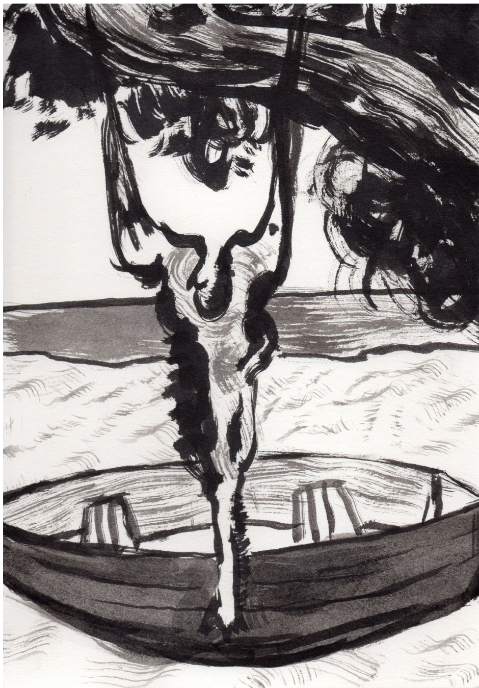
Sin Título 21 x 14,8 cm Tinta china sobre papel 2017