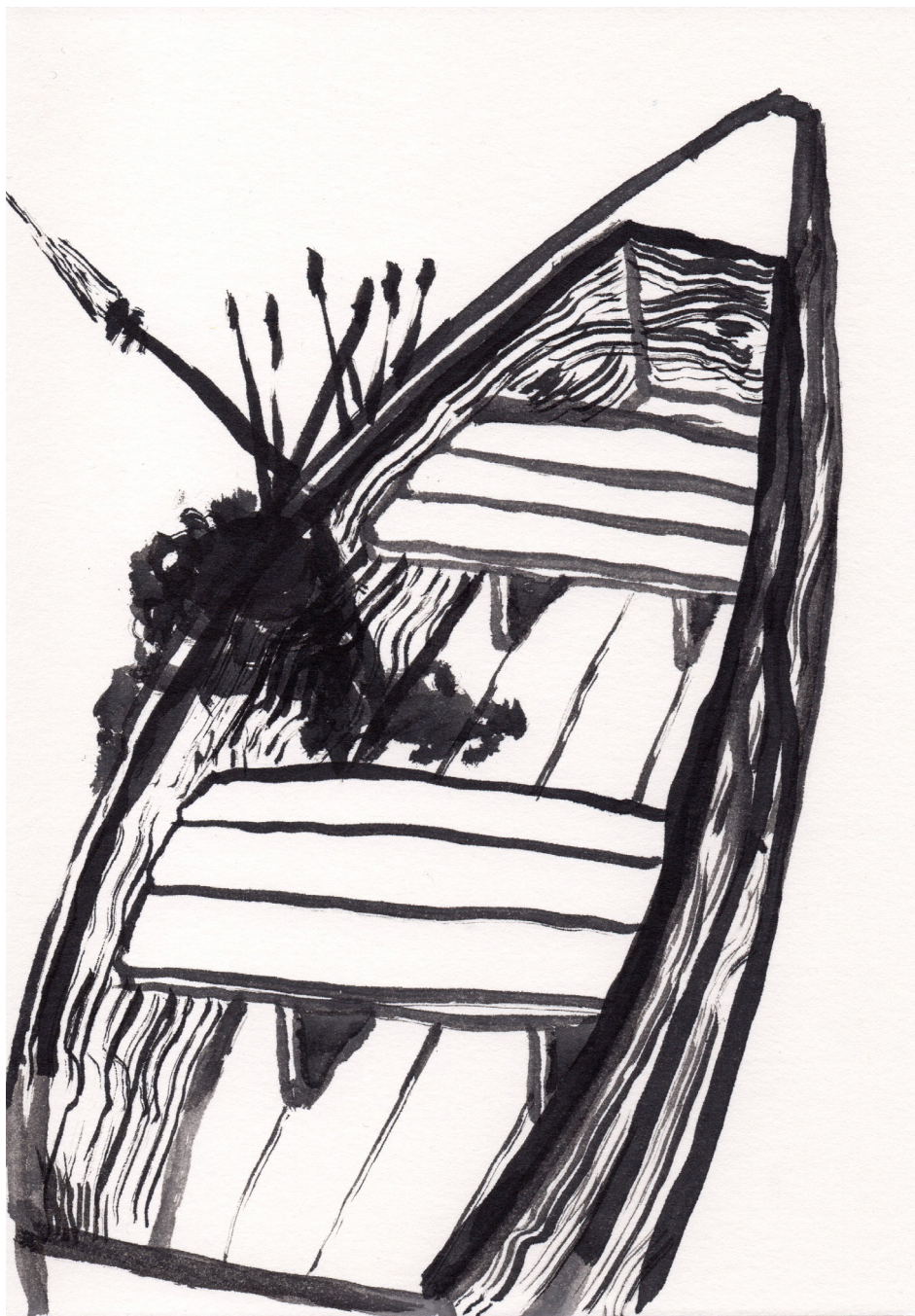
Sin Título 21 x 14,8 cm Tinta china sobre papel 2017