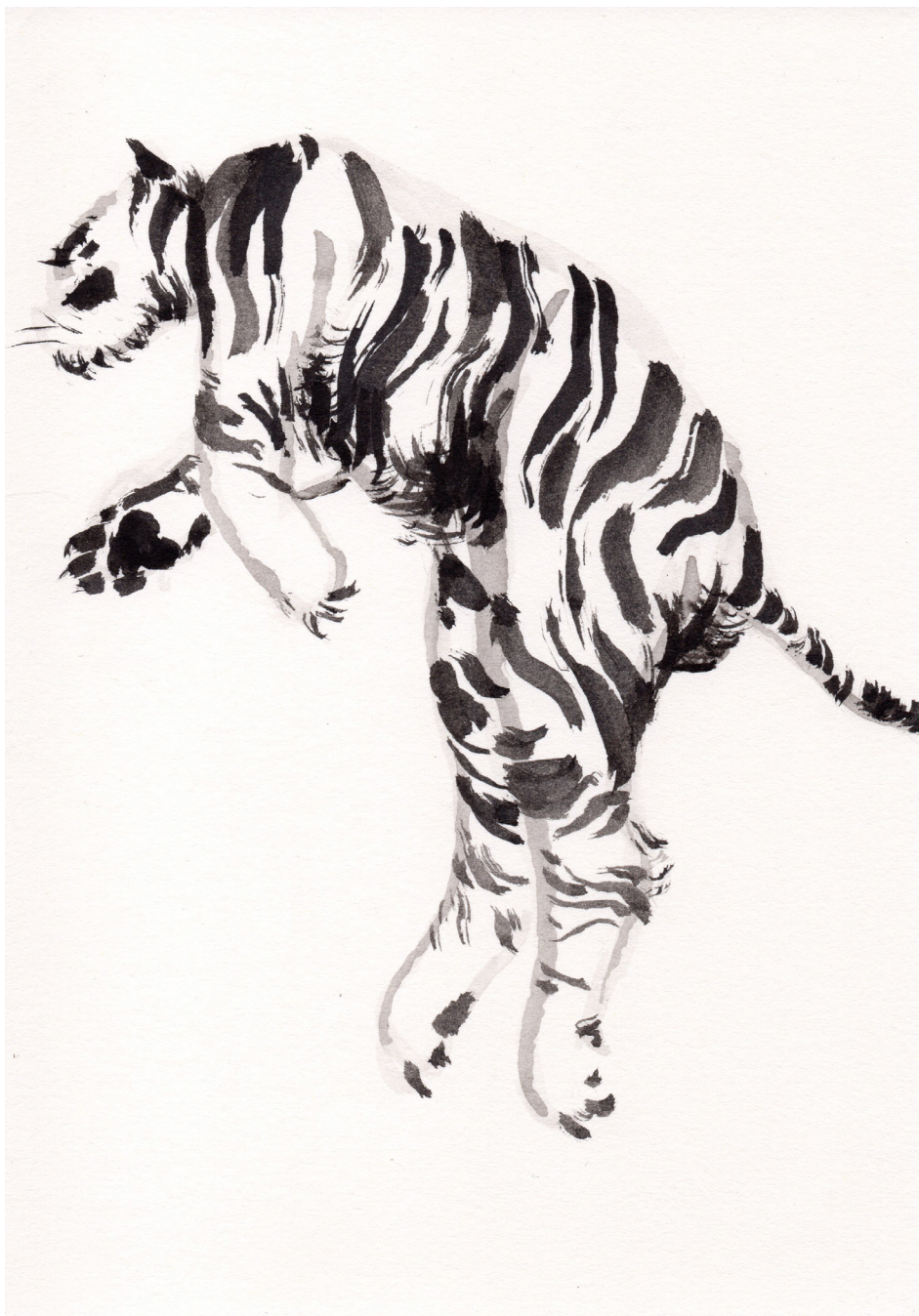
Sin Título 21 x 14,8 cm Tinta china sobre papel 2017