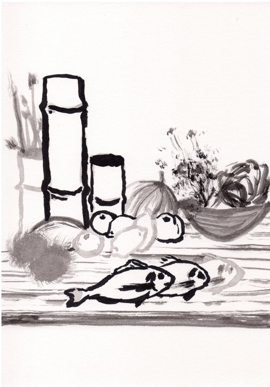
Sin Título 21 x 14,8 cm Tinta china sobre papel 2017