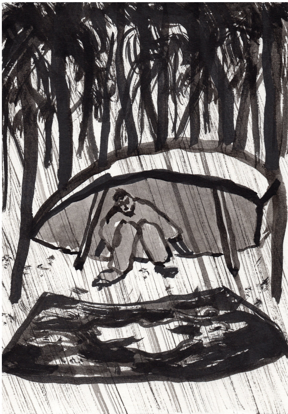
Sin Título 21 x 14,8 cm Tinta china sobre papel 2017