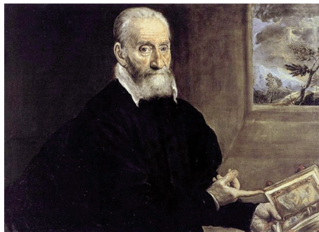
Figura 1. El Greco, Retrato de Clovio , c. 1571

tro recogido por Blumenberg— durante su estancia en el palacio Farnese, y en el que se nos hace partícipes de una de esas escenas tenebrosas a las que El Greco era inclinado tanto en su vida como en su obra: