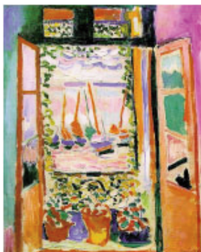
Figura 9. Henri Matisse, La ventana abierta, Collioure , 1905

la combinación de técnicas tanto impresionistas como postimpresionistas para el paisaje que se ve a través de la ventana, mientras que el interior de la habitación era realizado “a base de manchas toscamente aplicadas y zonas de tonos planos y bastante uniformes”. 56