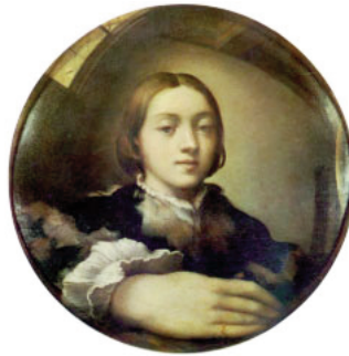
Figura 3. Parmigianino, Autorretrato ante un espejo convexo , 1524

Blumenberg se refiere al pintor italiano Girolamo Francesco Maria Mazzola [1503-1540], usualmente conocido como Parmigianino. 24 Antes de salir de Parma hacia Roma con el propósito de hacer fortuna en la gran ciudad imperial, el joven pintor consideró oportuno seleccionar cuatro de sus mejores pinturas a modo de tarjeta de visita. Éstas no sólo habían de mostrar fehacientemente lo elevado de su arte, sino que además debían transigir con el requisito práctico de ser fáciles de transportar. 25 Una de estas obras, según el testimonio de Giorgio Vasari, 26 un historiador del arte del siglo XVI, era precisamente el autorretrato al que alude Blumenberg, 27 y que mostramos a continuación: