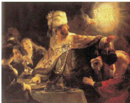
Figura 11. Rembrandt, El festín de Baltasar , 1635

En este cuadro se representa un pasaje bíblico del Antiguo Testamento, correspondiente a la profecía de Daniel: