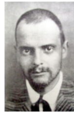
Figura 4. Paul Klee, Ensimismamiento , 1919 Figura 5. Fotografía de Paul Klee, 1912

Con esta inesperada apelación a la originariedad del ser, Blumenberg ofrecía una tentativa de solución provisional al problema de la mimesis y su puesta en suspenso a partir de la Modernidad. De esta forma sorprendente y un tanto abrupta Blumenberg cerraba su conferencia de 1956: