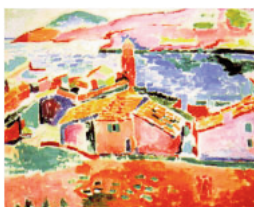
Figura 7. Henri Matisse, Vista de Collioure , 1905

El 28 de julio de ese mismo año, Derain enviaba una carta a su amigo Maurice Vlaminck, en la que enumeraba cuidadosamente todo lo que estaba aprendiendo de su admirado maestro Matisse. 49 De su enumeración, queremos destacar un punto que perfectamente podríamos asimilar también con la metaforología blumenberguiana: “es [...] un mundo que lleva el germen de su propia destrucción en cuanto se lleva al límite”. 50 Mostramos a continuación uno de los muchos cuadros que Matisse y Derain pintaron en Collioure: