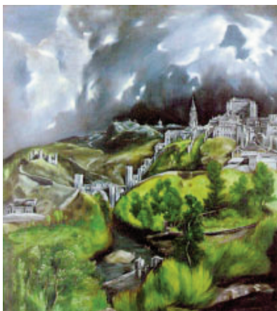
Figura 2. El Greco, Vista de Toledo , 1596-1600

retrato de Clovio, El Greco ponía rumbo a España con el objetivo último de trabajar al amparo de Felipe II, el mismo monarca que Clovio hubo de rechazar. Y ni siquiera allí las cosas fueron fáciles. Su cuadro El Martirio de San Mauricio , realizado para El Escorial, no fue del agrado del rey español, y El Greco quedó fuera del selecto círculo de artistas palaciegos. Tras su estrepitoso fracaso decidió instalarse definitivamente en Toledo, en donde no le faltaron los encargos. A esta etapa de su vida pertenece la Vista de Toledo , una pintura abiertamente “antimimética” que anticipaba en más de doscientos años las vanguardias artísticas de finales del siglo XIX y comienzos del XX, que constituyen –como trataremos de mostrar más adelante– algunos de los principales paradigmas pictóricos de la metaforología temprana de Blumenberg.