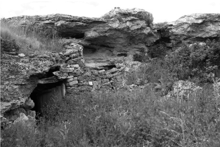
Cueva de «Las Calzadizas» (Paredes de Sigüenza). En la plataforma superior se han recogido materiales de época andalusí.