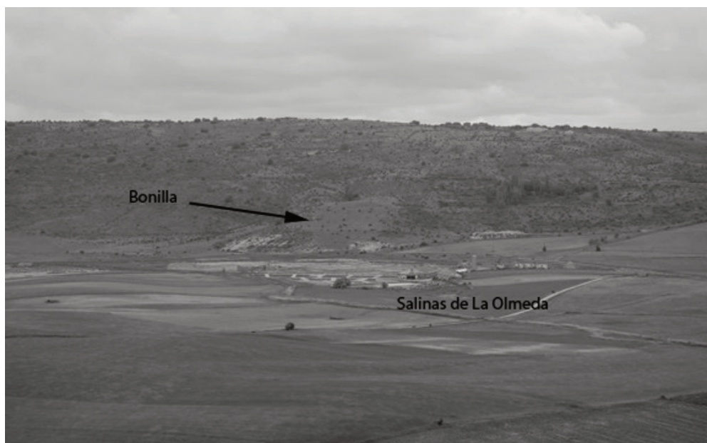
Yacimiento de Bonilla (La Olmeda de Jadraque) en relación con las salinas.