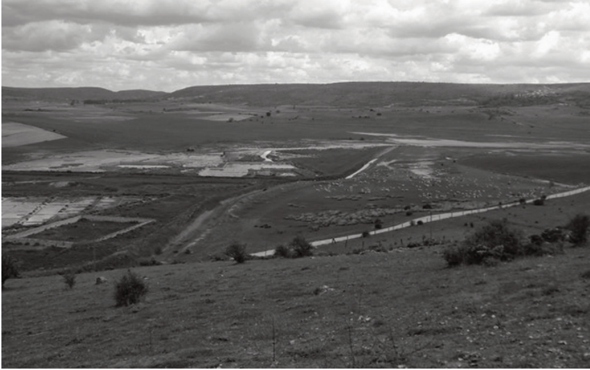
Panorámica del valle del Salado

La tercera y última cuestión se refiere a la necesidad de establecer un análisis minucioso de los espacios de hábitat, al mismo tiempo que un estudio de las mismas salinas, con el fin de verificar sus transformaciones a lo largo del tiempo. Son cuestiones a tratar en un futuro, como corresponde a una investigación que no hace sino empezar.