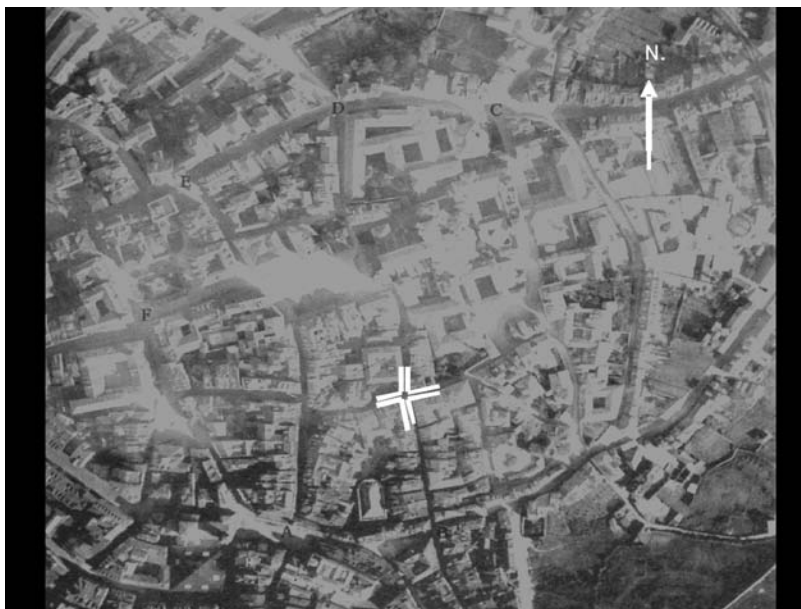
Imagen nº 1. Los Cuatro cantones , como se denominaba, en la Edad Media a la pequeña plaza que se formaba del cruce de las calles Ferrería (act. Mon)-Santa Ana con Canóniga-San Antonio.