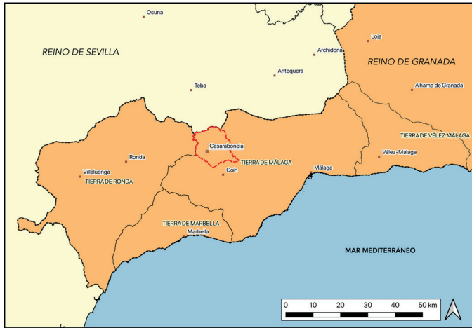
Mapa 1. Localización de Casarabonela (Elaboración propia sobre cartografía del IGN)

En 2002 Bernard Vincent escribía sobre la poca atención prestada a la ganadería en la historiografía sobre el SE peninsular, en especial la dedicada al antiguo reino de Granada, tanto en época medieval como moderna 4 . Desde entonces se han publicado algunos trabajos sobre el tema que han cubierto en parte el vacío señalado por el investigador francés. La actividad ganadera en el periodo nazarí ha sido estudiada por el equipo liderado por Malpica Cuello, con interesantes resultados 5 . Trillo San José, igualmente, ha trabajado sobre la ganadería en la fase de cambio del islam al cristianismo 6 . También hay que nombrar los trabajos de Cara Barrionuevo sobre la etapa medieval y la