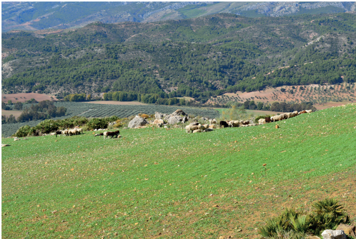
Foto 1. Ovejas en la antigua dehesa del río Turón.

Ambas funcionaron como “dehesas de pasto y labor” para el ganado vacuno de labor durante el periodo comentado 67 . En la dehesa del río Turón se cultivaban los cortijos mencionados; tras la cosecha estos terrenos quedaban, según las ordenanzas de Málaga, para el dicho ganado de labor de la villa. La mayor parte del espacio de esta dehesa permanecía inculto. En la dehesa de Martina la densidad de hazas de cultivo era mayor, conformando un paisaje más complejo, entremezclado de hazas de pan llevar con espacios de monte bajo y herrizas. Ambas dehesas estaban reservadas para los bueyes y vacas de arada de los vecinos de la villa, que contaba con un boyero concejil 68 .