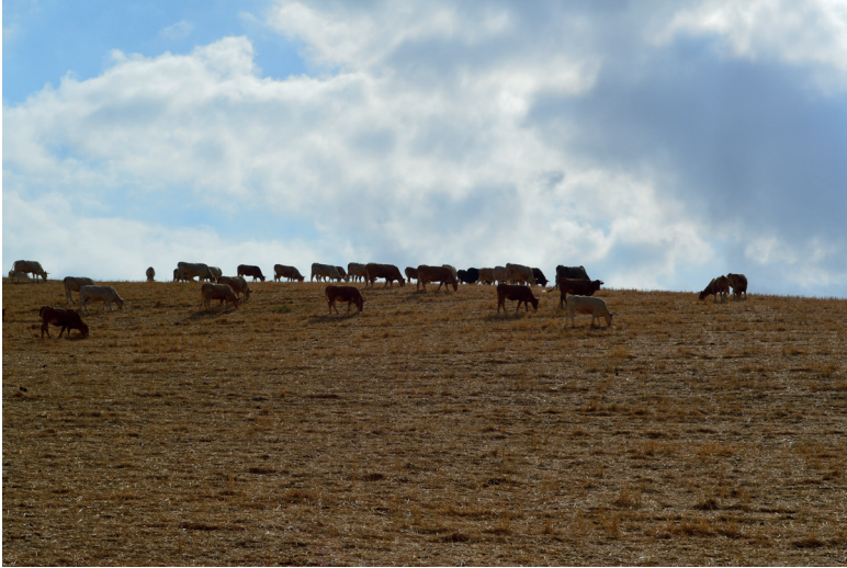
Foto 2. Vacas pastando rastrojos al sur de Casarabonela.

momento en el que el labrador ya habría recogido la cosecha y podría pagar la renta bien en trigo (en 10 de los 25 contratos analizados) bien en dinero 99 .