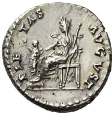
Figura 14. Reverso de un denario de Domiciano acuñado en Roma (82-83 d.C.). RIC 156, NAC 101, lote 238.

Los Ulpio-Aelios modificarán la iconografía de Pietas , que aparecerá habitualmente de pie o junto a un altar en actitud oferente (Fig. 15) – aunque en algunas ocasiones se la muestra también entronizada – con sus atributos habituales, como los niños o la cigüeña.