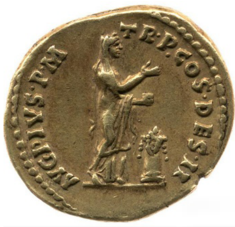
Figura 15. Reverso de un áureo de Antonino Pio acuñado en Roma (138 d.C.), RIC 13a, R.12457, British Museum, Fuente: www.sixbid.com

Los Ulpio-Aelios modificarán la iconografía de Pietas , que aparecerá habitualmente de pie o junto a un altar en actitud oferente (Fig. 15) – aunque en algunas ocasiones se la muestra también entronizada – con sus atributos habituales, como los niños o la cigüeña.