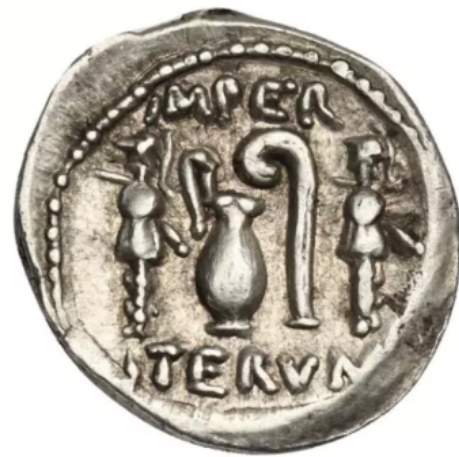
Figura 3. Reverso de un denario de Sila de ceca incierta (46 a.C.). RRC 467/1, CNG 460, lote 484.

La representación de elementos relacionados con el culto está presente en todas las autoridades emisoras estudiadas; sin embargo, es desde tiempos de Augusto cuando mayor variedad y cantidad de estas hemos encontrado. En el resto de las piezas de otros emperadores veremos los mismos modelos augusteos, pero también variaciones simplificadas de esta –en las que se muestran menos elementos, aunque los instrumentos sean los mismos– antorchas o estatuas de culto representando a alguna divinidad 7 .