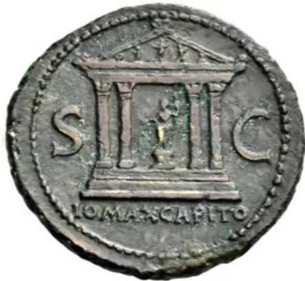
Figura 7. Reverso de un bronce de Vitelio acuñado en Roma (69 d.C.). RIC 127, NAC 114 parte I, lote 634.

Sin embargo, en la acuñación de Vitelio (Fig. 7), a pesar del detalle que muestra en algunos aspectos como las columnas, aparentemente de orden corintio, la clara apreciación del entablamento, los detalles decorativos del frontón y la presencia de las acróteras del mismo, se pueden reconocer importantes fallos de forma, como presentar un templo tetrástilo en lugar de hexástilo. Esta era una de las principales características de este templo junto con las tres cellae , elemento que apunta a sus orígenes etruscos, destinadas a contener cada una de las imágenes de las divinidades de la tríada capitolina: Júpiter, Juno y Minerva 30 . Además, la imposición de esta tríada en las provincias, donde se construía un templo semejante al de la urbs , llegó incluso a simbolizar el dominio político de Roma en esas zonas 31 .