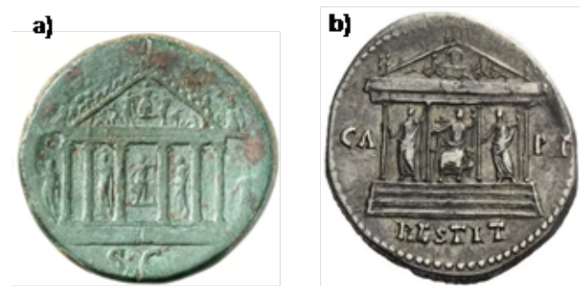
Figura 8. a) Reverso de un sestercio de Vespasiano acuñado en Roma (74 d.C.). RIC 714, Gorny & Mosch 237, lote 1852. b) Reverso de un cistóforo de Tito acuñado en Roma para su circulación en Asia (80-81 d.C.). NAC 94, lote 174.

prioritaria dentro de la línea programática de esta dinastía. En primer lugar, porque mientras estuviese en ruinas sería un recordatorio visual de los enfrentamientos civiles de los meses anteriores y pondría en duda la legitimidad de la nueva familia gobernante. En segundo lugar, porque su reconstrucción fue la primera gran obra acometida en Roma desde los tiempos de Nerón, lo que fue utilizado como un símbolo de vuelta a la normalidad y del final de las guerras civiles 32 . Estos intentos tuvieron oposición en el Senado, encarnada en la figura de Helvidio Prisco, aunque finalmente no llegaron a nada 33 . Su restauración también fue el primer gran escaparate propagandístico de la nueva dinastía gobernante, ya que fue financiado – al igual que otras obras públicas – con el fiscus iudaicus , impuesto que Vespasiano impuso a los judíos tras la primera de sus revueltas en Judea 34 .