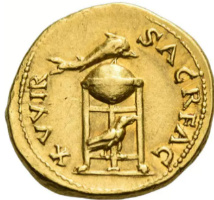
Figura 5. Reverso de un denario de Vitelio acuñado en Roma (69 d.C.). RIC 85, NAC 135, lote 277.

y se hiciese con la púrpura imperial. Sin embargo, uno de los primeros cargos que asumió fue el de pontífice máximo, así como la membresía a los colegios sacerdotales más importantes de Roma, que ya ostentaba desde época de los julio-claudios, tal y como nos cuenta Suetonio 15 . En este caso concreto, la leyenda de la pieza, XV·VIR·SACR·FAC , alude directamente a los Quindecimviri Sacris Faciundis , que se encargaban de guardar y proteger los Libros Sibilinos 16 . El delfín, por otro lado, tuvo en Roma la connotación de buen augurio: protector y guía, especialmente en el mundo marítimo, estuvo también en ese sentido vinculado al colegio de los quindecenviros como una advocación de Apolo delfinio 17 .