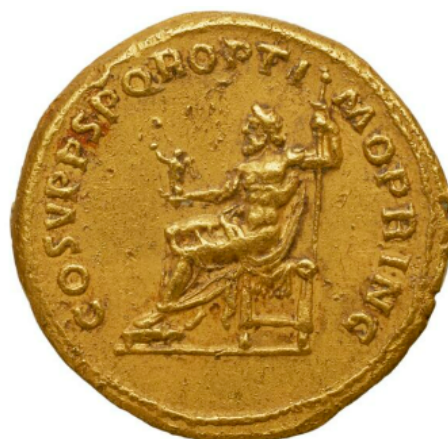
Figura 11. Reverso de un áureo de Trajano acuñado en Roma (103-111 d.C.). RIC 113, IMP-2956: Bibliothèque nationale de France.

Esta diferencia de significados en la lectura se ve en los atributos que portan las figuras y que se mantendrán a lo largo de la siguiente dinastía, la Ulpio-Aelia (Fig. 11), aunque será posible encontrar ambos tipos en sus emisiones monetales (pero rara vez con epítetos). En la primera, Júpiter lleva su tradicional fulmen , mientras que, en la segunda, al ser una representación victoriosa del dios, en la mano muestra una victoriola. Su aparición, además de estas connotaciones políticas, habla de una muestra de pietas de estos emperadores y de su respeto al mos maiorum y a las divinidades tradicionales entre las que también encontraríamos, por ejemplo, a Vesta.