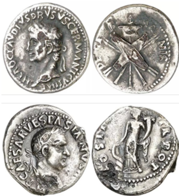
Figura 16. Arriba, denario forrado de Claudio acuñado en Roma (41-42 d.C.), RIC 74, Áureo & Calicó 352, lote 2084. Debajo, denario forrado de Vespasiano acuñado posiblemente en Hispania (70 d.C.), RIC desconocido, Áureo & Calicó 348, lote 1119.

A pesar de la legislación al respecto y la protección del Estado, la moneda fue objeto de sacrilegio en tanto que fue falsificada (especialmente las piezas de oro y, mayormente, las de plata) y puesta en circulación, llegando algunos de estos falsos de época hasta nuestros días (Fig. 16). Esta falsificación es bastante evidente en los ejemplares propuestos, donde la caída de pequeñas lascas de la fina plata que recubría las piezas ha dejado al descubierto el alma de bronce de estas acuñaciones.