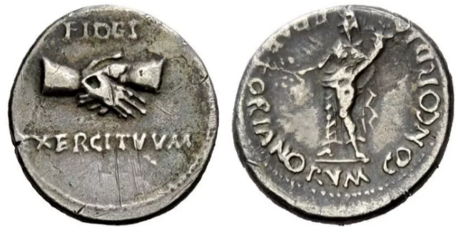
Figura 1. Denario de las guerras civiles (68 d.C.). Anv.: Manos entrelazadas Rev.: Diosa Concordia con rama y cornucopia. RIC 118, Numismatica Ars Clasica subasta 92 parte 2, lote 2103.

La iconografía religiosa en la moneda romana no solo tenía un propósito religioso, sino también político, y esto ha sido ampliamente argumentado desde distintos puntos de vista en múltiples estudios en torno al tema 2 . Por ejemplo, durante las guerras civiles que siguieron a la muerte de Nerón, vemos en acuñaciones de series anónimas 3 , imágenes que acentúan los mensajes de unidad y de reconciliación especialmente dirigidos al ejército (Fig.1). Por ello, encontramos en estas piezas representaciones de Fides , Concordia o de caduceos como símbolos de la paz 4 .