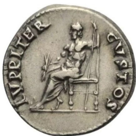
Figura 9. Reverso de un denario de Nerón acuñado en Roma (64-65 d.C.). RIC 53, Solidus Numismatik, lote 206.

Su iconografía es la misma que podemos ver en esculturas de la época y que le muestran como un hombre grande y barbado, sentado o entronizado, que puede ir completamente desnudo o medio cubierto con un manto. Sus atributos son el haz de rayos – también conocido como fulmen – y el cetro – o sceptrum – que simbolizaba su poder y fue adoptado por los romanos con el mismo significado. En algunas ocasiones se le puede ver también portando una victoriola o el águila que le representa. Esta imagen es la que se termina de desarrollar en el siglo V a.C. y se mantiene hasta época helenística 37 .