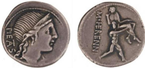
Figura 12. Denario acuñado en Roma con la representación de Pietas y del mito de los hermanos cataneos (108-107 a.C.), RRC 308/1a, 1944.100.644, American Numismatic Society