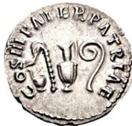
Figura 4. Reverso de un denario de Nerva acuñado en Roma (97 d.C.). RIC 41, CNG Tritón IX, lote 1439.

La imagen del reverso en el denario de César (Fig. 3) muestra cuatro elementos religiosos identificados con el culto público romano y los principales colegios sacerdotales. De izquierda a derecha, estos instrumentos son un símpulo, un hisopo, una capis o praefericulum , aunque algunos investigadores también se refieren a estos recipientes como urceus 8 , y, por último, un lituo. Todos ellos elementos que dan a conocer el propio sentimiento religioso y moral que tanto César como posteriormente Augusto buscaron transmitir a través de la restauración del mos maiorum y el respeto a la pietas . Tanto esta iconografía como este mensaje fueron repetidos en emisiones posteriores, como en algunas de época flavia o de Nerva (Fig. 4) 9 .