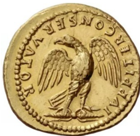
Figura 6. Reverso de un áureo de Domiciano acuñado en Roma (82-83 d.C.). RIC 85, NAC 100 parte I, lote 462.

Estas apariciones pueden darse de forma individual – es decir, mostrando solo el águila – o de manera conjunta con algún otro elemento u atributo como haces de rayos (Fig. 6) – ampliamente vinculados a la tradición literaria y la mitología 23 –, estandartes militares o laureas, por poner algunos ejemplos. Los rayos podían iluminar el camino de los ejércitos romanos, pero también podían golpear a sus enemigos, por lo que tenían un papel apotropaico, si tenemos en cuenta que estos rayos estaban presentes en los escudos romanos.