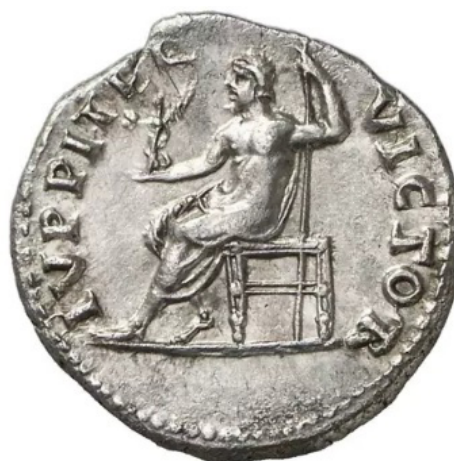
Figura 10. Reverso de un denario de Vitelio acuñado en Roma (69 d.C.). RIC 75, Gorny & Mosch, lote 418.

Júpiter-Zeus sigue el arquetipo de dios-rey celeste de origen indoeuropeo, divinidad de la lluvia, el rayo y el trueno, lo que lo convierte en el elemento masculino que aporta la fecundidad a la tierra y, por tanto, en un padre o cabeza de familia celestial 38 . Hasta época de Claudio, la efigie más habitual de Júpiter irá vinculada a la imagen de culto del mismo dentro de su propio templo. Sin embargo, con Nerón encontraremos por primera vez la representación de raíces helenísticas que le representan entronizado (Fig. 9) y que tan habitual era en las regiones de Oriente, especialmente en acuñaciones argéneas como los tetradracmas alejandrinos. Esta imagen será la que se mantenga desde este momento, configurándose así la representación más habitual de Júpiter en la moneda romana. En este caso, el epíteto custos , el que guarda, puede hacer referencia a la protección de la divinidad sobre la ciudad después del devastador incendio del año 64 d.C., ya que nos encontramos ante una emisión muy localizada en el tiempo entre este año y el 65 d.C.