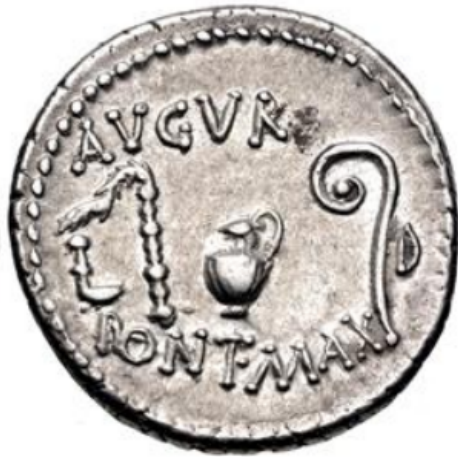
Figura 2. Reverso de un denario de Sila de ceca incierta (84-83 a.C.). RRC 359/2, Bertolami 92, lote 833.

a los distintos sacerdocios, vemos que la asimilación hacia la autoridad emisora de las piezas numismáticas que los representan es cada vez más evidente, como podemos encontrar en los ejemplos a continuación. Al igual que sucede con la representación de templos, como también veremos, las acuñaciones de elementos rituales o relacionados con el culto eran muy escasas en la moneda griega –más centrada en la iconografía alusiva a la divinidad–, pero muy habituales en las piezas romanas.