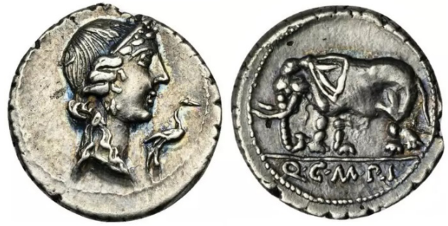
Figura 13. Denario de Quinto Cecilio Metelo Pio acuñado en una ceca italiana (81 a.C.), RRC 374/1. Bertolami Fine Arts 109, lote 390.

En el reverso aparece ilustrada la representación de un mito, el de los hermanos cataneos. Lo relevante en este caso concreto, es que el anverso y el reverso mantienen una íntima relación, puesto que, en palabras de Crawford “el tipo fue indudablemente elegido no por sus vinculaciones con Sicilia, sino porque la historia de los hermanos cataneos aporta un ejemplo bien conocido de la pietas en acción” 41 . Tras esta primera aparición, es necesario esperar hasta el año 81 a. C. para volver a encontrar una personificación de una de estas virtudes en un denario, que será otra vez la de Pietas . En este caso (Fig. 13), aparece en el anverso, acompañada de una cigüeña, de un denario de Quinto Cecilio Metelo como alusión a su cognomen “Pio”. Esto muestra de forma clara la evolución que vivió la moneda en la moneda en época republicana y tardorrepblicana, haciéndose cada vez más personal y personalista. En el reverso, por otra parte, vemos un elefante en referencia a los triunfos de su antepasado Lucio Cecilio Metelo en la Primera Guerra Púnica en las tierras de Panormus .