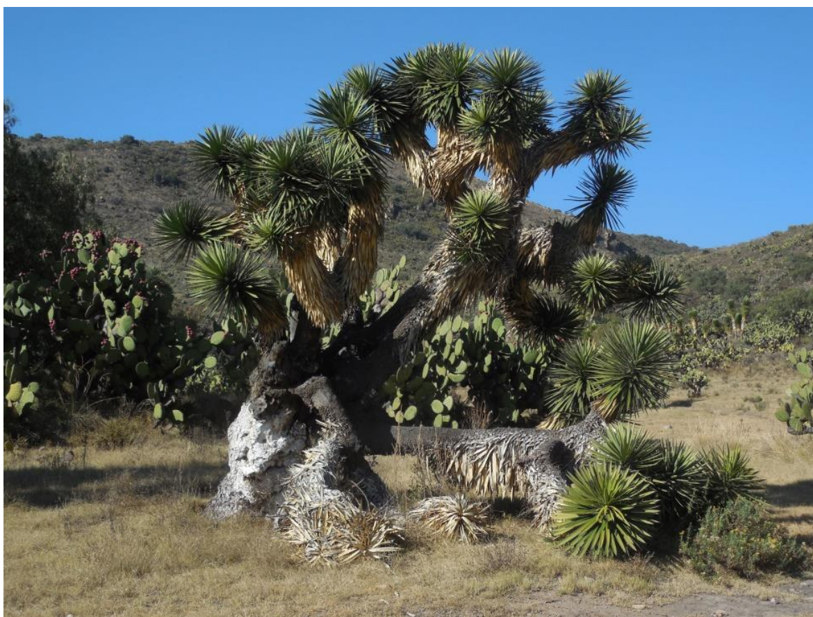
Fig. 13. Palma Nolina, árbol típico de la región de Tepeapulco y que aparece representado en la escena de la estigmatización de San Francisco.

La palma nolina que se muestra en el relieve pertenece al género americano que se distribuye desde el sureste de Estados Unidos hasta el sureste de México 115 .