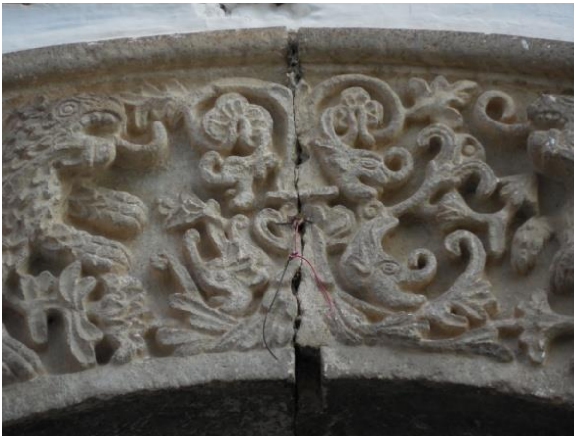
Fig. 11. Representaciones de delfines en el arco de medio punto de la portada.

del planeta. Aunque viven en mar abierto también se acercan a la playa, pero sin llegar a la orilla. Su nado puede alcanzar una velocidad de 45 Km./hora 94 .