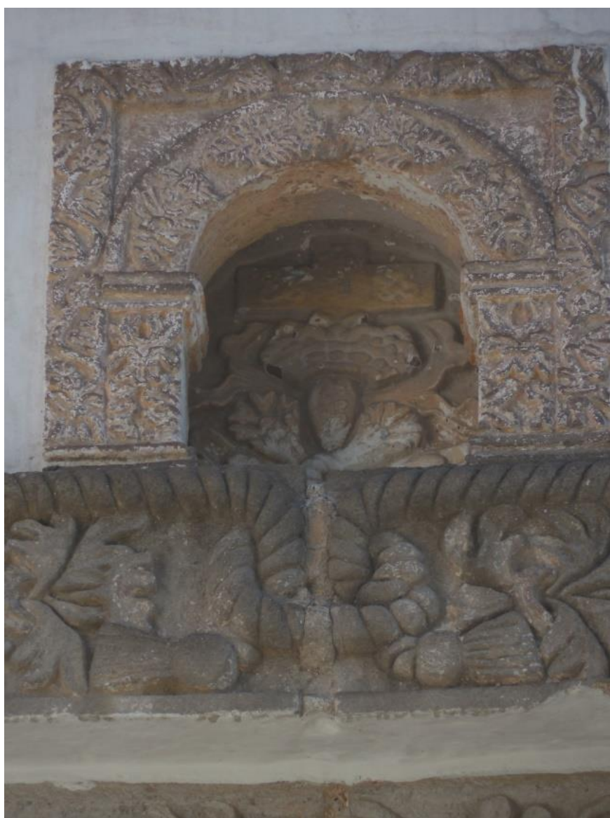
Fig. 14. Nicho donde se ubica la representación del corazón en llamas con la cruz y la vegetación que alude al escudo franciscano.

En el interior del pequeño nicho que se ubica sobre el alfiz de la portada se encuentra la escultura de un corazón en llamas delante de una cruz, de ambos lados del corazón salen lo que parecen ser hojas de plantas que se bifurcan, por debajo del corazón se pueden apreciar dos flores cuyos tallos se cruzan. Al parecer este conjunto es una interpretación del escudo franciscano y el corazón irradiante y en llamas de Jesucristo. Las hojas son en realidad los rayos de luz que emite el corazón y los tallos que se cruzan son representaciones de los brazos de Cristo y San Francisco que simbolizan la paz y el bien.