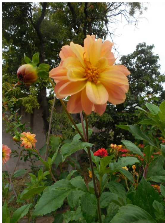
Fig. 4. Detalle del fuste de la columna decorada con flores de dalia.