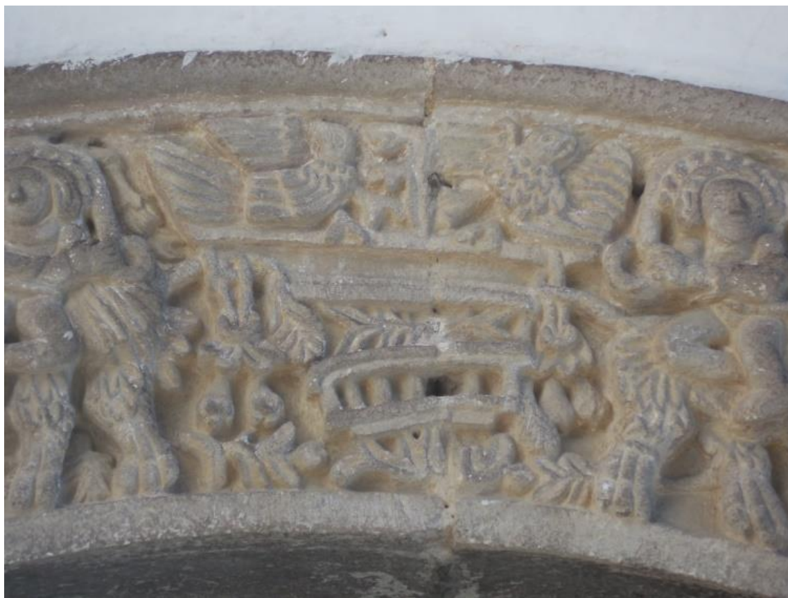
Fig. 9. Representaciones de águilas en el arco de medio punto de la portada.

El Águila Real es una de las grandes águilas con amplia distribución en Norte América y Eurasia. Se distingue por su pico robusto y ganchudo y por tener plumas en las patas hasta la mitad del tarso. Los adultos son café oscuro con vientre un poco claro en la base. La parte posterior del cuello tiene un tono dorado con matices rojizos. Los individuos jóvenes tienen el dorso de color café negruzco y vientre más claro. Su cola es blanca con una banda ancha oscura terminal 64 .