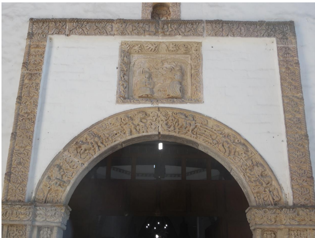
Figura 8. Alfiz decorado con racimos vegetales y enmarcado por el Cordón Franciscano.

aparecen de más arriba, o incluso desde el suelo 58 . Enmarca uno o más arcos dando lugar a las enjutas o albanegas 59 . De origen etrusco, lo usaron también los romanos, de quienes pasó al arte visigodo. Está muy presente en el arte islámico y en el estilo mudéjar 60 .