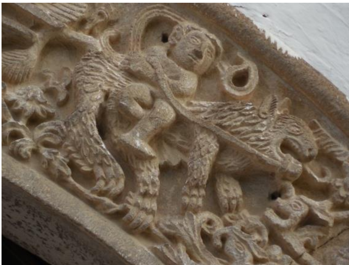
Fig. 10. Representaciones de hombres montando felinos en el arco de medio punto de la portada.

Decorando el arco del vano de ingreso al templo, se ubican intercalados entre águilas y delfines, seis representaciones de hombres jóvenes látigo en mano, cabalgando sobre jaguares y conduciéndolos con sus respectivas riendas. Los felinos se encuentran en posición rampante con la boca abierta enseñando los colmillos y una larga lengua, el cuerpo está cubierto por lo que parecen ser plumas o escamas.