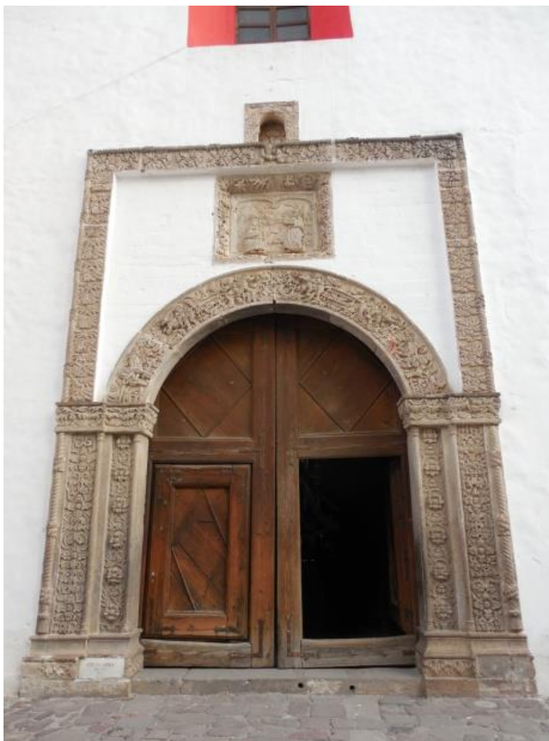
Fig. 2. Portada del templo de San Francisco de Asís de Tepeapulco.

El templo presenta en su fachada una bella portada de estilo plateresco donde se hace evidente la mano de obra nativa. Está conformada por columnas y pilastras adosadas al muro, separadas por delgados baquetones góticos y decoradas con motivos vegetales, las primeras con flores de dalia y las segundas con flores de