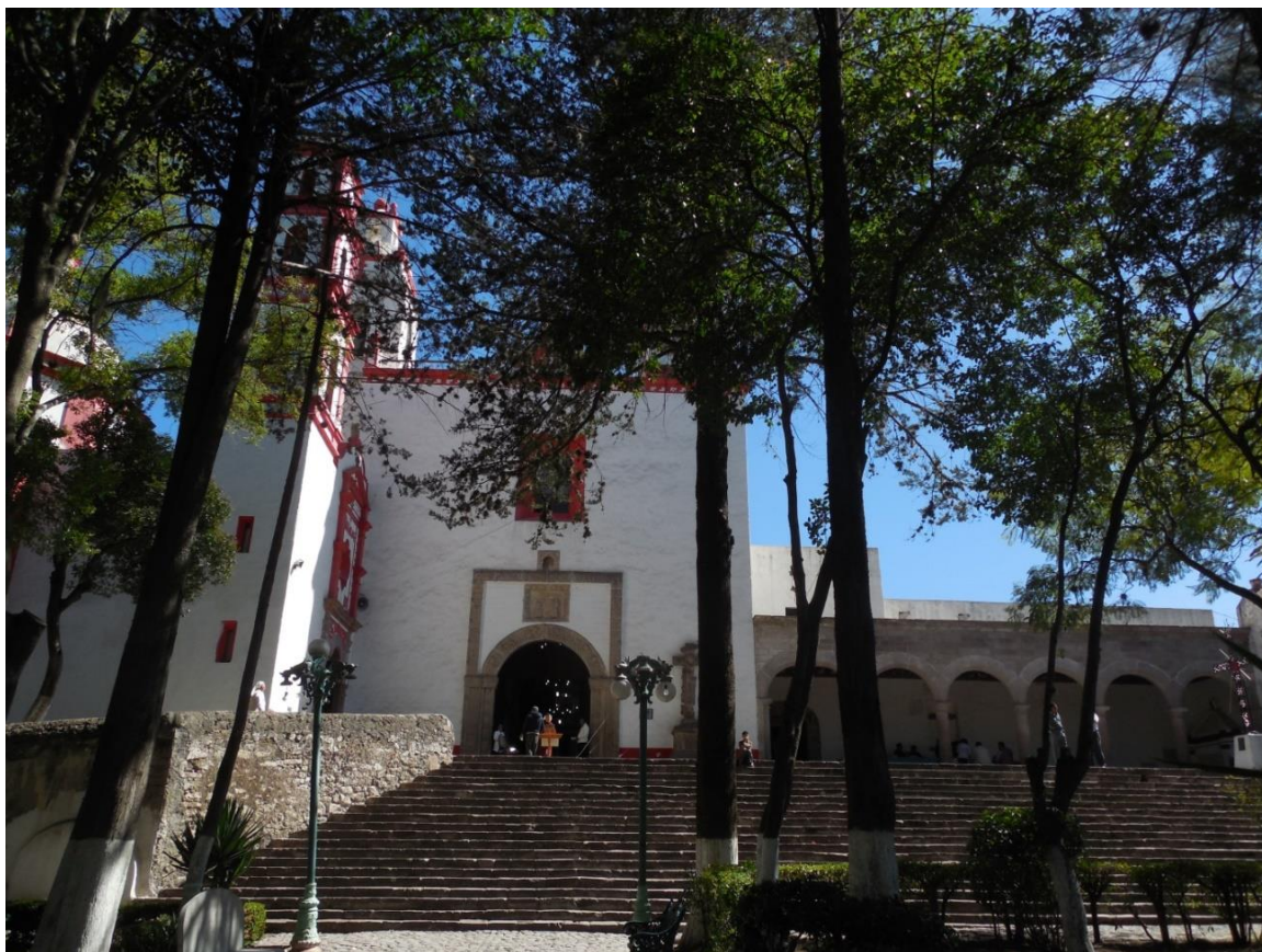
Fig. 1. Conjunto conventual de San Francisco de Asís de Tepeapulco.

la época en una especie de síntesis que habla del martirio de Cristo, con el INRI en el cruce de los ejes, tres clavos, un martillo, un mazo y las pinzas relacionadas con aquéllos; la escalera del descenso de la cruz, la lanza de Longino, el cáliz, las heridas sangrantes, la calavera y los huesos de Adán 21 .