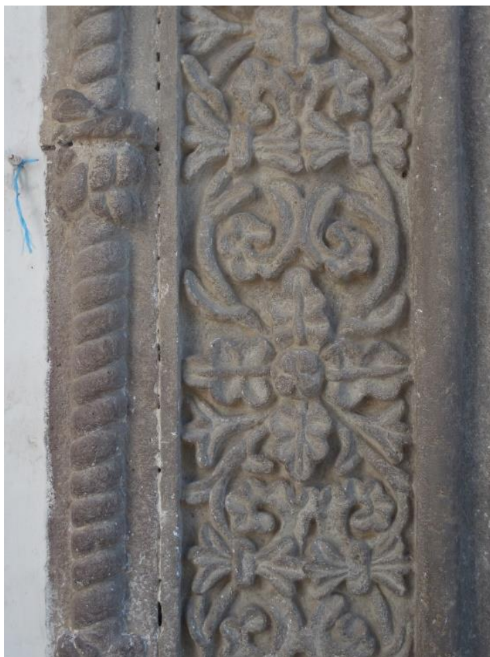
Fig. 3. Detalle del fuste de la pilastra decorada con flores de cuatro pétalos.

El cristianismo asocia las flores al símbolo de la perfección y muchas veces, surge en los pasajes bíblicos representando al paraíso celestial 32 y los dones a los que accederán los cristianos. A su vez el Cuatro es el número de elementos (tierra, aire, fuego, agua), de las estaciones, de los ríos del paraíso que riegan las cuatro partes de la tierra, las cuatro letras que componen el nombre de Adán, el hombre por excelencia, de los puntos cardinales. Cuatro es incluso el número de los Evangelistas, de los grandes Profetas, de los principales Padres de la Iglesia y de las Virtudes Cardinales 33 .