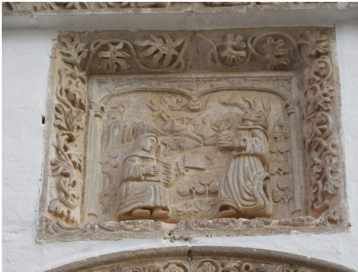
Fig. 12. Escena de la estigmatización de San Francisco enmarcada por hojas de encina.

Dentro del alfiz y sobre el arco de medio punto se ubica un cuadro esculpido en piedra que retrata el momento en el que San Francisco en la madrugada del 14 de septiembre del año 1224, en el monte de La Verna (Alvernia), valle del Casentino en el norte de Italia, recibe los estigmas de Jesucristo 104 .