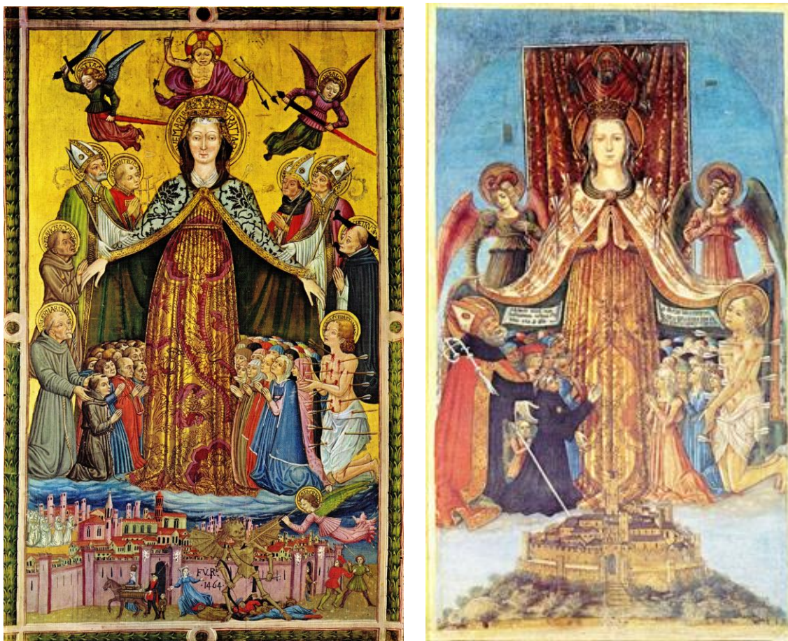
Fig. 11. Benedetto Bonfigli, Madonna della peste (1464). Perugia, San Francesco al Prato, cappella Oddi. Fig. 12. Benedetto Bonfigli, Madonna della peste (1472). Corciano, chiesa parrocchiale.

Il medesimo ruolo di intercessione per la sorte della comunità urbana affidato alla Madonna della Misericordia è riproposto negli stendardi contra pestem di Corciano, del 1472 (Fig. 12) 31 , e in quello di Montone, di un decennio successivo 32 , mentre nel gonfalone dipinto per la confraternita dei Disciplinati di San Benedetto “dei Frustati” (1471-1472) il motivo della Madonna delle frecce cede il passo ad una singolare rivisitazione dell'iconografia bizantina della Dēesis , che in questo caso contempla la Vergine, i santi benedettini ed il protettore locale ad interpersi per placare il Cristo giudice, che si accinge a castigare con le frecce la popolazione della città (Fig. 13) 33 .