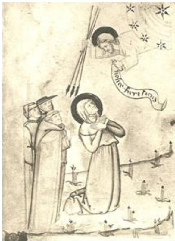
Fig. 8. Anonimo miniatore francese trecentesco, Maria Mediatrix (1324). Dallo Speculum Humanae Salvationis . Parigi, Bibliothèque Nationale (Ms. lat. 9584, fol. 16 v.).

consegue un'originale variante figurativa dell'iconografia tradizionale, che può essere desunta in nuce anche dalle pagine dello Speculum : l'immagine della Maria Mediatrix (Fig. 8) offre la singolare rappresentazione di un Cristo minaccioso, emergente a mezzo busto da una stellata sfera celeste, che si accinge a scagliare tre lance contro l'umanità peccatrice, simbolicamente rappresentata da un chierico, un laico ed un alto prelato, che supplicano pietà per la propria sorte dietro la figura della Vergine, inginocchiata a implorare il perdono divino per i peccati umani. Il titolo di Maria Mediatrix apposto alla miniatura rivela il significato dottrinale di mediazione in favore del genere umano attribuito al gesto mariano 19 .