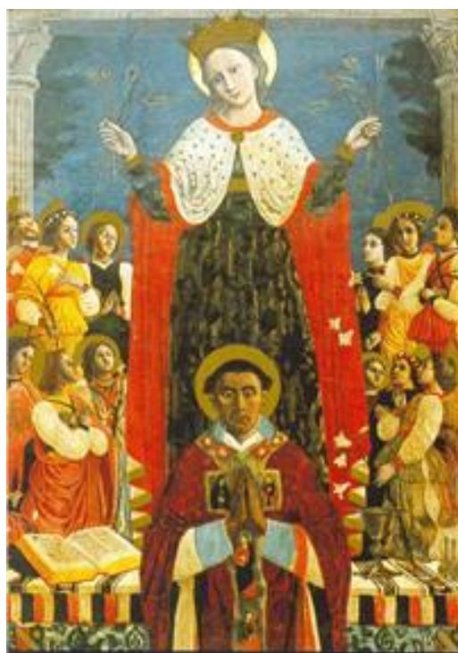
Fig. 14. Anonimo pittore tardo-gotico, Beata Vergine delle Grazie (1412). Faenza, cattedrale.