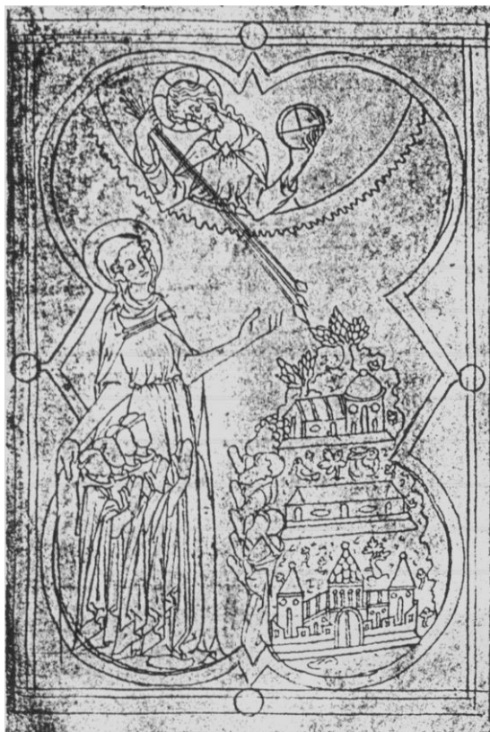
Fig. 9. Miniatore inglese del XIV secolo, Madonna della Misericordia (prima metà XIV secolo). Londra, British Library, Harley, ms. 2356, fol. 7.

Nel tempo si consolida una rassicurante fiducia nella funzione protettiva svolta dalla Madonna della Misericordia contro l'irrompere del castigo divino: in virtù della sua vicinanza al Figlio, il culto della Mater Misericordiae è privilegiato rispetto alla devozione per i tradizionali santi tutelari, quali Cristoforo, Antonio o Sebastiano, in quanto più efficace al fine di scongiurare il mortale pericolo del morbo. Visibile conferma della tutela spirituale offerta dal mantello di Maria contro l'avventarsi della punizione celeste è fornita da una miniatura trecentesca estratta da un salterio inglese oggi alla British Library (Fig. 9) 25 : l'intercessione della Madonna è qui espressa mediante la rappresentazione dell'imponente immagine della Vergine che accoglie sotto l'ala destra del mantello quattro monaci oranti, mentre la mano sinistra è aperta al cielo in segno di implorazione di misericordia rivolta al Figlio, pronto a scagliare tre lunghe frecce sulla città, allusiva al mondo degli uomini, come sembrano indicare alcuni supplici in preghiera che invocano l'intervento della Madre di Dio. Nella rinnovata contaminazione tra il desiderio di un riparo fisico e spirituale dall'epidemia e la funzione di tutela attribuita alla Vergine Protettrice trova fondamento lo sviluppo della nuova iconografia della Madonna delle frecce .