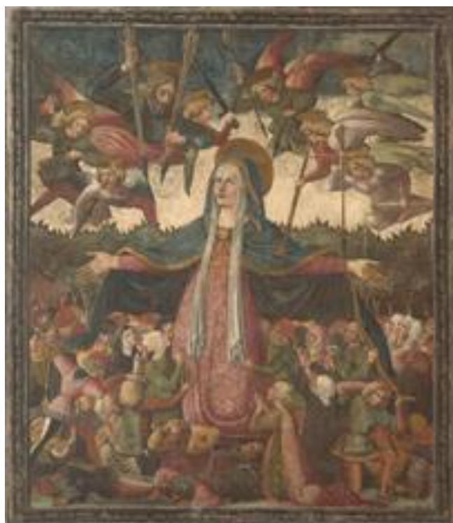
Fig. 16. Francesco di Bartolomeo Pelosio, Madonna della Pietà (1468). Imola, Pinacoteca Comunale.

Dall'esame delle due opere pittoriche, la prima proveniente dalla chiesa domenicana faentina di Sant'Andrea in Vineis , la seconda legata al culto domenicano locale, come riprova la raffigurazione del san Domenico orante in primo piano, appare evidente lo stretto rapporto costituitosi in Romagna tra la diffusione del culto della Madonna delle frecce e l'ordine dei Predicatori. L'identificazione delle frecce con i flagelli epidemici che di frequente colpivano le città della regione e il riscontro di tali caratteri iconografici all'interno della produzione artistica romagnola del XIV e del XV secolo, la cui committenza è associata all'ordine, consentono di stabilire una diretta relazione tra i frati mendicanti e la diffusione dell'iconografia della Madonna delle frecce in quest'area della penisola.