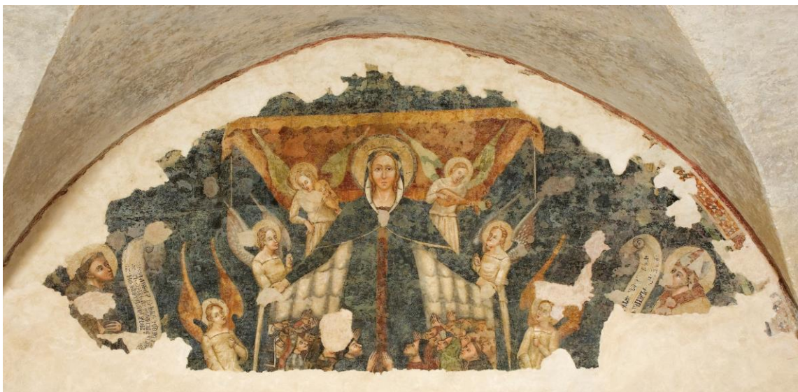
Fig. 5. Pittore marchigiano, Madonna della Misericordia, angeli musicanti e i santi Francesco e Biagio Imola, ex chiesa inferiore di San Francesco.

confraternite locali all'immagine della Madonna Protettrice è testimoniato principalmente dall'inatteso ritrovamento, insieme ad altri dipinti murali collocabili tra gli ultimi anni Settanta e tutti gli anni Ottanta del XIV secolo, di un affascinante brano pittorico raffigurante la Madonna della Misericordia tra angeli musicanti e i santi Francesco e Biagio nella riscoperta ex chiesa inferiore di San Francesco, che ha fornito nuovi e significativi indirizzi di ricerca per documentare la pittura locale in età tardo gotica ed una soluzione iconografica alquanto rara (Fig. 5) 13 .