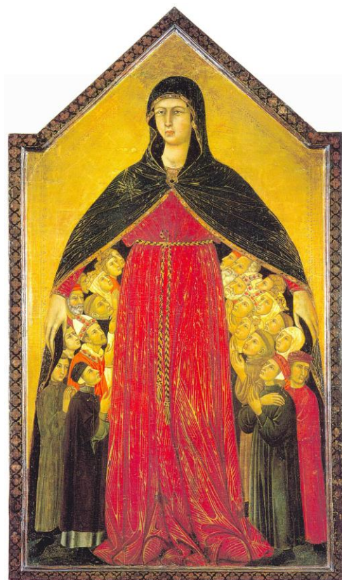
Fig. 3. Maestro del 1333, Madonna della Misericordia (1333), particolare. Parigi, Louvre. Fig. 4. Memmo di Filippuccio e Simone Martini (?), Madonna della Misericordia (1333). Siena, Pinacoteca Nazionale (in deposito).