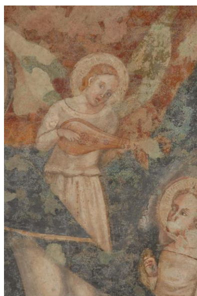
Fig. 7. Pittore marchigiano, Madonna della Misericordia (dettaglio di Fig. 6).

L'originalità dell'opera, che coniuga elementi d'iconografia tratti da differenti tradizioni pittoriche riunite grazie al fertile clima culturale assicurato dal patrocinio francescano del programma decorativo della chiesa, è garantita in maniera ancor più marcata dal complesso impianto strutturale della composizione, articolato intorno alla presenza del baldacchino mobile e alla disposizione "radiale" delle creature angeliche intorno al manto campaniforme di Maria. L'associazione figurativa alla Madonna della Misericordia dei quattro angeli cantori, che all'intonazione delle laudi sorreggono i bracci dell'elegante fastigio cortese, e del motivo degli angeli musicanti 14 , derivato dai Fioretti del santo d'Assisi, è assolutamente inconsueta per la pittura italiana, soprattutto a queste date. Il profondo sentimento devozionale delle confraternite laiche per l'immagine della Madonna Protettrice è rievocato dalla coppia di santi laterali, Francesco e Biagio, che reggono flessuosi cartigli con iscrizioni nelle quali è