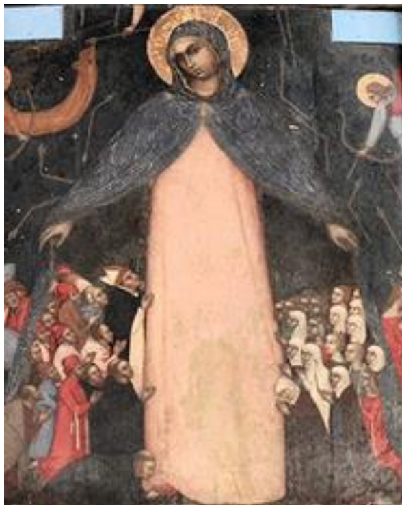
Fig. 10. Barnaba da Modena, Madonna delle frecce (1375-1376). Genova, chiesa di Santa Maria dei Servi.

I mutamenti iconografici cui è sottoposta l'immagine della Madonna della Misericordia in tempi di peste trova compiuta espressione nell'arte italiana in un'ancona dipinta dal pittore Barnaba da Modena per la chiesa dei Servi di Genova intorno all'ottavo decennio del Trecento (Fig. 10). Eseguita per una confraternita genovese, la tavola, mutila e deteriorata, può ragionevolmente essere considerata come il prototipo più antico nell'arte della penisola della nuova iconografia della Madonna della peste o delle frecce . La Madonna della Misericordia è raffigurata nell'atto di offrire protezione sotto il proprio mantello alla popolazione della città, esposta ad un'inarrestabile pioggia di frecce scagliate dagli angeli e dal Figlio, la cui immagine è perduta 26 . Nell'esercizio della giustizia celeste il Signore è assistito da una milizia di creature angeliche armate: l'immunità dagli strumenti della collera divina offerta dalla Madonna ai devoti è resa concreta mediante la raffigurazione dei dardi che si spezzano contro il mantello, mentre i supplici che ne sono rimasti fuori cadono trafitti dalle armi del castigo di Dio.