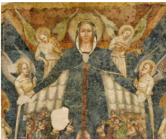
Fig. 6. Pittore marchigiano, Madonna della Misericordia, angeli musicanti e i santi Francesco e Biagio , Imola, ex chiesa inferiore di San Francesco.

potestà sovrana di Maria tra le gerarchie celesti, ragione della funzione tutelare accordatale dalla devozione fraterna, è espressa non soltanto attraverso la tradizionale monumentalità statuaria della Madonna, ma soprattutto dalla rappresentazione del capo coronato in veste di Regina Coeli , secondo l'iconografia della Vergine incoronata , motivo che nel dipinto imolese è congiunto a quello della Madonna della Misericordia , secondo una tipologia molto diffusa nella trattazione figurativa del soggetto in Emilia-Romagna.