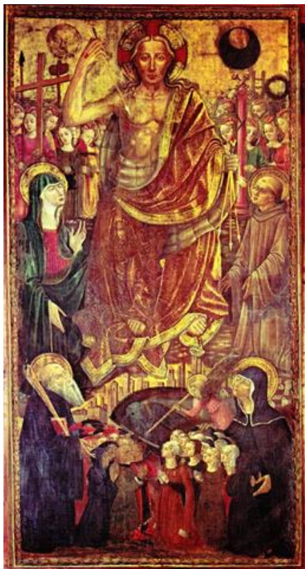
Fig. 13. Benedetto Bonfigli, Dësis (1471-1472). Perugia, chiesa di Santa Maria Nuova.

Non di rado nei gonfaloni umbri la Madonna appare misticamente sospesa sopra un aereo manto di nuvole, immateriale piano spaziale della composizione e allegorica linea di confine fra la scena celeste ed il mondo degli uomini, rappresentato dall'immagine urbana. L'espedito figurativo enfatizza l'estensione della protezione di Maria sull'intera città, la cui rappresentazione iconografica, spesso guidata da intenti di puntuale verismo descrittivo, è introdotta negli stendardi quale elemento ricorrente allo scopo di favorire l'identificazione spirituale del singolo con la condizione dei supplici rifugiati sotto il mantello.