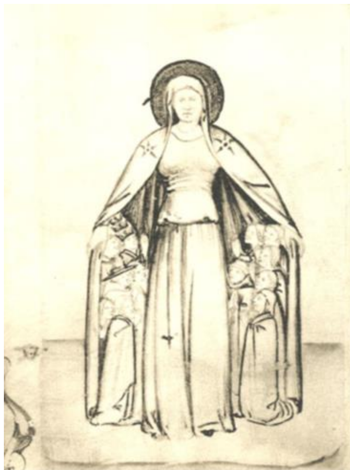
Fig. 1. Anonimo miniatore francese trecentesco, Maria Defensatrix (1324). Dallo Speculum Humanae Salvationis . Cambridge, Fitzwilliam Museum, Ms. "Coleridge" (Ms. 43)

artistica di immagini della Madonna della Misericordia, che dagli albori del XIV secolo prosegue con continuità rappresentativa ininterrotta fino al pieno Rinascimento.