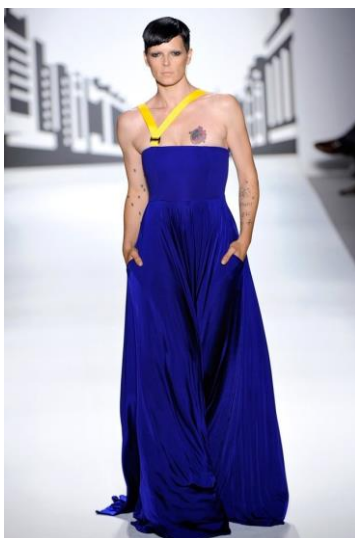
Figura 6: Tautology , David Delfín (primavera/verano 2011).