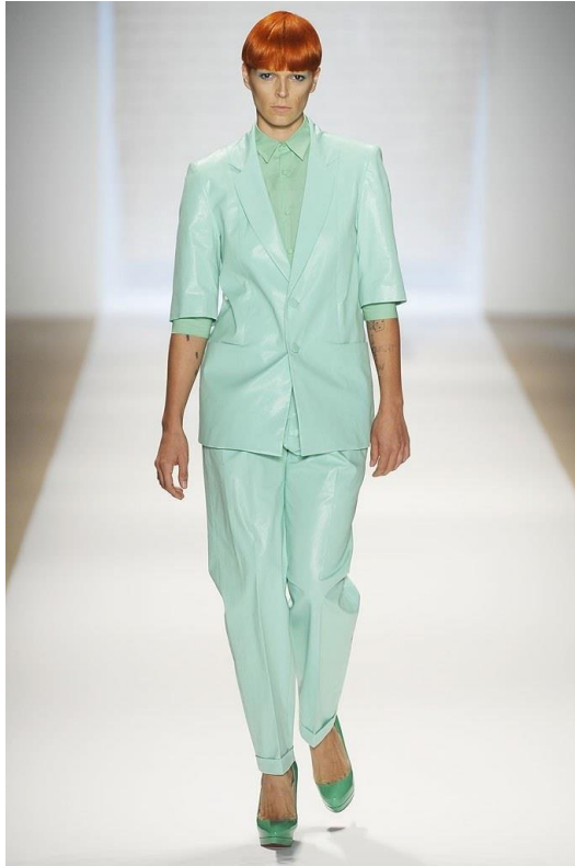
Figura 1: Playback , David Delfín (primavera/verano 2010).