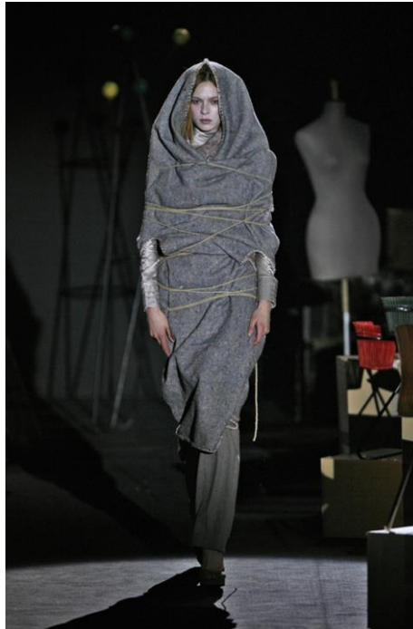
Figura 8: Deménagement , David Delfín (otoño/invierno 2007/2008).

Ya sea en Madrid o en Nueva York David Delfín siempre hizo un constante ejercicio de memoria, recuerdo y melancolía. En sus pensamientos siempre estaban sus seres queridos y todo aquel contexto que le rodeó desde pequeño. Los recuerdos del inconsciente fueron evocados en varias colecciones, sacados a la luz a través del arte. Con Mi manchi , 'te echo de menos' en italiano, Delfín trató los temas de la ausencia y la añoranza, con cierta reminiscencia del glamour de Hollywood y la vuelta a un pasado mejor. En Deménagement , del francés 'mudanza', mostró una serie de looks copados por el fieltro de color gris y marrón, utilizados antiguamente para envolver muebles cuando se cambiaba de hogar. Un desfile remembranza, donde rescata todas las piezas del desván. Objetos recuperados que vuelven a ver la luz y ser reutilizados para no caer en el olvido (fig. 8). Algo parecido ocurrió en Síndrome de Diógenes donde dispuso un cerro de ropa usada, como hiciera Michelangelo Pistoletto 45 , que representaba una acumulación de emociones, incapaces de mantener un orden y culpables de la angustia del diseñador por intentar deshacerse de ellas; convertir el desasosiego en arte se volvió habitual en las colecciones del malagueño (fig. 9) 46 .