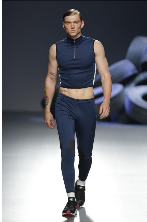
Figura 14: Psoas , David Delfín (primavera/verano 2016).

Todo parecía estar bien hasta que su salud empeoró. En una de las últimas entrevistas de David Delfín para la revista Vogue España volvió a recordar a uno de los artistas que más emuló a lo largo de su vida, Joseph Beuys. Se trataba de una serie de retratos realizados por el fotógrafo de moda Pablo Sáez, su pareja de entonces, en la que “enseñaba su herida” tras la operación por su enfermedad 56 . Ya en su día David se tatuó en el antebrazo ‘Muestra tu herida’ en alemán ( zeige deine Wunde ), el nombre de una instalación de Beuys en Munich, realizada en febrero de 1976 57 . La puesta en conocimiento a sus seguidores del momento tan dramático que estaba viviendo supuso un antes y un después en su vida y en su carrera, pues a partir de entonces se fue apagando poco a poco y no volvió a subirse a la pasarela nunca más, limitando su trabajo a algunas colaboraciones.