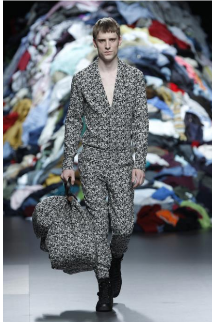
Figura 9: Diogenes Syntrome , David Delfín (otoño/invierno 2011/2012).