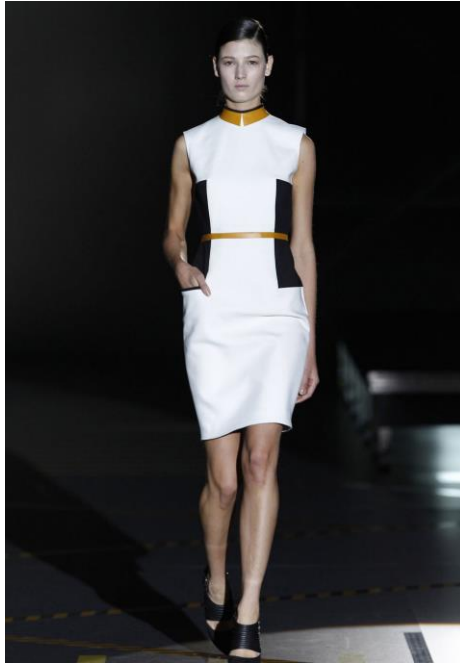
Figura 11: Will , David Delfín (otoño/invierno 2012/2013).

El color del luto más riguroso entre las reinas europeas medievales era el blanco en lugar del negro. Esta idea fue usada por David Delfín para su colección Missing . Tras la muerte de su perrita Alicia, impuso el luto blanco en la pasarela, salvo el look final, de riguroso negro y mantilla, que además conecta con esa idea española que venimos destacando. Las referencias fueron constantes, desde la propia pasarela a la que se accedía pasando una tela, como le gustaba hacer a su mascota con el mantel de la mesa, hasta el uso de claveles, asociados al recuerdo y la muerte en España, o las flores cosidas en los cuellos de las prendas, una referencia a las cosas de croché que hacía su abuela 50 . Como hizo en su colección Playback , asoció una película de Disney a su situación personal. En este caso, como no podía ser de otro modo, fue a Alicia en el país de las maravillas (1951), de ahí la referencia al as de corazones y el suelo en damero (fig. 12) 51 .