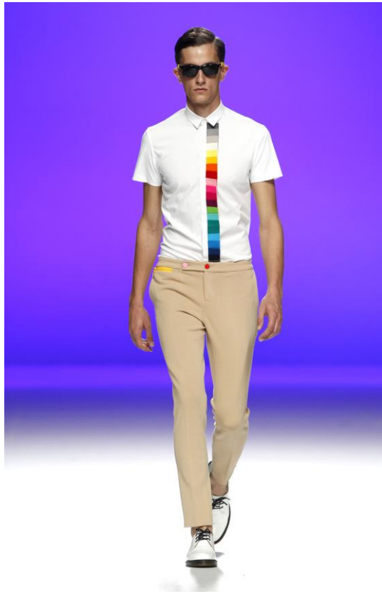
Figura 10: Katharsis , David Delfín (primavera/verano 2012).

“Deseo, voluntad, futuro. Promesa y compromiso. Donde hay voluntad, hay un camino”. Esa fue la tarjeta de presentación de David Delfín junto a las letras de la canción Will que Bimba Bosé y Diego Postigo escribieran como banda sonora del desfile homónimo. Con esta colección hicieron diez años en la pasarela y venían de pasar un momento muy complicado desde el punto de vista empresarial, por eso miraron al futuro. La temática de la colección giraba alrededor de la rehabilitación. Tras los momentos tan arduos era hora de renovarse, de rehabilitarse para coger fuerzas y volver a resplandecer, toda una declaración de intenciones. De esta forma, el diseñador fisgoneó en laboratorios en busca de elementos médicos, como los tubos de ensayo o el látex, para convertirlos en base de sus prendas y complementos (fig. 11) 49 .