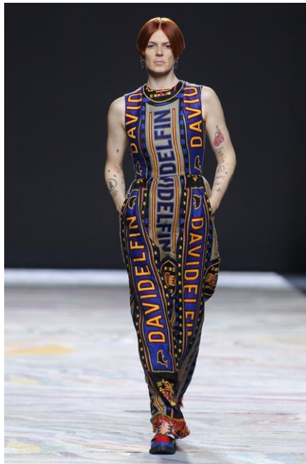
Figura 7: Mentiras (otoño/invierno 2016/2017), David Delfín.