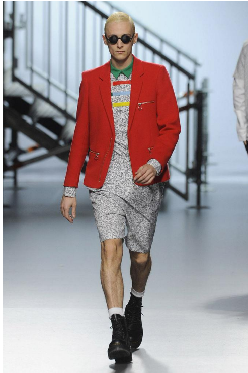
Figura 13: No One , David Delfín (otoño/invierno 2014/2015).

No one era la primera entrega de una trilogía, a la que le seguía El tiempo de los monstruos y culminada con Inferno . Según comentó la firma, las tres colecciones representaba el paso del luto al alivio 53 . Esta afirmación no termina de tener demasiado sentido en el orden en el que fueron presentadas, si nos ceñimos a la estética tétrica de la última parte y el amor profesado en la primera. De hecho, parece describirla al revés. Una situación de plena felicidad, luego “El viejo mundo se muere. El nuevo tarda en aparecer. Y en ese claroscuro surgen los monstruos” 54 , momento de máxima confusión donde el amor se convierte en dudas, y finalmente la destrucción de ese enamoramiento, el infierno, el luto riguroso, los rostros de Santiago Ydáñez impresos en las camisas mostrando su agonía y las velas en la pasarela alumbrando la muerte (fig. 14).