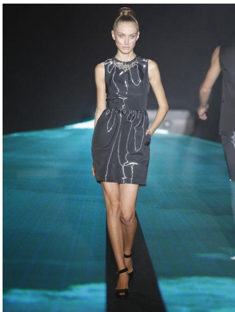
Figura 4: Diastema , David Delfín (primavera/verano 2009).