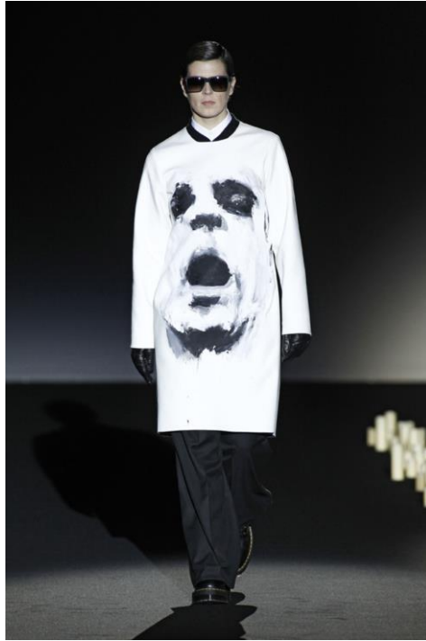
Figura 14: Inferno , David Delfín (otoño/invierno 2015/2016).

Los últimos años de David Delfín estuvieron marcados por el deporte, del que se confesó adicto. El ejercicio físico se convirtió en una obsesión para él. El culto al cuerpo, la proyección de una imagen atractiva hacia los demás y el aumento de la autoestima marcaron esta etapa. Como él mismo atestiguó, y eligiendo unas palabras de aquella famosa canción de Lola Flores que tanto le gustaba: “Estoy como nunca”. A partir de entonces sus colecciones se volvieron muy deportivas. Por ejemplo, Psoas es el nombre del músculo destinado a sostener nuestro peso y mantenernos en pie, que David se lesionó haciendo ejercicio. Además, tiene forma de corazón. La colección estaba compuesta por ropa de inspiración deportiva, como metáfora del esfuerzo y la perseverancia, pero manteniendo el patronaje y la sastrería tan característica de la firma (fig. 15) 55 . Lo mismo ocurrió con la ya citada Mentiras , en la que fusionó esta estética deportiva con la selección española.