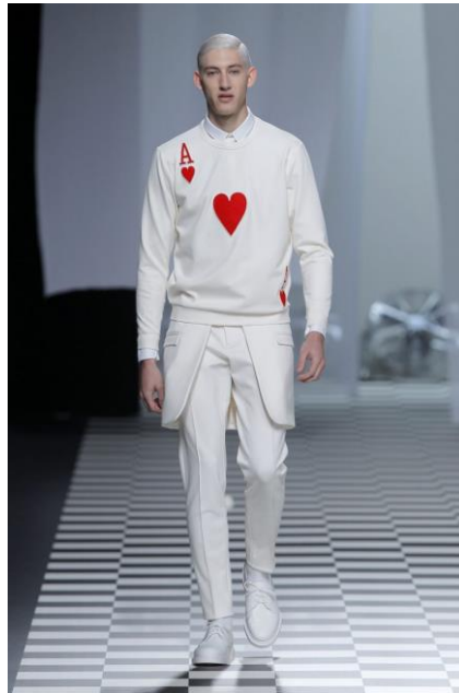
Figura 12: Missing , David Delfín (otoño/invierno 2013/2014).