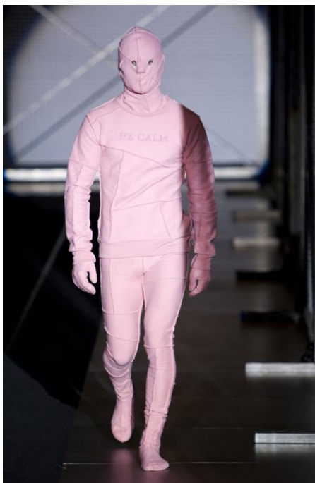
Figura 3: Intimidad , David Delfín (otoño/invierno 2008/2009).