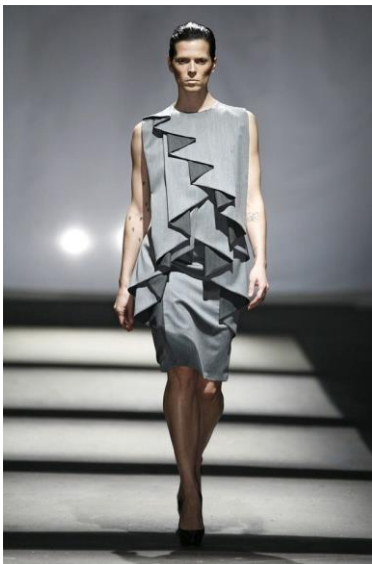
Figura 5: Revelations , David Delfín (otoño/invierno 2009/2010). Fuente: © Davidelfin.

fondo que emulaba la Gran Vía madrileña para su puesta en escena en Nueva York, que celebraba además el aniversario de esta mítica avenida (fig. 6) 43 .