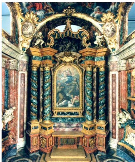
Figura 4. Nicola Michetti, Maqueta de la capilla Pallavicini-Rospigliosi en San Francesco a Ripa, 1712.