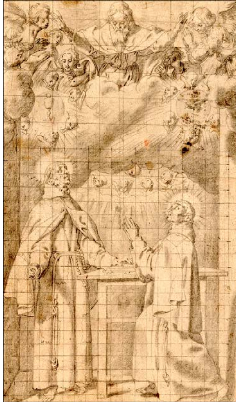
Figura 1. Pedro de Alcántara y Pascual Baylón en adoración a la Trinidad, atribuido a Andrea Lilio, ca. 1622-1623.