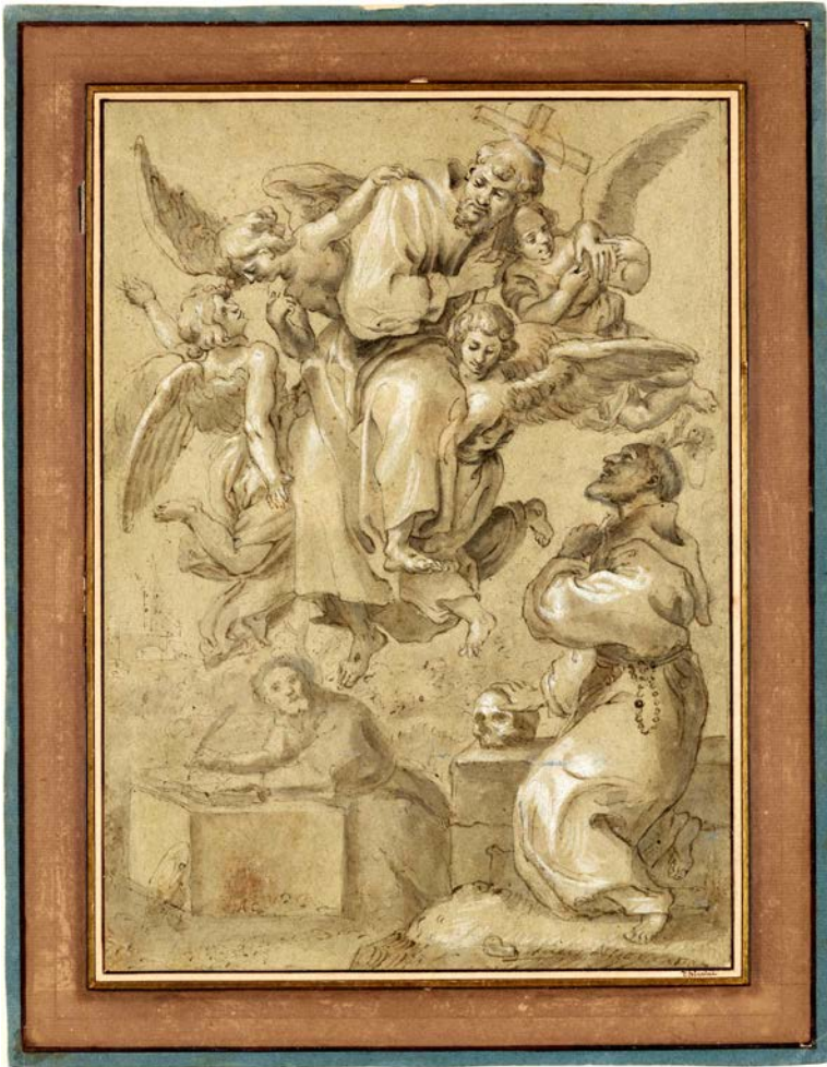
Figura 2. Francisco de Asís, Bonaventura de Bagnoregio y Antonio de Padua, atribuido a Andrea Lilio, ca. 1625. Fuente: © New York, The Morgan Library.

Las obras de demolición y reconstrucción comenzaron en 1603: Lelio Biscia con el apoyo del cardenal protector de la orden franciscana Girolamo Mattei –quien tenía su propia capilla familiar en la iglesia– le había confiado a Onorio Martino Longhi la tarea de reconstruir el presbiterio de San Francesco a Ripa 31 .