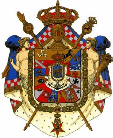
Joaquín Napoleón, rey de las Dos Sicilias y Gran Almirante