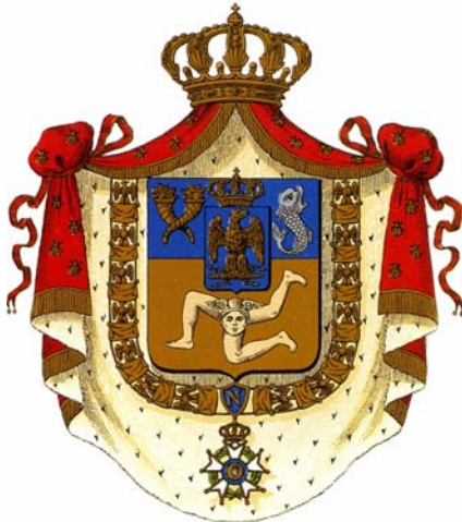
José Napoleón, rey de las Dos Sicilias