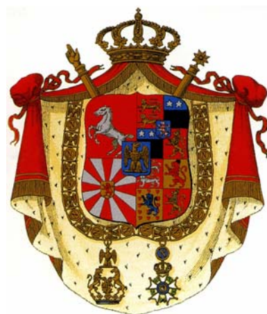
Jerónimo Napoleón, rey de Westfalia