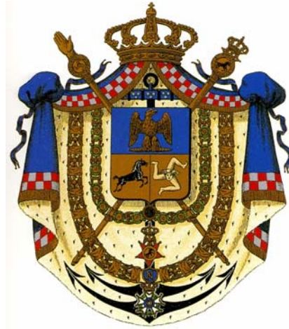
Joaquín Napoleón, rey de las Dos Sicilias, y Gran Almirante