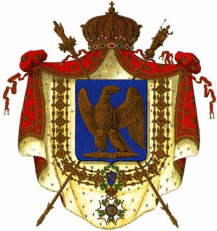
Napoleón, Emperador de los Franceses