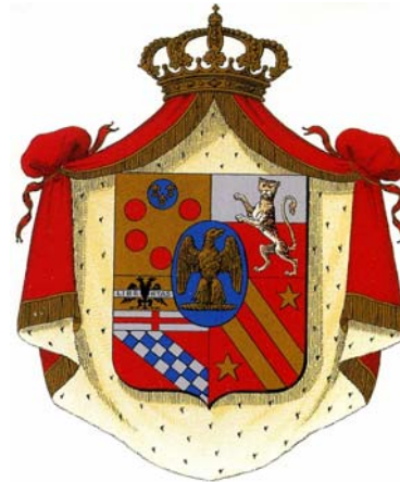
Elisa Napoleón, Gran Duquesa de Toscana Duquesa de Lucca y Piombino