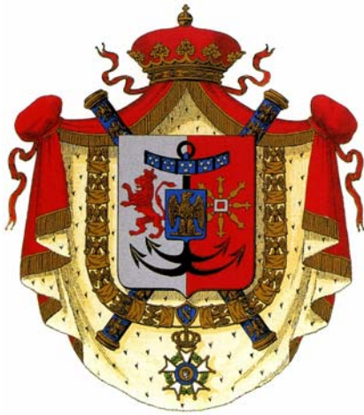
Joaquín Napoleón, Gran Duque de Berg y Gran Almirante