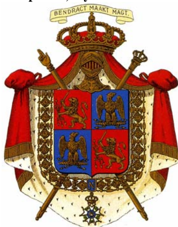
Luis Napoleón, rey de Holanda