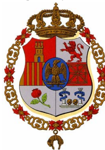
José Napoleón, rey de España y las Indias