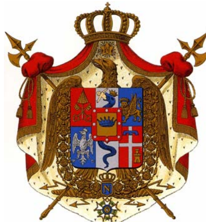
Napoleón, rey de Italia