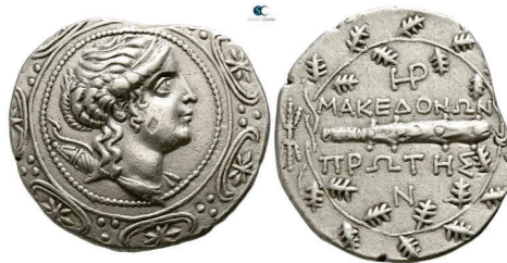
Figura 9. Estatera de Orthagoria (Macedonia), 300 a.C. S.N.G. Cop: 689.

ANFÍPOLIS: (167-149 a.C.). Tetradracma. A/Escudo macedonio con cabeza diademada de Artemisa a derecha. R/Maza dentro de laurea encima y debajo leyenda: ΜΑΚΕΔΟΝΩΝ – ΠΡΟΤΗΣ. S.N.G. Cop.: 51-56.