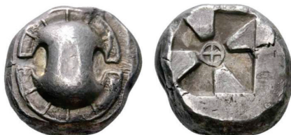
Figura 23. Estatera beocia. (500-480a. C. AR 12,31 g.)

TEBAS: (550-480 a.C.). AR. Estatera, dracma y hemióbolo. A/Escudo beocio. R/Cuadrado incuso con rueda de cuatro radios en el centro. S.N.G. Cop.: 248-259.