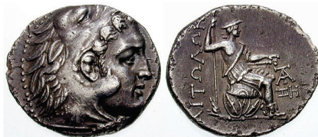
Figura 19. Moneda de bronce de Pelinna. (Siglo IV a.C. AE 14mm, 3.02 g.)

LIGA AETOLIA: (279-168 a.C.). A/Cabeza de Heracles con leonté a derecha. Rev. Aetolia sentada sobre un trofeo de acumulación de escudos, con lanza y espada. Leyenda: ΑΙΤΩΛΩΝ. S.N.G. Cop.: 2-3.