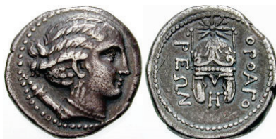
Figura 7. Estatera de Orthagoria (Macedonia), 300 a.C.

ORTHAGORIA: (350 a.C. o después). AR, Estatera persa. A/Cabeza de Artemis a derecha. R/Casco estelado. Alrededor leyenda: ΟΠΘΑΓΟ ΡΕΩΝ. S.N.G. Cop.: 689.