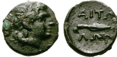
Figura 20. Moneda de bronce etolia. (290-220a. C. AE 12mm, 1,66 g.)

LIGA AETOLIA: (279-168 a.C.). A/Cabeza de Etolia con kausia a derecha. Rev. Punta de lanza horizontal y leyenda encima y debajo: ΑΙΤΩ-ΛΩΝ. S.N.G. Cop.: 22-24.