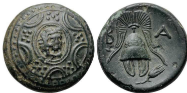
Figura 14. Moneda de bronce de Alejandro III de Macedonia (336-323 a.C. Æ 18mm, ceca macedonia).

(Después del 311). A/Escudo macedonio. R/casco macedonio. Alrededor leyenda: ΒΑΣΙΛΕΩΣ. S.N.G. Cop: 1118-1137. Este tipo se repetirá reiteradamente con variaciones en el escudo y posteriormente en las acuñaciones de los reyes Demetrios Poliorcetes (292-291 a.C.) y Pirro (288-284 y 274-272 a. C).