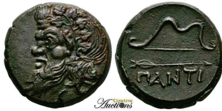
Figura 2. Moneda de bronce del Quersoneso tráxico (350-300 BC. AE 21mm.). S.N.G. Cop: 7.

(100-70 a.C.).AE. A/Cabeza de Dionisos coronado a derecha. R/Funda de arco y carcaj. Monograma a izquierda. S.N.G. Cop.: 10.