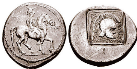
Figura 11. Estatera de Orthagoria (Macedonia), 300 a.C. S.N.G. Cop: 689.

ALEJANDRO I: (498-454 a.C.). AR. Tetróbolo. A/Caballo al trote a izquierda. R/Casco corintio con cresta dentro de cuadrado punteado. S.N.G. Cop.: 485-496.