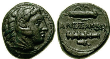
Figura 12. Moneda de bronce de Alejandro III de Macedonia (336-323 a.C. Æ 18mm, ceca macedonia).

ALEJANDRO III: (336-323 a.C.). AE. A/Cabeza de Alejandro II como Heracles a derecha. R/Maza, carcaj y arco, leyenda: ΑΛΕΞΑΝΔΡΟΥ. S.N.G. Cop.: 1037-1063.