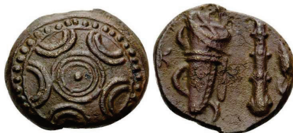
Figura 13. Moneda de bronce de Alejandro III de Macedonia (336-323 a.C. Æ 18mm, ceca macedonia).

(336-323 a.C.). A/Escudo macedonio. R/Maza, arco y carcaj. S.N.G. Cop: 1129.