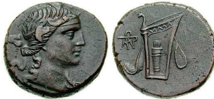
Figura 3. Moneda de bronce de Panticapeon (100-70 a.C. AE 25mm.). S.N.G. Cop: 7.

(100-70 a.C.).AE. A/Cabeza de Dionisos coronado a derecha. R/Funda de arco y carcaj. Monograma a izquierda. S.N.G. Cop.: 10.