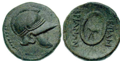
Figura 6. Moneda de bronce de Mesembria (300-250 a.C. AE 20mm.).

MESEMBRIA: (III-II siglo a.C.). AE. A/Casco ático de lado. R/Rueda en perspectiva con leyenda alrededor: METAMBPIANΩN. S.N.G. Cop.: 658.