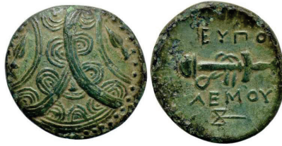
Figura 15. Moneda de bronce de Eupolemo. Ceca de Mylasa, Caria. (295-280 a.C. AE 17mm, 4,76gr.)

EUPOLEMO: (314 a.C.). AE. A/Tres escudos macedonios solapados. R/Espada con vaina y correa. Alrededor leyenda: ΕΥΠΟΛΕΜΟΥ. S.N.G. Cop.: 1165-1169.