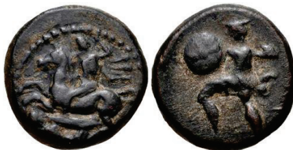
Figura 18. Moneda de bronce de Pelinna. (Siglo IV a.C. AE 14mm, 3.02 g.)

PELINNA: (400-344 a.C.). AR., trihemíobolo. A/Jinete con lanza atacando. R/Guerrero con petaso, escudo y dos lanzas, corriendo a izquierda. S.N.G. Cop.: 185-187.