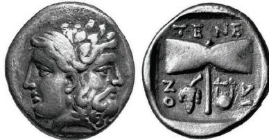
Figura 29. Dracma de Tenedos. (450-387a. C. AR 17mm, 3,6 g.)

ISLA DE TENEDOS: (siglos II-I a.C.). AR., tetradracma, y dracma. A/Cabeza femenina a izquierda. R/Doble hacha dentro de corona de laurel, en algunos casos con leyenda alrededor: TENEDION. S.N.G. Cop.: 526-529.