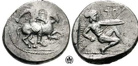
Figura 30. Estatera de Tenedos. (425-400a. C. AR, 10,13 g.)

TARSUS: (Siglo V a.C.). AR, estatera. A/Jinete real al galope con látigo y birrete persa. R/Hoplita desnudo con casco corintio con cresta, arrodillado a izquierda portando lanza y escudo decorado con Gorgona en el centro. S.N.G. Cop.: 259.