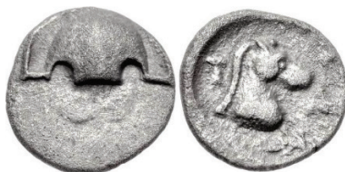
Figura 22. Óbolo beocio. (387-374a. C. AR 10mm, 0,95 g.)

TANAGRA: (387-374 a.C.). AR, Hemióbolo. A/Medio escudo beocio. R/Prótomo de caballo a derecha. S.N.G. Cop.: 233.