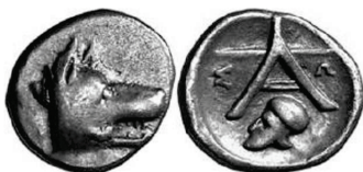
Figura 26. Óbolo de Argos. (350-228a. C. AR 10mm, 0,87 g.)

ARGOS: (350-228 a.C.). AR, óbolo. A/Prótomo de lobo o perro a derecha. R/Leyenda: A ΣΩ. Debajo casco corintio. S.N.G. Cop.: 75.