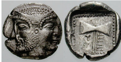
Figura 28. Didracma de Tenedos. (550-470a. C. AR 17mm, 7,79 g.)

ISLA DE TENEDOS: (550-siglo I a.C.). AR., tetradracma, didracma, dracma y hemidracma. A/Cabeza masculina y femenina bifronte. R/Doble hacha en algunos casos con leyenda alrededor: TENEDION. S.N.G. Cop.: 505-525.