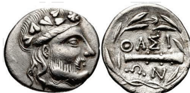
Figura 8. Estatera de Orthagoria (Macedonia), 300 a.C.

TASOS: (196-180 a.C.). Hemidracma (14mm, 1.21 g.). A/Cabeza de Dionisos a derecha. R/Maza dentro de laurea y leyenda ΘΑΣΙΟΝ. S.N.G. Cop.: 1036.