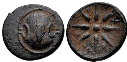
Figura 21. Moneda de bronce beocia. (370-364a. C. AE 15mm, 2,23 g.)

PHARAE: (550-480 a.C.). AR. Estatera y dracma. A/Escudo beocio. R/Cuadrado incuso. S.N.G. Cop.: 209-211.