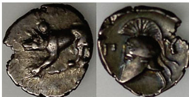
Figura 25. Óbolo de Argos. (421a. C. AR 10mm, 1,20 g.)

ARGOS: (421.343 a.C.). AR, dióbolo y óbolo. A/Lobo o perro a izquierda en posición de ataque. R/casco corintio con cresta a izquierda. S.N.G. Cop.: 21-22.