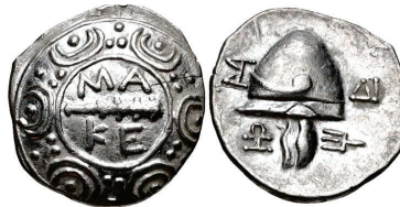
Figura 10. Estatera de Orthagoria (Macedonia), 300 a.C. S.N.G. Cop: 689.

ANFÍPOLIS: (187-168 a.C.). Tetróbolo. A/Escudo macedonio con maza y leyenda MA -KE en el centro. R/Casco macedonio a izquierda S.N.G. Cop.: 51-56.