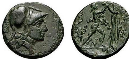
Figura 17. Moneda de bronce de Antigono Gonatas (AE 19 mm.)

ANTIGONO GONATA: (277-239 a.C.). AE. A/Cabeza de Atenea a derecha. R/Pan erigiendo trofeo. S.N.G. Cop.: 1206-1213.