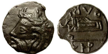
Figura 4. Moneda de bronce de Olbia (AE 21mm. 7.2 gr). S.N.G. Cop: 7.

OLBIA: (III-I siglo a.C.). AE. A/Cabeza barbada con cuerno de Borysthenes , divinidad fluvial. R/carcaj y hacha con leyenda alrededor: OLBIO. S.N.G. Cop.: 85-94.