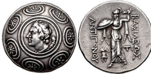
Figura 16. Tetradracma Antigonos Gonatas. Anfípolis.

ANTIGONO GONATA: (277-239 a.C.). AR. Tetradracma. A/Escudo macedonio con cabeza de Pan en el centro, a derecha. R/ Atenea Alkis con escudo y lanza en posición de ataque. A los lados leyenda: ΑΝΤΙΓΟΝΟΥ ΒΑΣΙΛΕΩΣ. S.N.G. Cop.: 1198-1202.