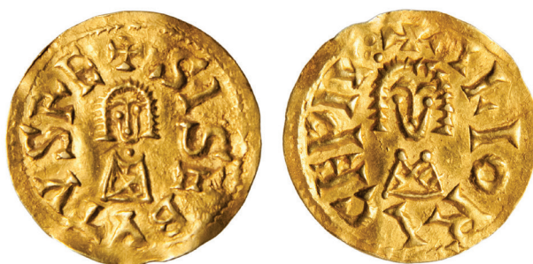
Figura 1. Nuevo tremissis de Sisebuto, acuñado en Eliocroca (x 2). Museo de León (nº 2021/27).

A la hora de reconstruir el pasado, la numismática vuelve a distinguirse como una de las ciencias más importantes que existen. Esto todavía se hace más evidente cuando comprobamos que otras fuentes o la arqueología, con menor valor documental, simplemente callan y producen considerables lagunas en la historia. En efecto, los objetivos de estas líneas se centran en el estudio y en la documentación de un nuevo tremissis (también conocido como tremis o triente, siendo la tercera parte de un sólido), acuñado bajo el reinado de Sisebuto (612-621 d. C.). La pieza en cuestión (fig. 1) se encontró por casualidad en un jardín, situado en un domicilio particular de la calle Rodríguez del Valle 3 , en pleno casco urbano de la ciudad de León.