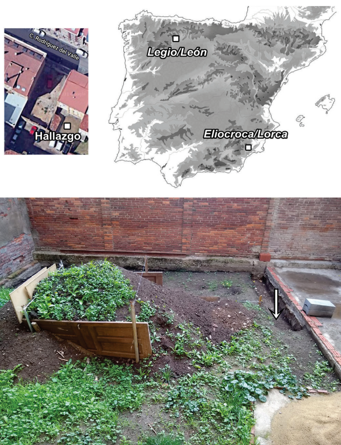
Figura 2. Fotografía del jardín en el momento del hallazgo, indicándose con flecha el punto exacto en el que se encontró el tremissis , además de León y Lorca en un mapa peninsular así como la calle Rodríguez del Valle.

Precisamente los hallazgos de moneda visigoda en la provincia de León, aunque escasos y por vía solo de noticias, son bien conocidos. De la época visigoda, sabemos que cerca de la Iglesia de San Bartolomé, en Astorga, se encontró una moneda áurea de imitación sueva, emitida a nombre de Valentiniano III ( post 423/425-455 d. C.). Asimismo, del castillo de Ponferrada procede un tremissis de Recaredo I (586-601 d. C.). A esta recopilación deben sumarse dos tremisses de Sisebuto (612-621 d. C.), hallados en Astorga y en la vecina localidad zamorana de Fuente Encalada, además de cuatro tremisses de Recaredo I (586-601 d. C.) localizados sin más datos que en León, tal vez un tesorillo (Ayello Álvarez, 1990-1991: 300; algunas de estas monedas, son citadas por Alonso Ávila, 1985: 66, y Mañanes Pérez, 1982: 292). En fechas recientes, en la villa de Los Villares (Quintana del Marco) se encontró un tremissis de Sisebuto (612-621 d. C.), acuñado en Tarraco (Regueras Grande y Rodríguez Casanova, 2017: 13-14, fig. 1).