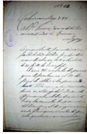
Siglo XIX (Cochinoca).