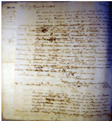
Siglo XVIII (Casabindo).