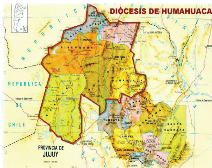
Mapa de la Prelatura de Humahuaca.

Creada el 8 de setiembre de 1969, con la bula “Praeclarissima exempla”, de Pablo VI. Comprende, en la provincia de Jujuy, los departamentos de Cochinoca, Humahuaca, Rinconada, Santa Catalina, Susques y Yavi. En la provincia de Salta, la parte occidental de los departamentos de Iruya y Santa Victoria.