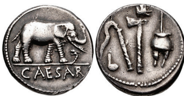
Denario de César RRC 443/1.

El presente artículo pretende actualizar parte de un trabajo que publicamos sobre el denario RRC 443/1, de C. Julio César ( cos. I 59 a.C.), emitido en los años 49-48 a.C., y sus diversas imitaciones 3 . Consideramos de interés profundizar en estas últimas monedas, más concretamente las que mencionan a dos gobernadores de la provincia de la Galia Comata , acuñadas en el oppidum trevero de Titelberg (Luxemburgo), en la Gallia Belgica 4 , con letreros latinos, por lo que se trata de amonedaciones galorromanas.