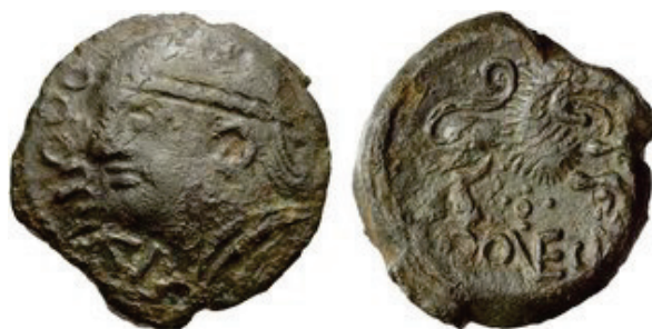
Bronce de Roveca (DT 583).

lercii Eburovices 65 , los Lexovii , los Carnutes o, más generalmente, en los Belgae 66 . Especialmente, estas monedas tienen una gran analogía con las bronce de ROVECA de los Meldi 67 (BN 7643-7659. DT 582-584. LT 7646 y 7658. RIG IV 241) y los de ATISIOS REMOS de los Remi (BN 8054-8083. DT 594-596. LT 8054 y 8082. RIG IV 56) 68 .