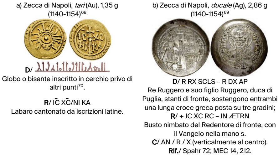
Figura 1. Due esemplari prodotti a Napoli al tempo di Ruggero II 71 .

Si ricorda inoltre la convocazione del Gran Parlamento a Capua, nel novembre 1143, accadimento che conferma ancora una volta la presenza di Ruggero II nei pressi di Napoli, portandone il soggiorno continentale a più di tre anni dall'insediamento ufficiale, compatibilmente con i suoi frequenti spostamenti già ricordati supra .