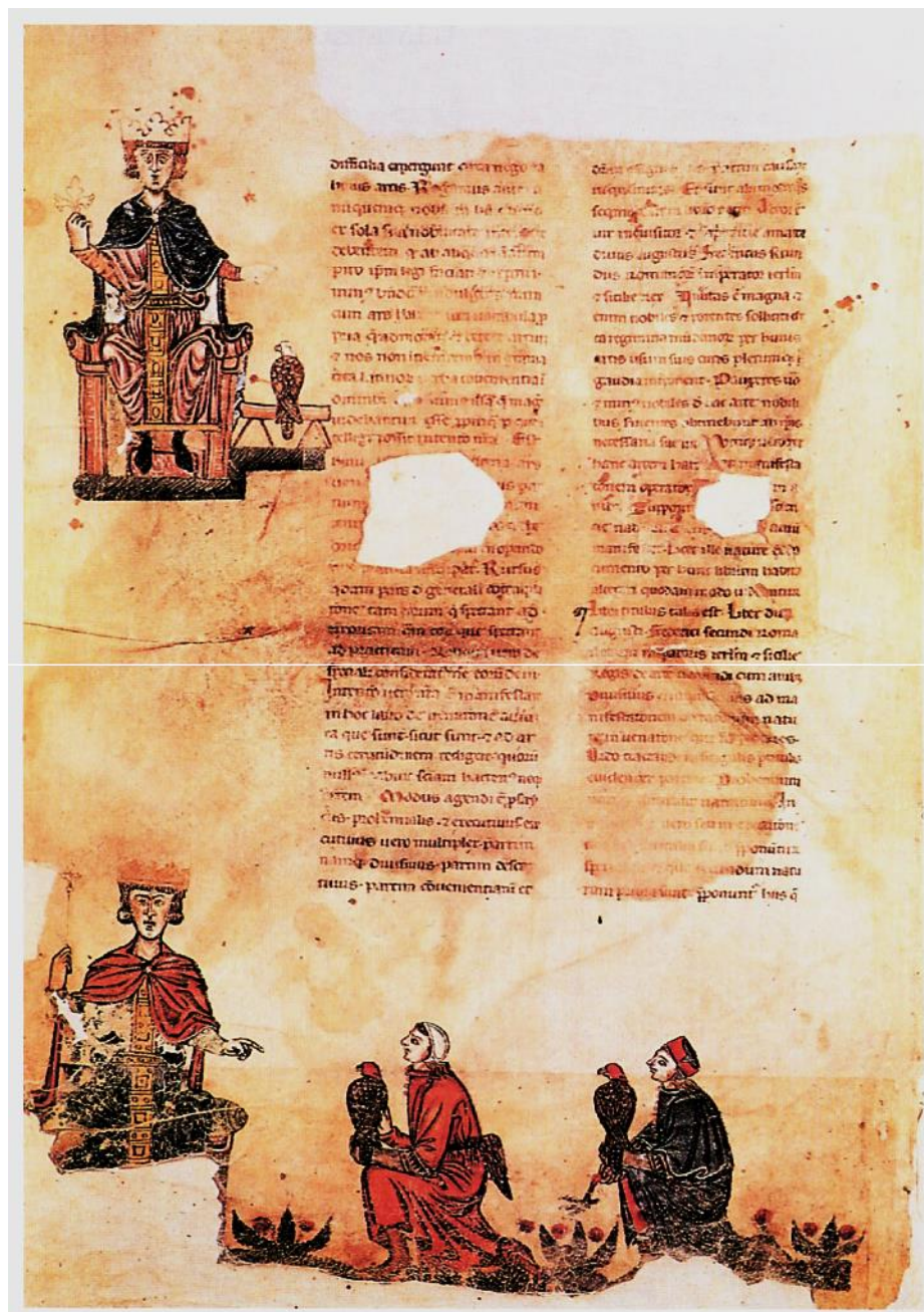
Fig. 3. Federico II in maestà, miniatura su pergamena, 1258-1266. Roma, Biblioteca Apostolica Vaticana, Ms. Lat. 1071, De arte venandi cum avibus, fol. 1v.