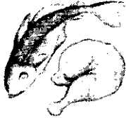
Carne y pescado cada día