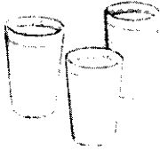
Tres vasos de leche cada día