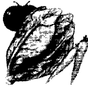
Verduras y hortalizas cada día