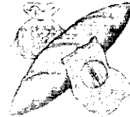
También hay que tomar diariamente pan, pasta, etc.