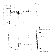
2 ó 3 litros de agua cada día