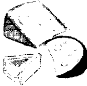
Queso tres veces a la semana