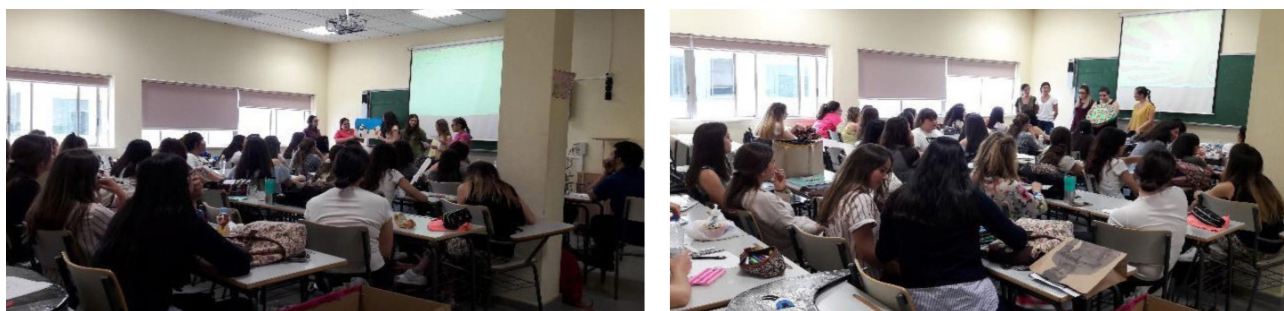
Figura 3. Exposición de los álbumes en el aula. Elaboración propia.

En una sesión doble de prácticas enmarcadas en la asignatura de Desarrollo de Habilidades Lingüísticas y sus Didácticas , se produce la puesta en común de los álbumes, acompañada de una lectura expresiva de los mismos con duración de unos 10 minutos (ver figura 3).