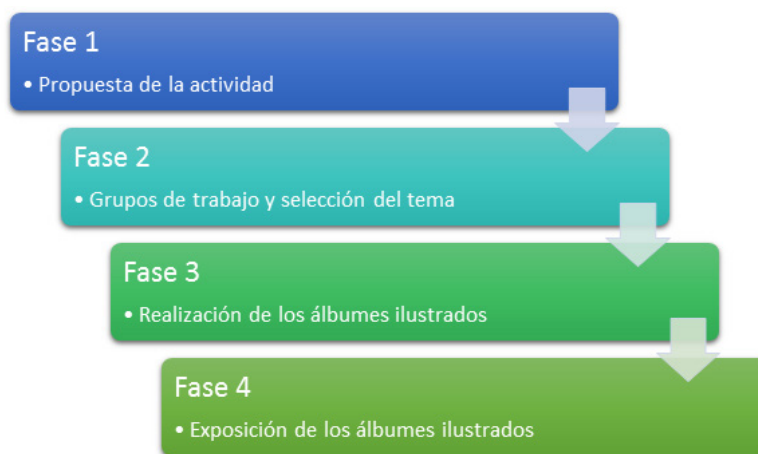
Figura 2. Fases en el desarrollo de la práctica. Elaboración propia.

En esta misma línea del enfoque comunicativo, una de las estrategias metodológicas más importantes que se desarrollan en esta práctica es el aprendizaje cooperativo, que parte de la previa elaboración de contratos de aprendizaje 10 . El aprendizaje cooperativo va mucho más allá del simple trabajo en grupo, ya que se hace desde el respeto y la aceptación de los y las demás, elemento básico de la inclusión social que pasa por una visión social del alumnado, en la que se tiene en cuenta la dimensión afectiva (Arnold, 1995; De Miguel, 2006; Marcelo, 2008).