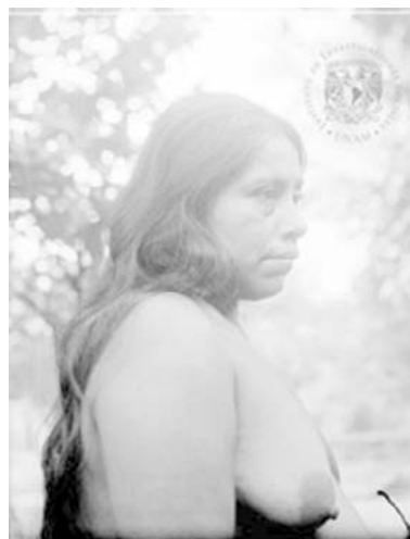
Tabla. 3. Catalogación del Archivo México Indígena perteneciente al Instituto de Investigaciones Sociales de la Universidad Nacional Autónoma de México 4