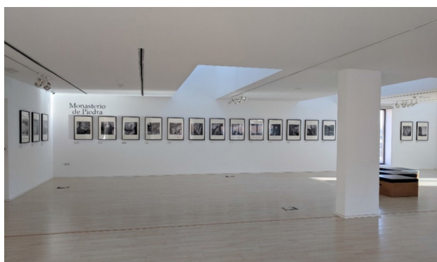
Imagen 11. Vista de una de las salas de la muestra. Año 2019.

A esta exposición se llevaron imágenes de Calatayud, Ateca y del Monasterio de Piedra, donde paisaje, tradición y sociedad se combinaban en un mismo espacio. En la misma sala del museo se expusieron también otros objetos pertenecientes a Jalón Ángel como sus cámaras fotográficas, los libros que editó con sus cursos por correspondencia o periódicos de la época con artículos referidos a exposiciones del autor. La muestra fue visitada por más de cinco mil personas.