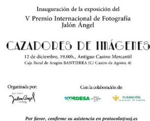
Imagen 15. Invitación a la exposición Cazadores de Imágenes de 2019.