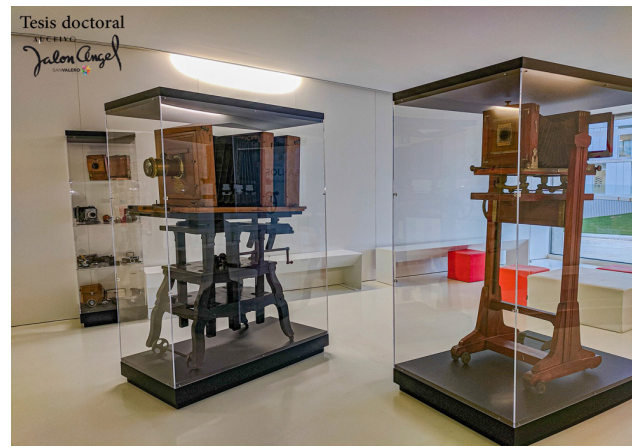
Imagen 4. Conjunto de cámaras donadas en el legado Jalón Ángel. Elaboración propia.

Las primeras tareas que se llevaron a cabo fueron las de extraer todos los materiales de las cajas, ordenarlos y limpiarlos. A continuación, se trabajó cada objeto (fotografía, cámara, objetivo, libro...) por separado. Respecto a las fotografías en negativo, se procedió a escanearlas con un escáner de negativos adquirido con la primera ayuda pública, a máxima resolución conservando la calidad óptica que ofrece el escáner y tamaño real, con pa-