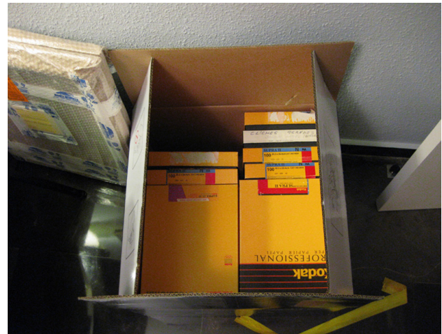
Imagen 1. Una de las cajas en las que llegó el legado. Año 2011.

Es necesario indicar la magnitud del trabajo realizado en el Archivo Jalón Ángel, así como las tareas que en él se llevan a cabo. La razón es que fue necesario comenzar el estudio de su obra desde los cimientos de la investigación ya que no existía ningún estudio completo y profundo sobre el trabajo del fotógrafo.