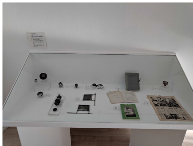
Imagen 12. Vitrina con algunos de los objetivos y publicaciones de Jalón Ángel. Año 2019.

También en 2019, se inauguró en la Casa de Imagen (Santo Domingo) la exposición Jalón Ángel (1898-1976). Fotógrafo, viajero e impulsor de la educación que formó parte de la celebración de las Semanas de España organizadas por la Embajada de España en República Dominicana y que contó con la colaboración de AECID, entre otras entidades.