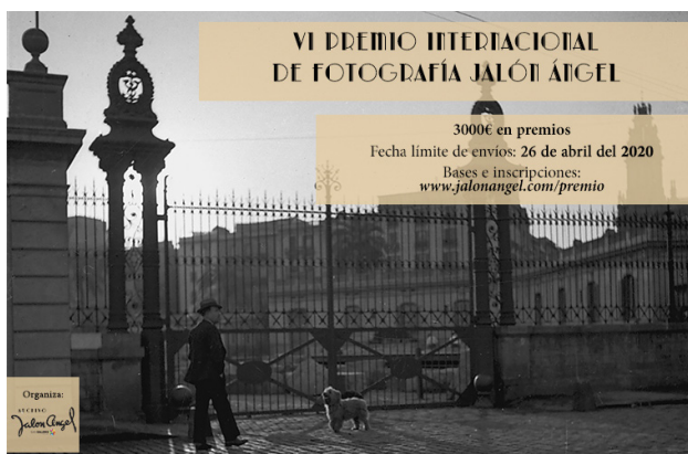
Imagen 14. Cartel de la convocatoria del VI Premio de Fotografía Jalón Ángel. Año 2020.

En 2018 el Archivo Jalón Ángel formó parte del Centenario del Parque Nacional de Ordesa y Monte Perdido por lo que el premio incluyó una categoría especial sobre el parque. En 2020, dado su éxito, se mantuvo fija una tercera categoría especial diferente cada año.