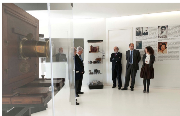
Imagen 9. Acto de inauguración de la exposición permanente de las cámaras de Jalón Ángel. Año 2011.

A esta exposición se le sumó en 2017 una sala de exposiciones con la muestra permanente de una pequeña selección de fotografías de Jalón Ángel que se encuentra en la sede de la Fundación San Valero.