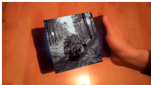
Imagen 8. Efecto óptico de la realidad aumentada con una fotografía de Jalón Ángel al pasar el teléfono sobre la firma del fotógrafo.

Tras el diseño de la aplicación comenzó la fase de implementación. La fórmula elegida fue una descarga desde el mercado de Android con un código QR o desde la propia web del archivo 6 . El usuario podía imprimir un código, que en este caso no era el habitual QR, sino la propia firma digitalizada de Jalón Ángel. Cuando el usuario colocaba sobre dicho código su tablet o teléfono con la app abierta se podía visualizar, en lugar de este del código, la fotografía de Jalón Ángel que deseaba o bien un pase de fotografías. El código podía tener cualquier tamaño y podía estar en vertical u horizontal, de tal forma que se podía tener una experiencia de disfrute de las imágenes de Jalón Ángel muy cercana a la realidad de la toma real.