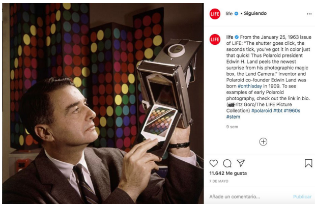
Figura 6. Retrato de Edwin H. Land perteneciente al archivo de la revista LIFE, 1963.

Lo mismo ha sucedido con la conservación del patrimonio fotográfico, rica fuente de historia y cultura reconocido tanto por los/as profesionales de la fotografía como por la sociedad en general. En pleno siglo XXI, las nuevas formas de documentación, archivo y mantenimiento de la fotografía tal y como es concebida hoy es a través de la digitalización y de las redes sociales, fenómenos que han colaborado en la globalización (más aún si cabe) de la fotografía y sus recursos.