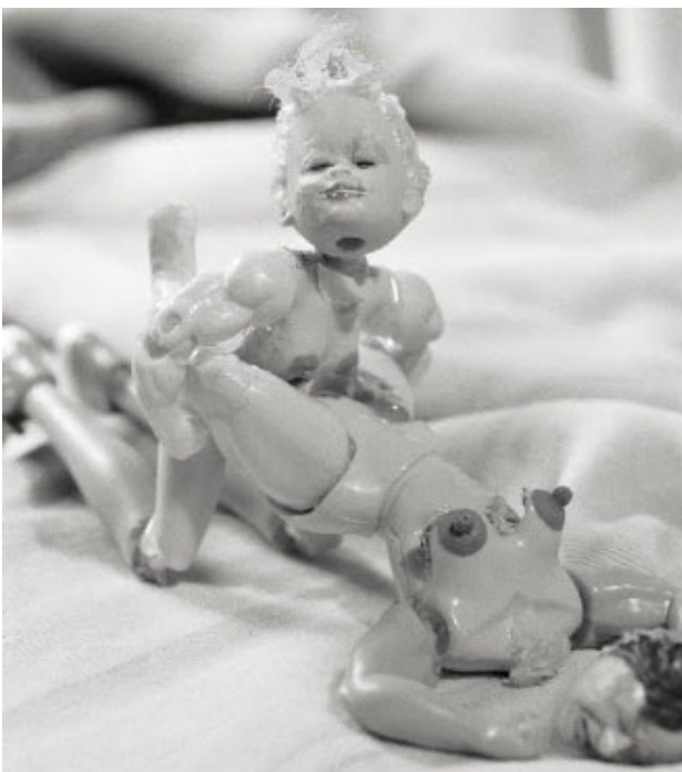
Figura 3. Untitled #322, Cindy Sherman (1996) from The Feminist Institute Digital Exhibit Project.

En el lado opuesto, el mito del vampiro como espejismo, entiende que la representación fotográfica es una construcción cultural, es decir, la fotografía es un registro de una experiencia estética y simbólica. Fontcuberta sostiene que ambos mitos no sólo coexisten en la fotografía contemporánea, sino que se han mezclado. Cindy Sherman (Morris, y Sherman, 1999), cuya obra ilustra el mito del vampiro, representa un mundo que de por sí es todo imagen. A Sherman le interesa hablar de imágenes, de construcciones, no de realidades neutras. Su mirada es reflexiva, no distingue entre sujeto y objeto porque se reconoce a sí misma como un ser reflexivo, un producto cultural y simbólico circunscrito en una cultura.