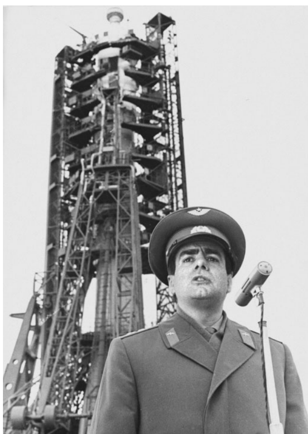
Figura 4. Ivan Istochnikov dando un discurso frente a su nave , Joan Fontcuberta (1997).

que aporta la foto, la imagen que captamos con la cámara es una de las extraordinarias experiencias que nos proporciona la fotografía: “Así ha sido desde 1939 y a plena satisfacción del público, a pesar de que los expertos hayamos reprochado un exceso de credulidad. De acuerdo, a veces los fotógrafos han abusado de su fuerza de convicción, pero esto no obsta para que reconozcamos que el gran legado de la fotografía es la sensación de encapsular la verdad. (Fontcuberta, 2016: 122). Aunque lo verdadero puede a veces no resultar verosímil, lo que implica que lo inverosímil puede a veces ser verdadero. “[...] De lo que también se deduce que pueden coexistir varias verdades simultáneamente o que a veces hay que mentir para decir la verdad” (Fontcuberta, 2016: 74)