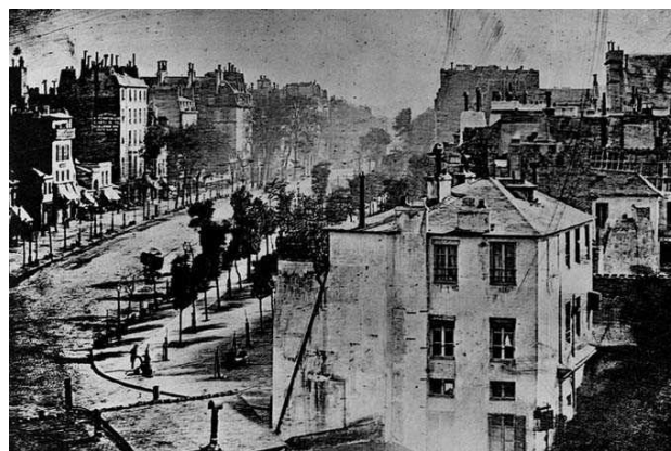
Figura 5. Daguerrotipo del Boulevard du Temple de París (1838).

En 1838, Louis Daguerre que, como hemos señalado anteriormente, es reconocido como el inventor de la fotografía, mediante su procedimiento fotográfico, el Daguerrotipo, consiguió lo que se considera el primer retrato de la historia de la fotografía. Para ser más precisas, la primera imagen fotográfica en la que aparece un ser humano. Se puede observar en su imagen del Boulevard Du Temple la figura de un limpiabotas. Este primigenio retrato de la historia de la fotografía es muy significativo para entender la ontología, la esencia de la representación de la imagen fotográfica, que se mueve en esa dualidad del espejo: asepsia y especulación.