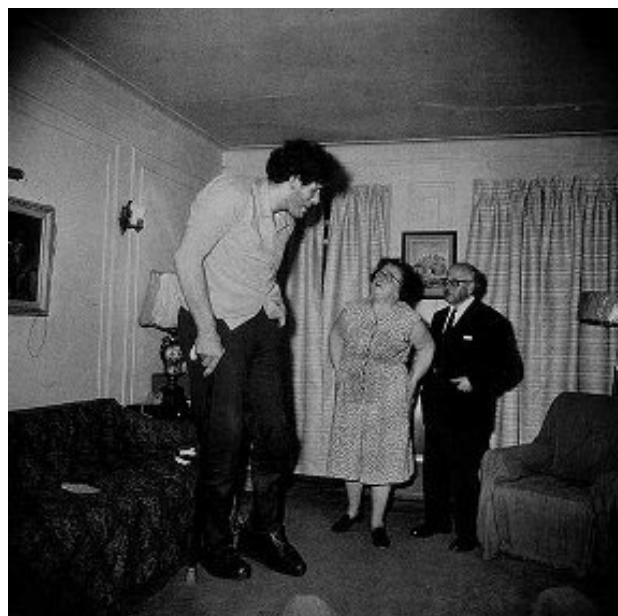
Figura 2. Fotografía Gigante judío en casa con sus padres en el Bronx , Nueva York (1970), Diane Arbus. Fuente: https://elpais.com/diario/2006/02/25/babelia/1140825968_850215.html