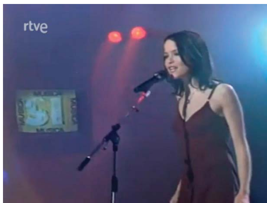
Fig. 2 : Actuación en directo de The Corrs en Música Sí (20/12/1997).