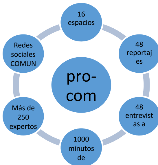
Figura 2: Resultados cuantitativos de la primera temporada de “Semillas de Ciencia”

radiofónicas que se están generando a lo largo de 2016, y que se van actualizando en la web de referencia del proyecto.