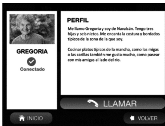
Figura 3. Pantalla del perfil de la persona usuaria.

de los usuarios desde un principio para la definición de funcionalidades e interfaces. El desarrollo se ha realizado utilizando tecnología madura y fiable. Algunos de los puntos destacables de la misma son los siguientes: