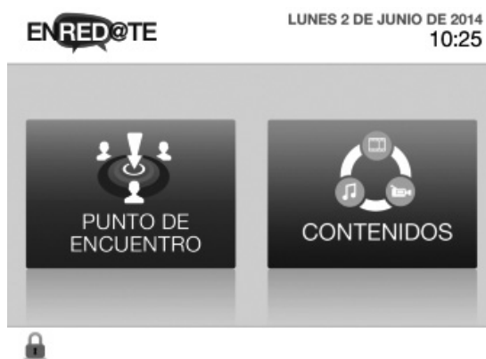
Figura 2. Pantalla del menú «Punto de Encuentro» y contenidos.