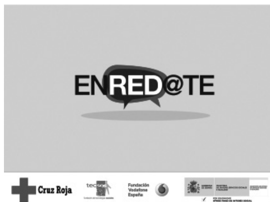
Figura 1. Pantalla de inicio de Enred@te.

La aplicación de video comunicación diseñada ad hoc , se ha implementado con la participación