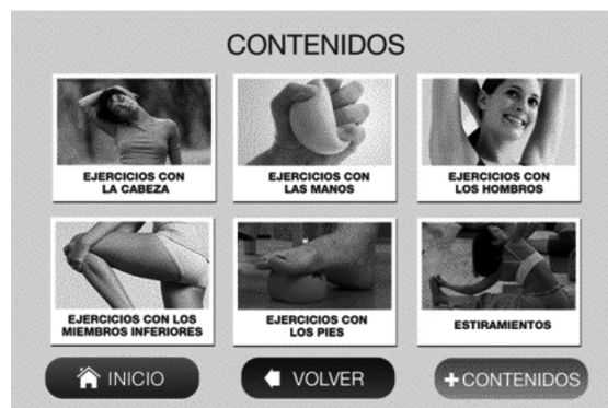
Página 1 de 8