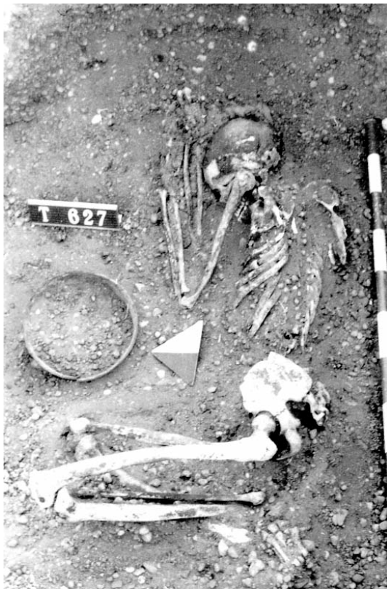
Figura 2.- Tumba 627, se puede apreciar la forma de enterramiento Kerma y la orientación del cuerpo dentro de la tumba (según Fernández 1982).

ciocho de mujeres y seis infantiles, datos de una población muy equitativamente distribuida que pudo haber correspondido a un pequeño asentamiento de pastores de entre 5 y 10 individuos. Por último se aprecian diferenciadores de rango social basados en el tamaño de la tumba, el lecho funerario -sobre el suelo, plancha de madera y/o cestería o lecho de madera- y la cantidad de ajuar, que señalan a las mujeres como poseedoras de un mayor estatus social que los hombres.