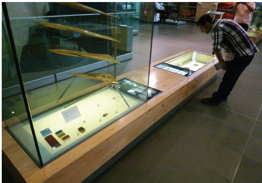
Fig. 2. Vitrina del Science Museum de Londres.