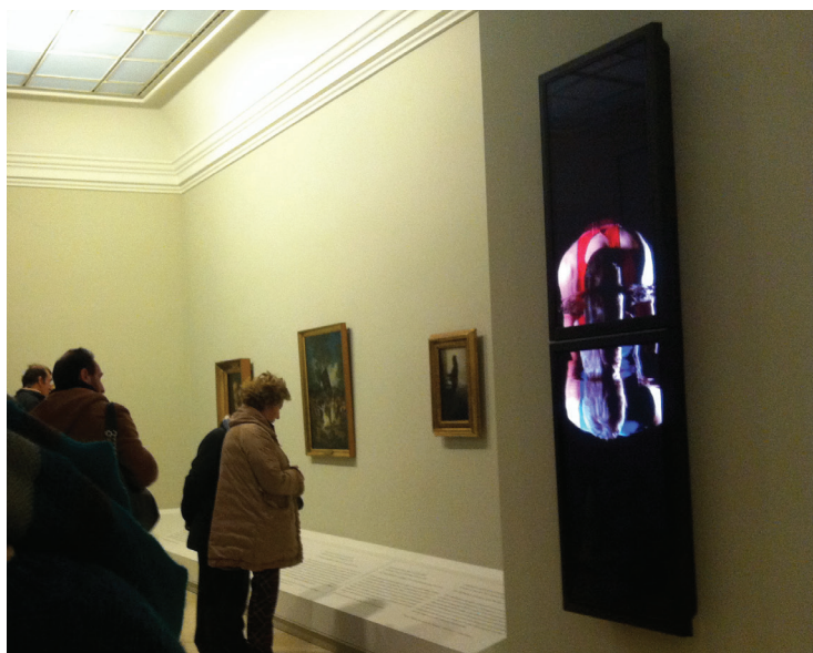
Fig. 1. Videoinstalación de Bill Viola en la Real Academia de Bellas Artes de San Fernando de Madrid.

La descontextualización de las piezas que se produce en el museo las condena a una muerte dulce, pero muerte. Darles vida para que interactúen con las personas, para que sigan levantando pasiones, continúa siendo el gran reto museográfico. Como también sigue siendo un gran reto museográfico aprovechar esa descontextualización para inducir a la reflexión sobre cualquier tipo de obra. Por ejemplo, la Real Academia de Bellas Artes de San Fernando ha introducido en sus salas obras de videocreación de Bill Viola ( Fig. 1 ) como manera de incitar a la sorpresa, a la reflexión, al goce.