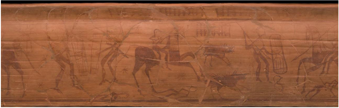
Figura 5. Fotografía del friso del "Vaso de los guerreros" de Archena. Proyecto Diáspora.