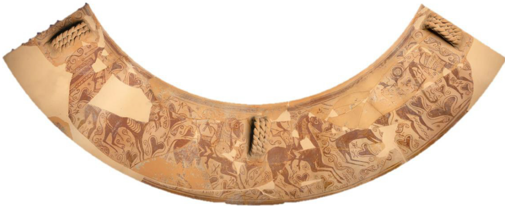
Figura 7. Vaso de los guerreros de La Serreta de Alcoy.

ni literarias, para esta práctica en el sureste peninsular.