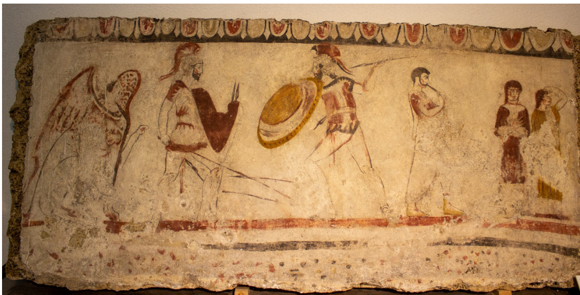
Figura 2. Panel norte de la tumba 58 de la necrópolis de Andriuolo. C.340 a. C. Obsérvese la aparición de un músico junto a una escena de duelo y, en el propio combate, la sangre manando de uno de los paladines.

Estados tuvieron un gran éxito en un primer momento. Así, en el sur de Estados Unidos y en el lejano y mítico Oeste se ha estudiado la paulatina desaparición del duelo desde diferentes perspectivas. Autores como Jensen y Ramey (2020) plantean que a medida que el Estado se fue haciendo más omnipresente en el Oeste americano en las décadas finales del siglo XIX, la práctica del duelo fue decaendo hasta su práctica desaparición en los albores de la I Guerra Mundial. Los autores utilizan como índice de la presencia estatal las oficinas de correos y su conclusión trae consigo la consideración de que el Estado ha sido la herramienta que ha logrado erradicar la violencia en la humanidad. 10 Otros autores, como Kingston y Wright (2010), plantean que el duelo servía ante todo para limpiar el honor, del cual dependía directamente el capital social y la capacidad del individuo para obtener recursos de cualquier tipo en sociedad. Por lo tanto, concluyen los autores, a medida que los mercados de crédito se hicieron más opacos e impersonales, el honor dejó de ser una garantía necesaria para obtener crédito y, al fin, el duelo dejó de ser efectivo.