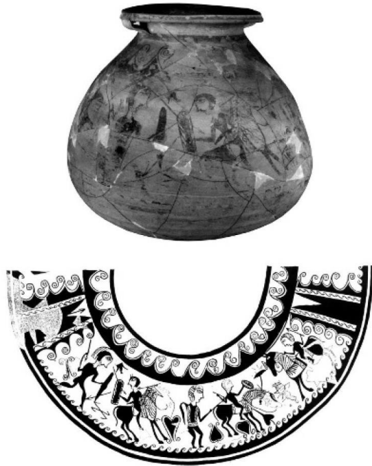
Figura 4. Fotografía y desarrollo de la tinajilla n° 86 de Liria. Dibujo según Bonet Rosado, 1995: 227. Fotografía en Fuentes Albero y Mata Parreño, 2009: 78.

1987: 34; 2003: 85; Tortosa Rocamora 1999; González Reyero y Rueda Galán 2010: 71; García Cardiel 2014a: 162).