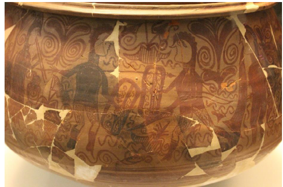
Figura 1. Fotografía del lebes nº 149 de Liria.

adiestramiento competitivo de la juventud ibérica en el manejo de las armas al ritmo de la música, descartando su identificación con cualquier tipo de munus (combate a muerte)” (Aranegui Gascó 1997: 101). Respecto al detalle de la escena en el que la lanza de uno de los infantes ha atravesado el escudo del enemigo, Aranegui Gascó detalla que se trataría del choque de armas en el contexto de la danza, al igual que en las escenas de los coribantes griegos.