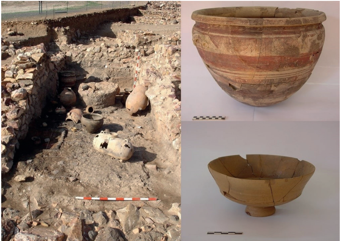
Fig. 3. Alarcos 2003, Sector IV-E (barrio ibérico). Recinto 3 del edificio tripartito con las cerámicas reconstruidas. Principios del siglo IV a.C.

2019: 74-77). Otros investigadores (Almagro y Moneo 2000: 55; Fernández 2021; Benítez, Esteban y Hevia 2004: 78) también se harán eco de la existencia de este santuario.