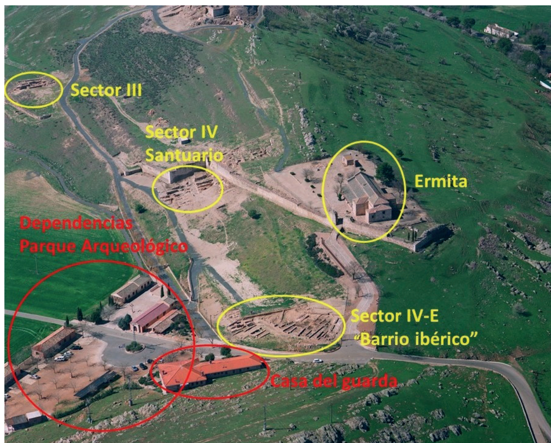
Fig. 4. Vista aérea del yacimiento ibérico de Alarcos con indicación de las partes más importantes, 2006.