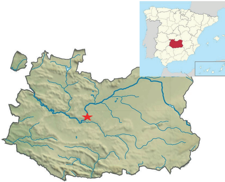
Fig. 2. La estrella localiza el oppidum ibérico de Alarcos en la margen izquierda del río Guadiana.

Poblete, junto a la existencia de una ermita dedicada a la Virgen de Alarcos explican que sea un lugar frecuentado, especialmente el día de la romería, que se celebra cada año el lunes de Pentecostés (Fig. 2).