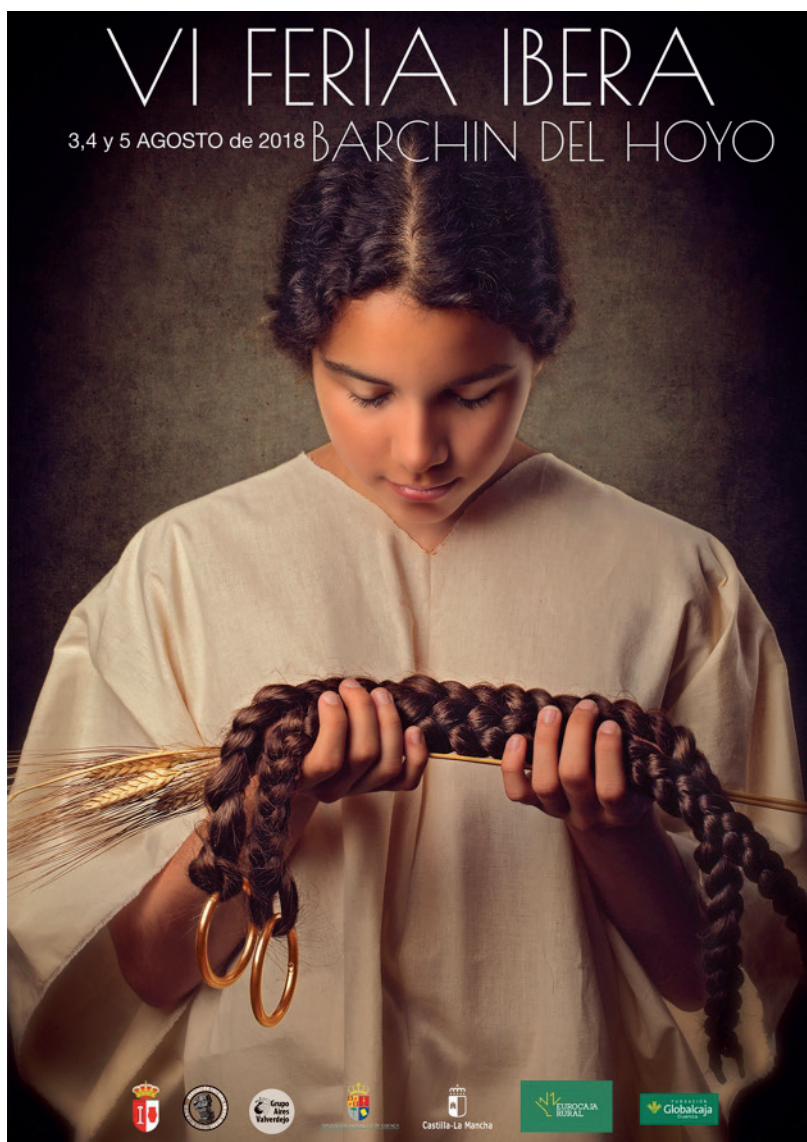
Fig. 2. Cartel anunciador de la VI Feria Ibera de Barchin del Hoyo, año 2018. Escenifica el rito de paso de la infancia a la madurez de la mujer ibera, representado por la ofrenda de las trenzas infantiles a la diosa. Autor de la fotografía y el cartel Maxi Roldán (mrs@comunicación).

Las Fiestas se inician con un recorrido por diferentes enclaves arqueológicos visitables de Cartagena, así como la Casa Consistorial. Las demás actividades se desarrollan en el llamado Campamento Festero con entrada libre, ubicado en el estadio municipal Cartagonova, y también en Cala Cortina junto al muelle del puerto. Destacan las recreaciones históricas de la fundación de Qart Hadasht, la destrucción de Sagunto, la Sesión del Senado Romano, la Boda de Aníbal e Himilce, el Oráculo de Tanit, la marcha de Aníbal a Roma, el desembarco de la armada romana, los desfiles de tropas y legiones y la Batalla por la conquista de Qart-Hadasht. Además, se organizan un mercado,