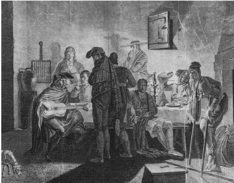
Ilustración 1. Dutailly (dibujo); Robert Delaunay (grabado): Vista interior de una posada en el Reino de Valencia, para el Voyage pittoresque et historique de l'Espagne de Alexandre de Laborde (ca. 1811), en el que se aprecia una escena costumbrista con dos sujetos cantando a la guitarra

La población de Valencia resistió sendos asedios en 1808 y 1810, aunque se rindió ante el mariscal Suchet en enero de 1812, acogiendo después a José I y su corte durante casi siete semanas. En julio de 1813 fue ocupada por el general Villacampa, convirtiéndose en abril de 1814 en el escenario del retorno triunfal y el golpe de estado encubierto de Fernando VII 10 . En este periodo, las librerías de la ciudad pusieron a la venta un considerable volumen de canciones de influencia patriótica que fueron probablemente consumidas en todo tipo de eventos de la sociedad valenciana: desde las tertulias de la alta sociedad hasta los festejos improvisados en tabernas y posadas (ilustración 1).