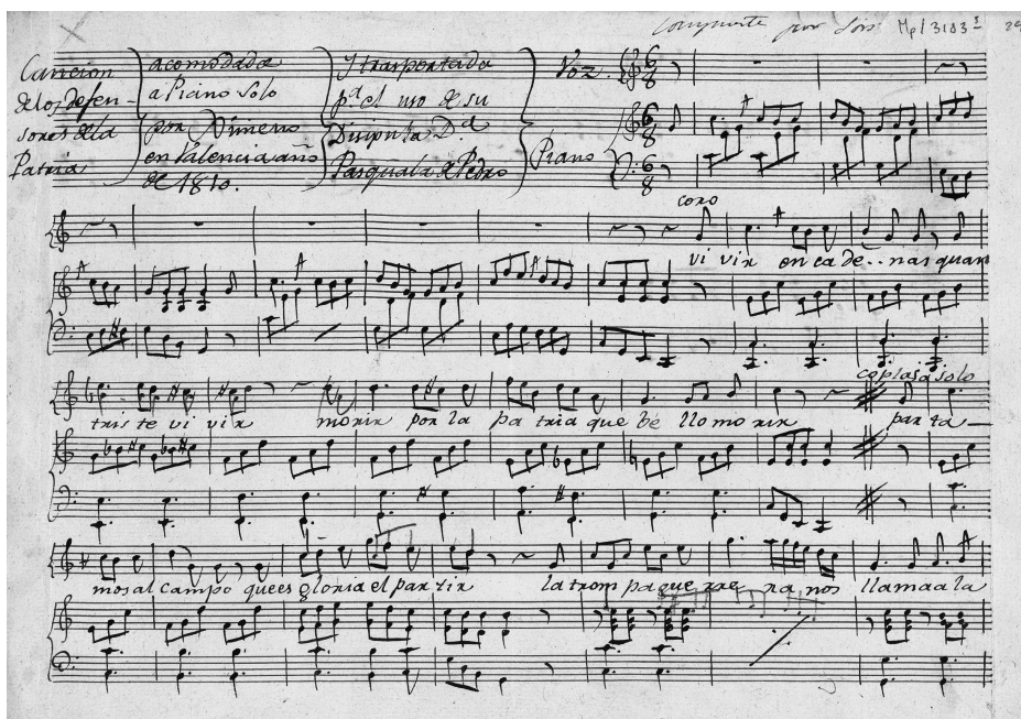
Ilustración 2. Primera página de la partitura Los Defensores de la Patria , adaptada por Francisco Ximeno en Valencia en 1810 de la original de Fernando Sor, E-Mn: MP/3183/5 (BNE)