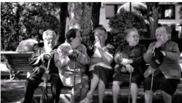
Fig. 5. “El mayor cuidado” (SEEGG)