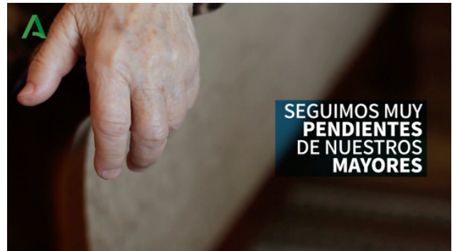
Fig. 12. "Cuidamos a nuestros mayores (Junta de Andalucía)