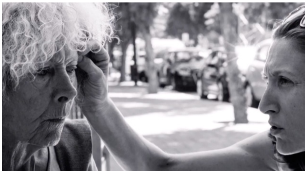
Fig. 24. “El mayor cuidado” (SEEGG)