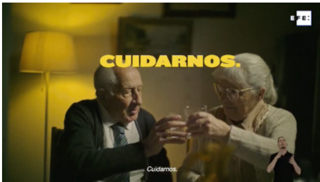
Fig. 1. “El mejor regalo es cuidarnos” (Gobierno de España)