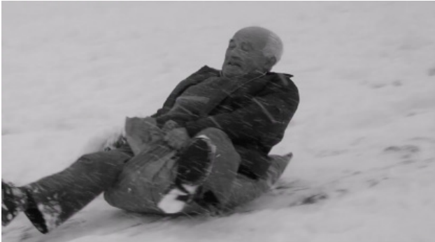
Figs.7, 8. "El mayor cuidado" (SEEGG)

Encontramos seis escenas repartidas en tres cuñas donde se infantiliza a las personas adultas mayores a través de comportamientos plasmados en las imágenes. Estas escenas tienen un efecto caricaturesco, ya que la actividad que realizan se encuentra totalmente dentro del marco de la infancia. Este comportamiento infantilizado de las personas adultas mayores es sobre todo llamativo en la cuña de la SEEGG. En esta se ve, por ejemplo, una señora mayor auscultando a la médica o enfermera como lo haría un niño pequeño jugando al doctor (Fig. 7); un hombre mayor que se divierte en el trineo, actividad peligrosa practicada sobre todo por los niños (Fig. 8); o una persona mayor realizando actividades infantiles con los propios niños (Fig. 9.) Aunque no de manera tan prominente como en la cuña de la SEEGG, este comportamiento infantilizado se observa también en en el ejemplo de la Fig. 10.