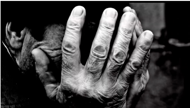
Fig. 11. "El mayor cuidado" (SEEGG)