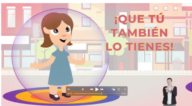
Figs. 20 y 21. "Sana Distancia. La heroína"

Según afirma la heroína, este "poder" es también propio del "tú" al que ella se dirige ("¿Sabes qué es lo mejor? (.) ¡Que tú también lo tienes!") y que se representa en la escena como una niña (Fig. 20). Esta es la tercera razón por la que se podría pensar que la cuña ha sido pensada para un público infantil. Pero lo que más llama la atención es que al final del video aparezcan dos personas mayores en la posición en la que la niña y la heroína activaron el "súper poder" contra el virus (Fig. 21). De esta manera, los adultos mayores son incluidos dentro del marco infantil y fantástico que caracteriza a la cuña: