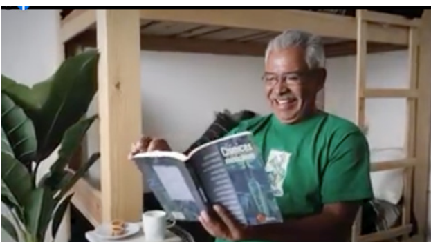
Fig. 17. "Qué hacer en casa" (Gobierno del Estado de Oaxaca)