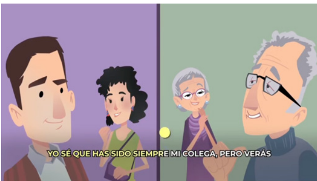
Fig. 13. "Ciérrale la puerta al virus" (Gobierno de México)