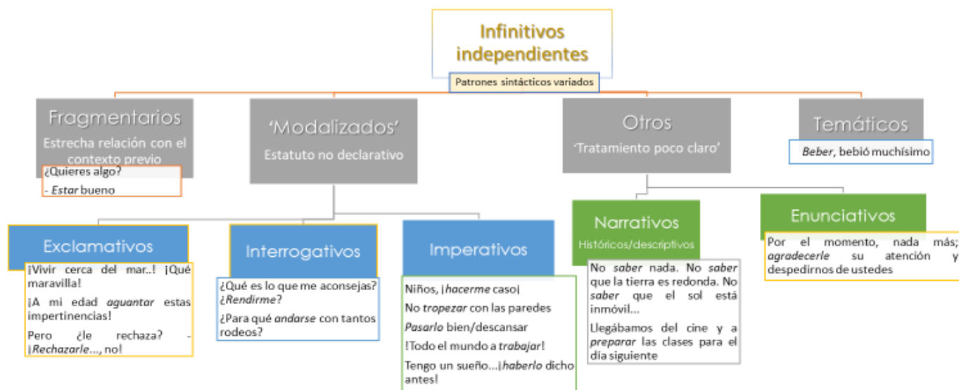
Gráfico 1. La clasificación de los infinitivos independientes en Hernanz (1999, pp. 2332-42).

En el siguiente gráfico representamos de forma esquemática la clasificación más detallada que se puede deducir de la exposición de Hernanz, citando, para cada clase, algunos de los ejemplos utilizados en el trabajo: