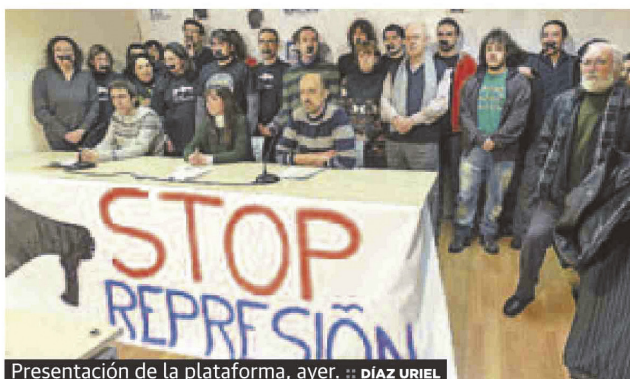
Presentación de la plataforma, ayer.

:: LA RIOJA. La plataforma ‘Stop Represión’, que se presentó ayer, exigió a la Fiscalía regional que investigue si hubo irregularidades en la actuación policial tras la manifestación del pasado 14 de noviembre (14N) y si la Delegación del Gobierno en La Rioja dispone de una «lista negra» con personas a las que expedientar.