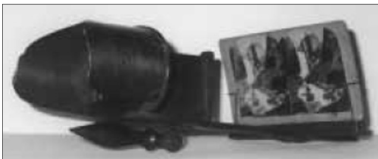
Figura 1.4. Un estereoscopio del siglo XIX.