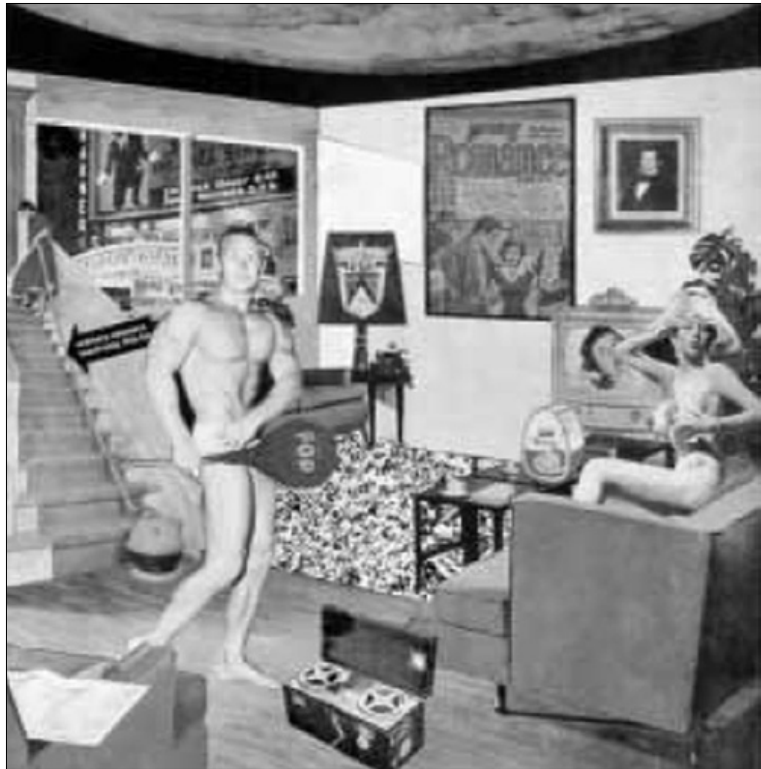
Figura 1.5. Richard Hamilton, Just What Is It That Makes Today's Homes So Different, So Appealing? © 1998 Artist Rights Society (ARS) New York DACS London.