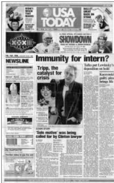
Figura 1.6. La portada de USA Today, del 25 de enero de 1998.