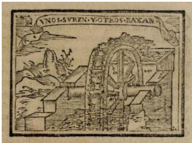
Fig. 7. Detalle del emblema 55 de la centuria III: Unos suben y otros baxan , en Covarrubias Horozco, Sebastián de: Emblemas morales , Madrid, Luis Sánchez, 1610, dedicados al duque de Lerma 18 , fol. 255r-v. Biblioteca de la University of Illinois at Urbana-Champaign.