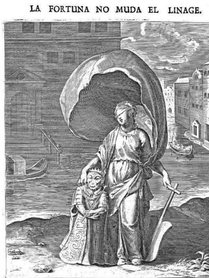
Fig. 2. Otto van Veen, emblema 51 La Fortuna no muda linage en el Theatro moral de la vida humana en cien emblemas... , Amberes, Henrico y Cornelio Verdussen, 1701, pp. 103. BIDISO.

Aunque suba al Regio Throno Ayudado de Fortuna, Nada le sirve de abono: Que el que Mono fue en la cuna, Siempre ha de quedar-se Mono.