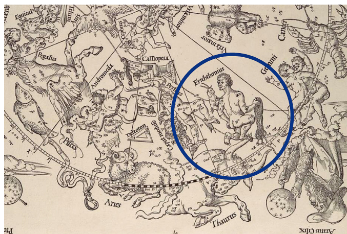
Fig. 9. Detalle de la constelación del Auriga (Erictonio) en el mapa celeste del hemisferio norte realizado por Alberto Durero para el Almagesto de Claudio Ptolomeo, Núremberg, 1515. Nueva York, The Metropolitan Museum of Art.

El propio Márquez Torres juega con esta doble alegoría Atlante-Hércules para referirse a la ayuda que el duque de Uceda había prestado a su padre el duque de Lerma, reemplazándolo como protagonista en la Jornada de las Entregas de las princesas y colaborando desde 1615 en el ejercicio de muchos de los cargos y responsabilidades que tenía el valido 21 :