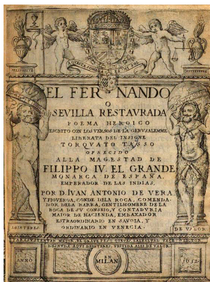
Fig. 12. Portada de El Fernando o Sevilla restaurada , del conde de la Roca, Juan Antonio de Vera y Figueroa, Milán, Henrico Estefano, 1632. Viena, Österreichische Nationalbibliothek, BE.7.L.36.

nell'arduoconfronto con le istituzioni”, en Martinengo, A.: Al margen de Quevedo. Paisajes naturales. Paisajes textuales , Nueva York, Idea, 2015, pp. 13-32.