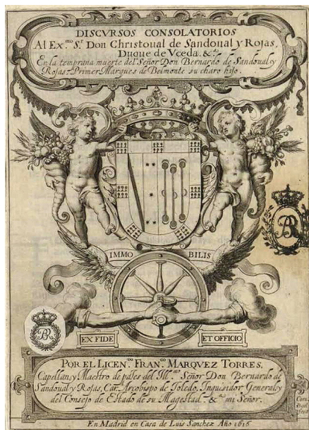
Fig. 6. Portada grabada por Cornelis Boel para la obra de Márquez Torres, Francisco: Discursos consolatorios... , Madrid, Luis Sánchez, 1616. Madrid, Biblioteca Nacional de España, 3/53467.

Retomando la imagen de la rueda de una noria, a la que Sebastián de Covarrubias Horozco dedica el emblema 55 de la centuria III bajo el lema Unos suben y otros baxan (Fig. 7) 16 para referirse a las vanas mudanzas de los privados, Márquez Torres recurre a ella como símbolo del castigo que reciben los ambiciosos: “que apenas han llenado los arcaduzes de sus deseos, quando subiendo arriba llenos, buelven a baxar vacíos, para bolver a llenarse: hechos otros Sisifos en lo infinito de su trabajo, pues mientras viven, no le ven el fin” 17 .