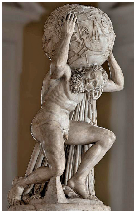
Fig. 10. Atlas sujetando la esfera celeste (Atlas Farnesio), copia romana de una escultura helenística, siglo II a.C. Mármol. Nápoles, Museo Arqueológico Nacional, Inv. 6374.

Que los reyes tienen largas manos [...] las de su poder [...]. Y si podemos decir, que siendo las manos de los Reyes dos, y aviendo de ser la derecha del sabio y robusto Atlante, el Excelentissimo Señor Duque de Lerma, mi señor, a V. Excelencia como a su ayudante Hércules, que le alivia el grave peso que con prudencia nunca vista sustenta, toca la siniestra mano. Que no fue (creo) sin particular providencia de Dios: pues por aver enfermado la mano derecha, que avia de dar y recibir dones tan grandes; fue necesario averse de aprovechar de la mano izquierda, que lo es del corazón, y que también es símbolo de felicidad y próspero sucesso en los Augurios antiguos [...] Que si la diestra da amoroso abraço, la siniestra sirve de almohada blanda y regalada donde reposo. Y si a estas circunstancias [las Entregas en el Bidasoa] añadimos la entera salud, con que el Duque mi señor ha quedado de la acometida indisposición, que no fue menos que un acometido eclipse del segundo Sol que alumbra a España, y que tanto Su Magestad (que le comunica esta luz) sintió: bien diremos, que circunstancias de pena y dolor aparente deven desocupar con justa razón el alma, para que la ocupe tanta alegría 22 .