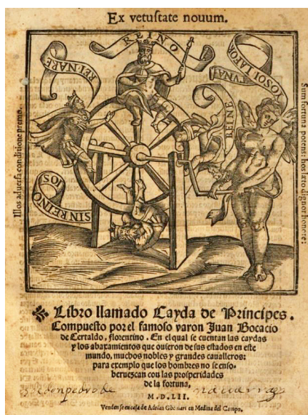
Fig. 1. Portada del Libro llamado Cayda de Principes , de Giovanni Boccaccio, Alcalá de Henares, Juan de Brocar, 1552. Viena, Österreichische Nationalbibliothek (ÖNB), *38.A.34.

Como es difícil forjar de barro Estatuas que conserven por largo tiempo la memoria de sus dueños, y imposible fabricar famosos y durables edificios sobre montañas de movediza arena, assi es difícil, y aun imposible, que el hombre vil, y de ruines costumbres (por mas riquezas que adquiera) pueda encubrir los defectos de su nacimiento, ni alcanzar jamas los meritos de una antigua, loable, y virtuosa Nobleza. [...] Bien pueden las riquezas engañar, dando el lustre exterior a un picaro ganapan, mas no tienen la fuerza, y poder de mudar el interior. [...] Confirma esta doctrina el presente Emblema, donde la loca y ciega Fortuna (que tiene plazer en postrar los prudentes, y cuerdos, y entronizar los locos y atrevidos) emplea todos sus desatinados esfuerços en exaltar un Mono hasta la purpura, y no obstante todas sus vanas diligencias, los ricos ornamentos, y las insignias Reales de Corona y Ceptro, siempre tiene de Bestia mas que de Rey 10 .